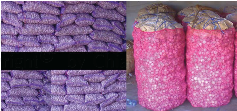
ภาพที่ ผ13 กระเทียมที่บรรจุในบรรจุภัณฑ์ (ถุงตาข่าย) พร้อมจำหน่าย