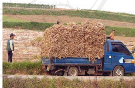
ภาพที่ ผ3 รถบรรทุกรับจ้าง 6 ล้อ