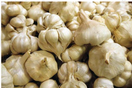
ภาพที่ ผ11 กระเทียมหัวเดี่ยว