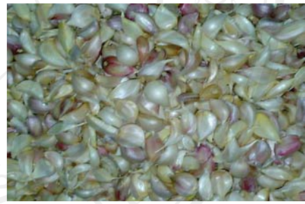
ภาพที่ ผ12 กระเทียมแกะกลีบ