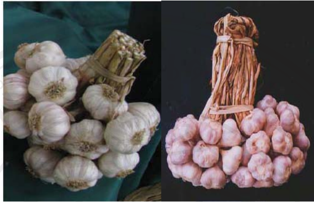
ภาพที่ ผ10 กระเทียมมัดจุก