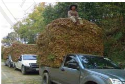
ภาพที่ ผ2 รถกระบะรับจ้าง 4 ล้อ