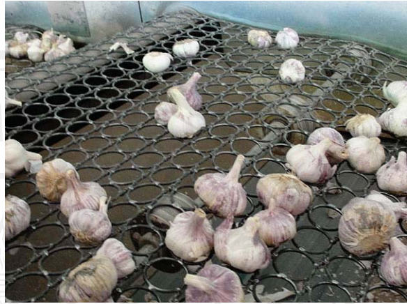
ภาพที่ ๘ เครื่องคัดขนาดกระเทียมหัวเดียว