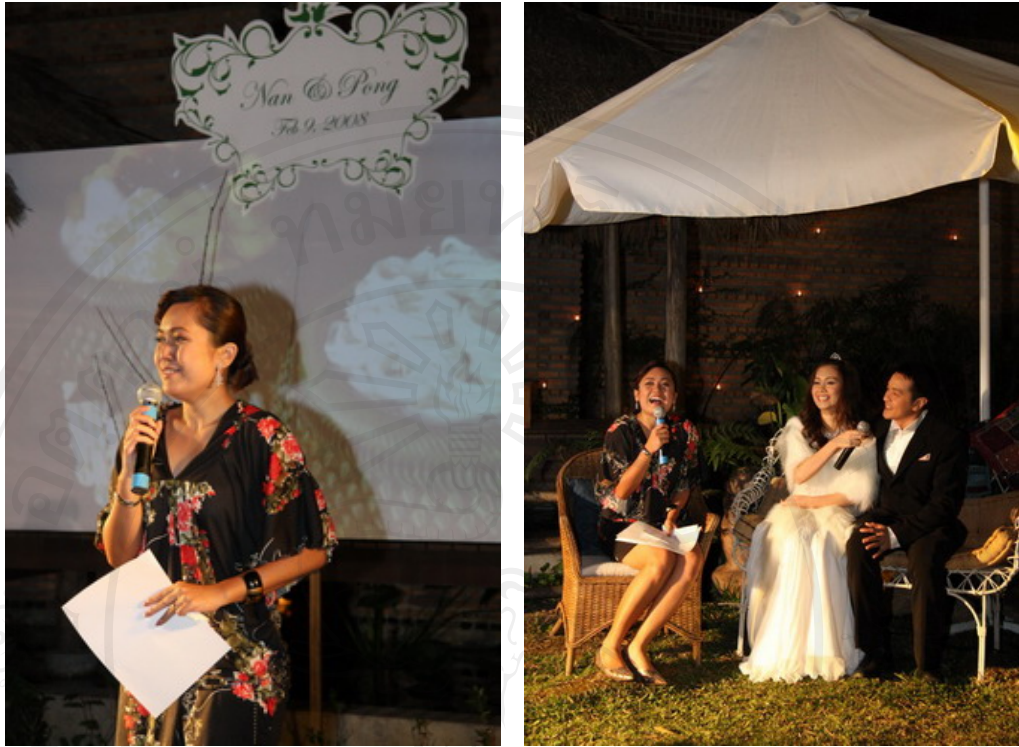
การจัดหาผู้ดำเนินรายการและจัดเตรียมบทพูด (Script)