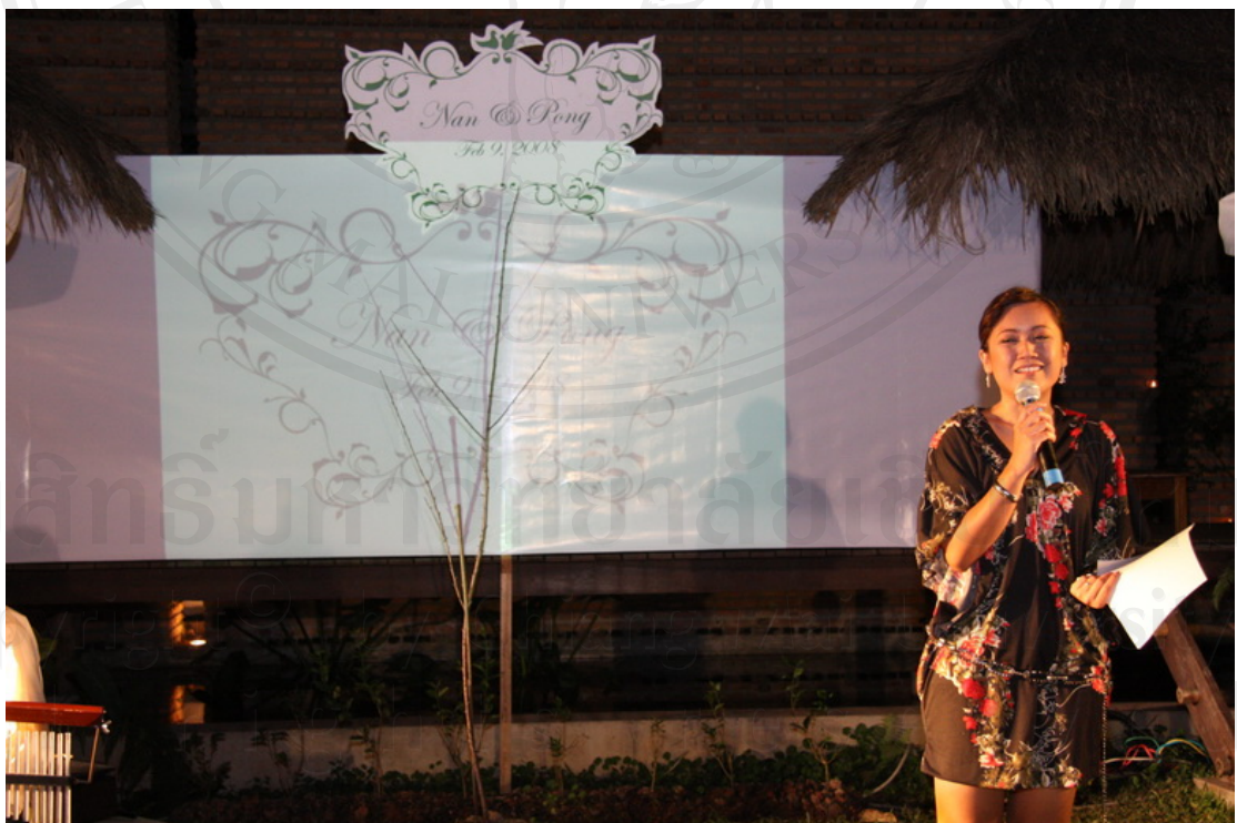
บริการจัดเตรียม Presentation