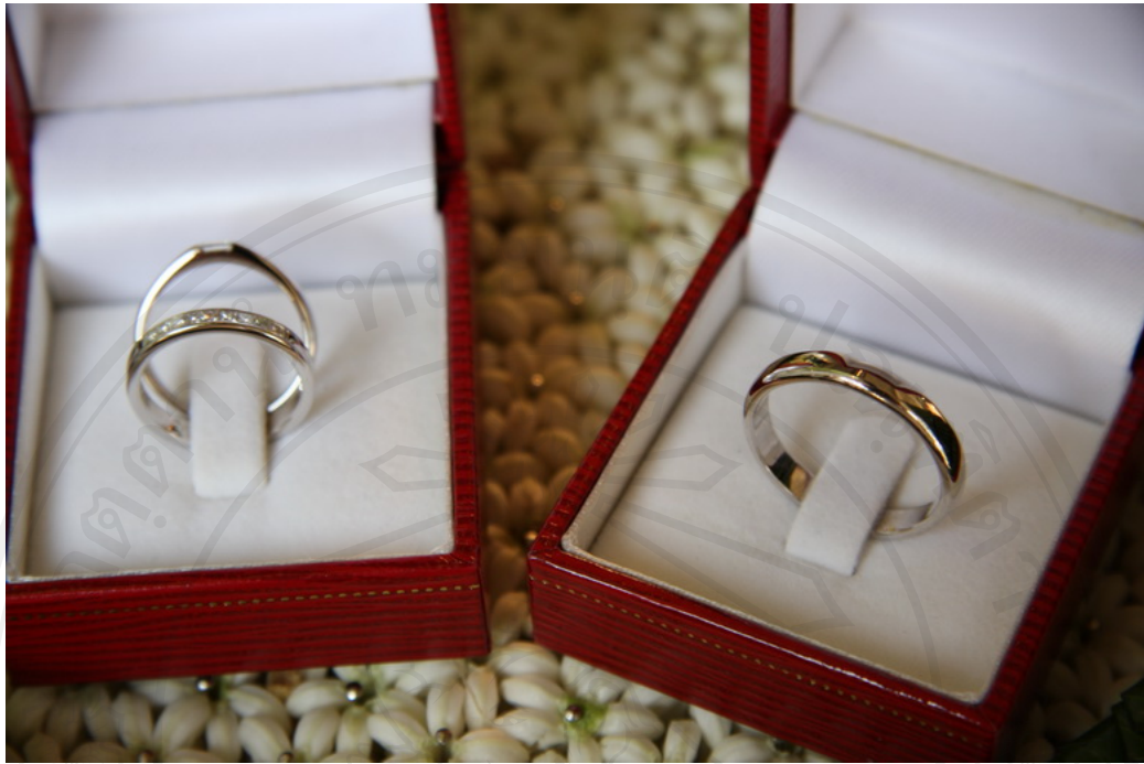
บริการจัดหา ออกแบบ และผลิตแหวนหมั้น อัญมณีและแหวนแต่งงาน