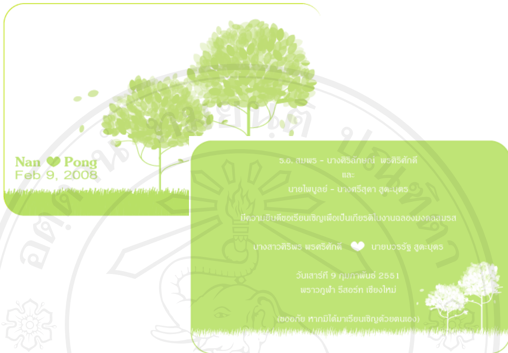
บริการออกแบบและผลิตการ์ดแต่งงาน