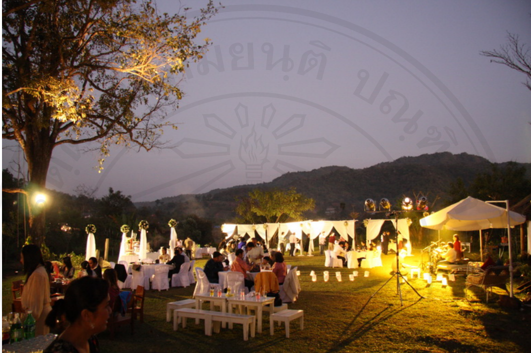
บริการด้านจัดเตรียมเครื่องเสียง / แสง