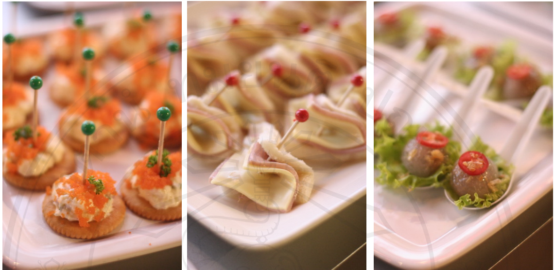
บริการจัดหา จัดเตรียมอาหาร เครื่องดื่ม