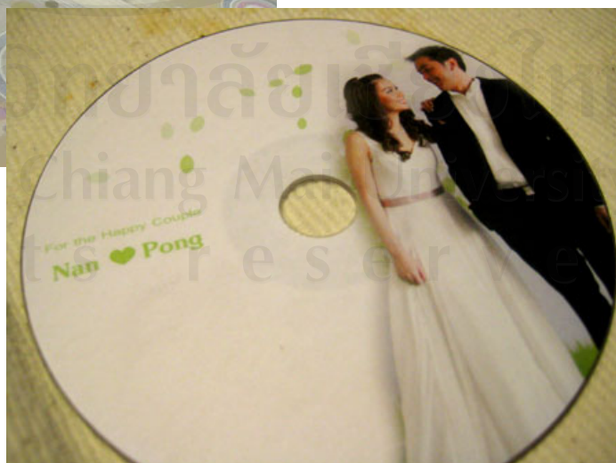
บริการจัดหา ออกแบบ ผลิตของขวัญและของชำร่วย