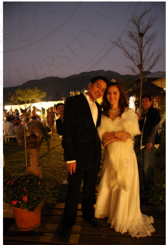
บริการด้านเครื่องแต่งกาย