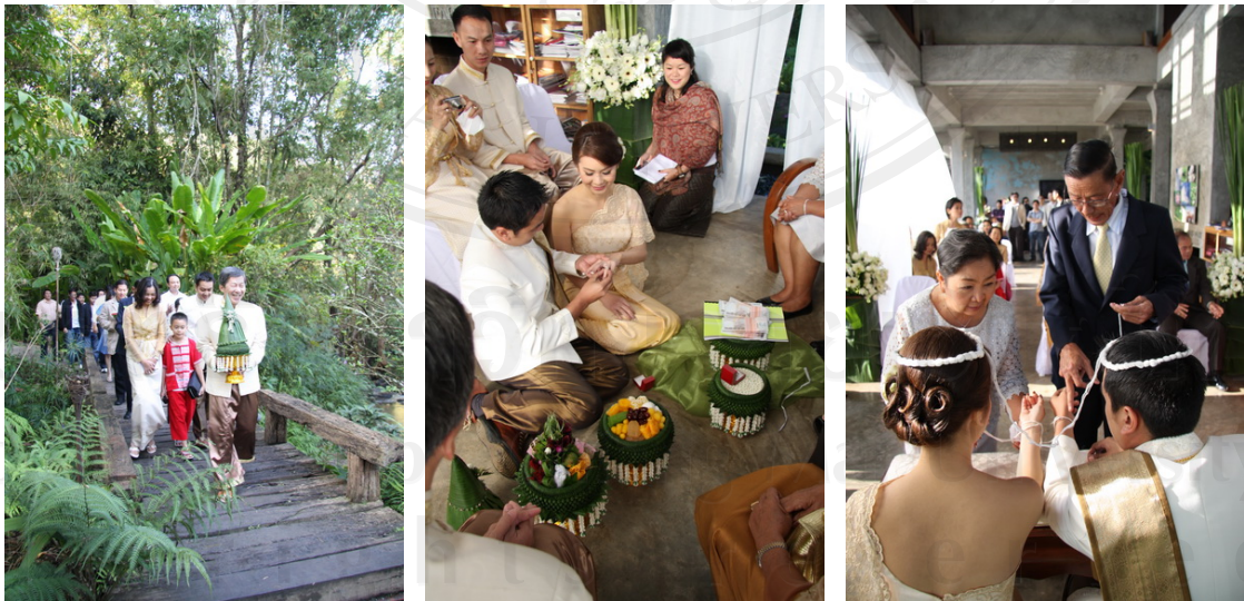
การควบคุมลำดับรายการกิจกรรมตลอดงาน (Sequence)