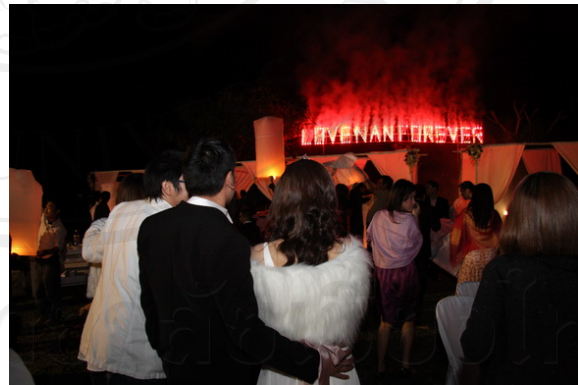
บริการจัดหาและควบคุมเทคนิคพิเศษ เช่นพลุ เปเปอร์ชูต เป็นต้น