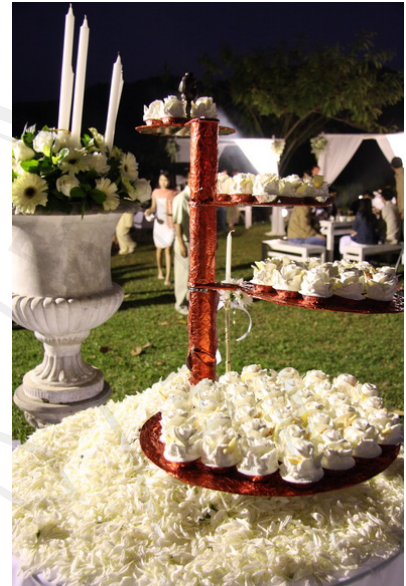
บริการจัดหา จัดเตรียมเค้กแต่งงาน