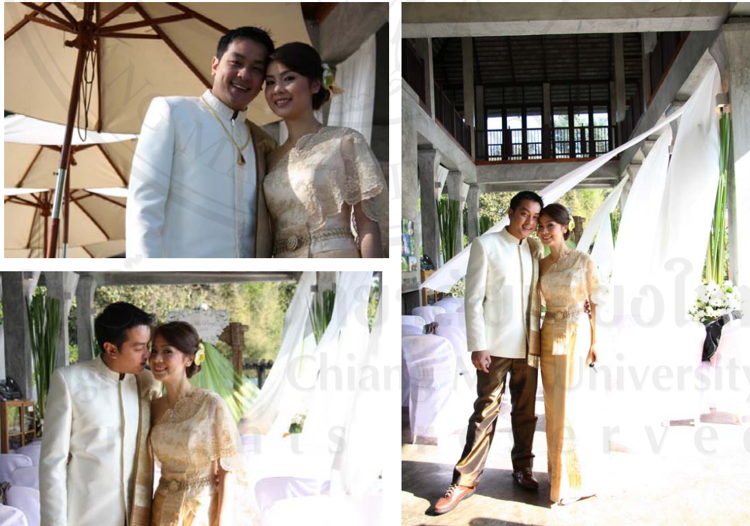
บริการด้านการถ่ายภาพ