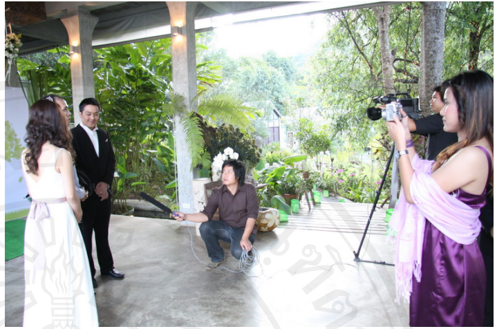
บริการถ่ายบันทึกเทป/วิดีโอ/บันทึกเสียง