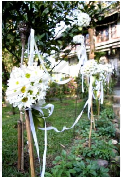
บริการออกแบบ และจัดเตรียมด้านการตกแต่งดอกไม้