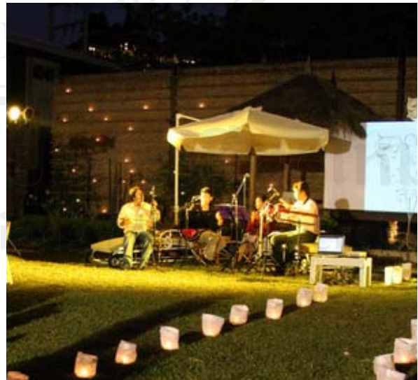
บริการจัดหากิจกรรมดนตรี