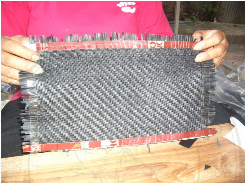
ภาพที่ 7 หนังแผ่นที่สานเสร็จ