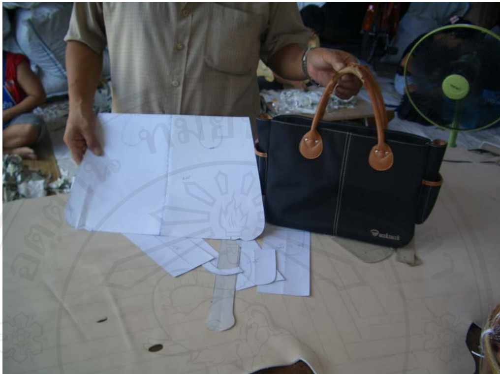
ภาพที่ 1 แบบกระเป๋าทำด้วยกระดาษแข็ง