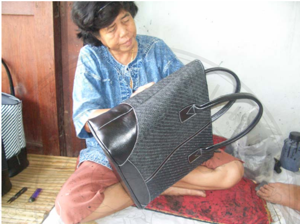
ภาพที่ 9 การเก็บรายละเอียด