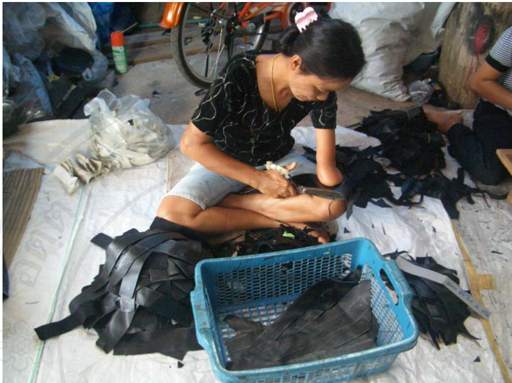
ภาพที่ 3 ภาพการตัดหนัง