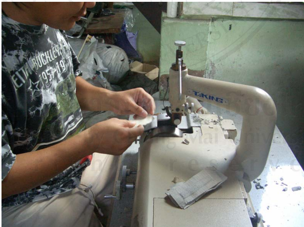
ภาพที่ 4 การปลอกริมหนัง