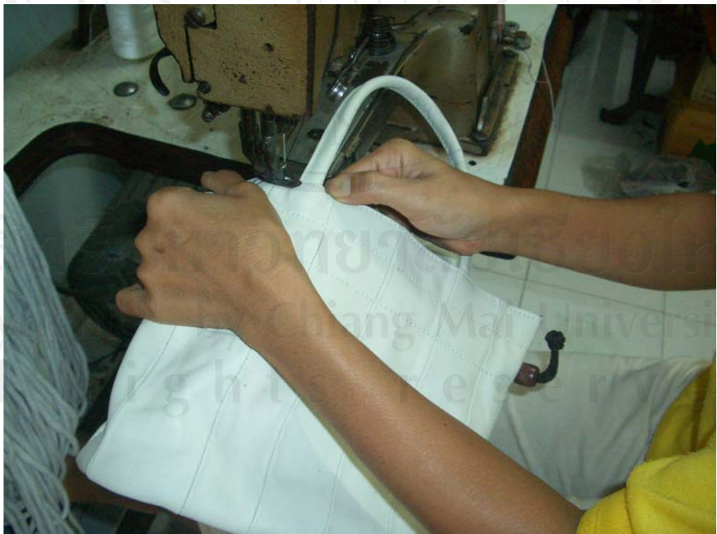
ภาพที่ 8 การเย็บกระเป๋า