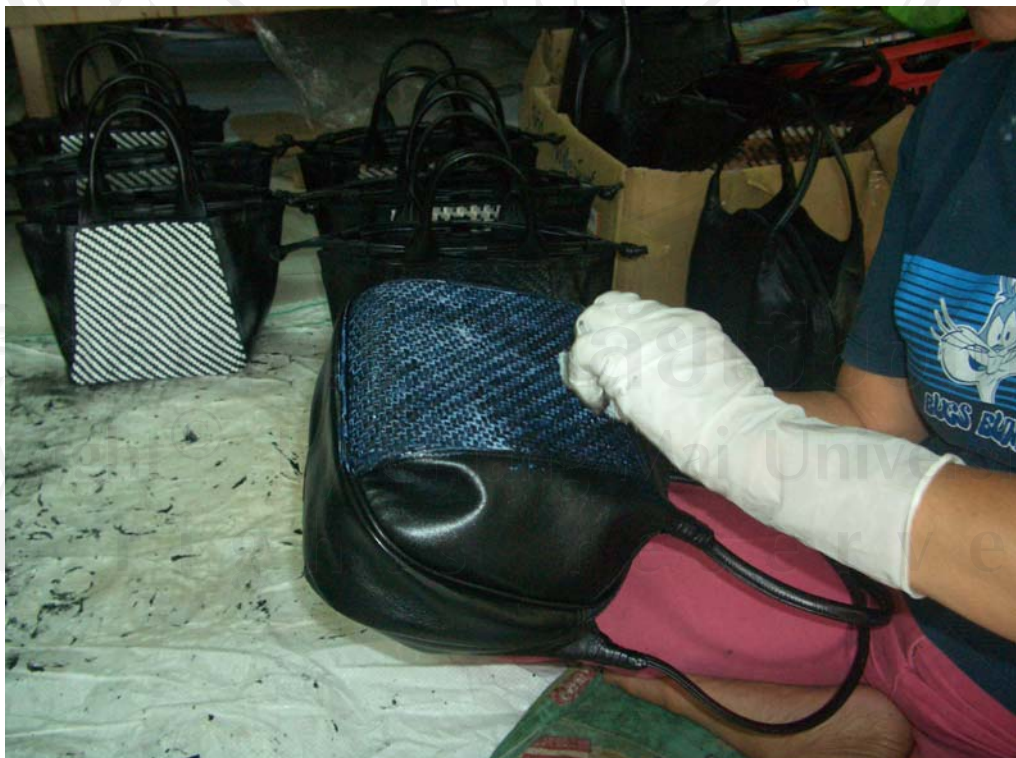
ภาพที่ 10 การทาสีหนัง