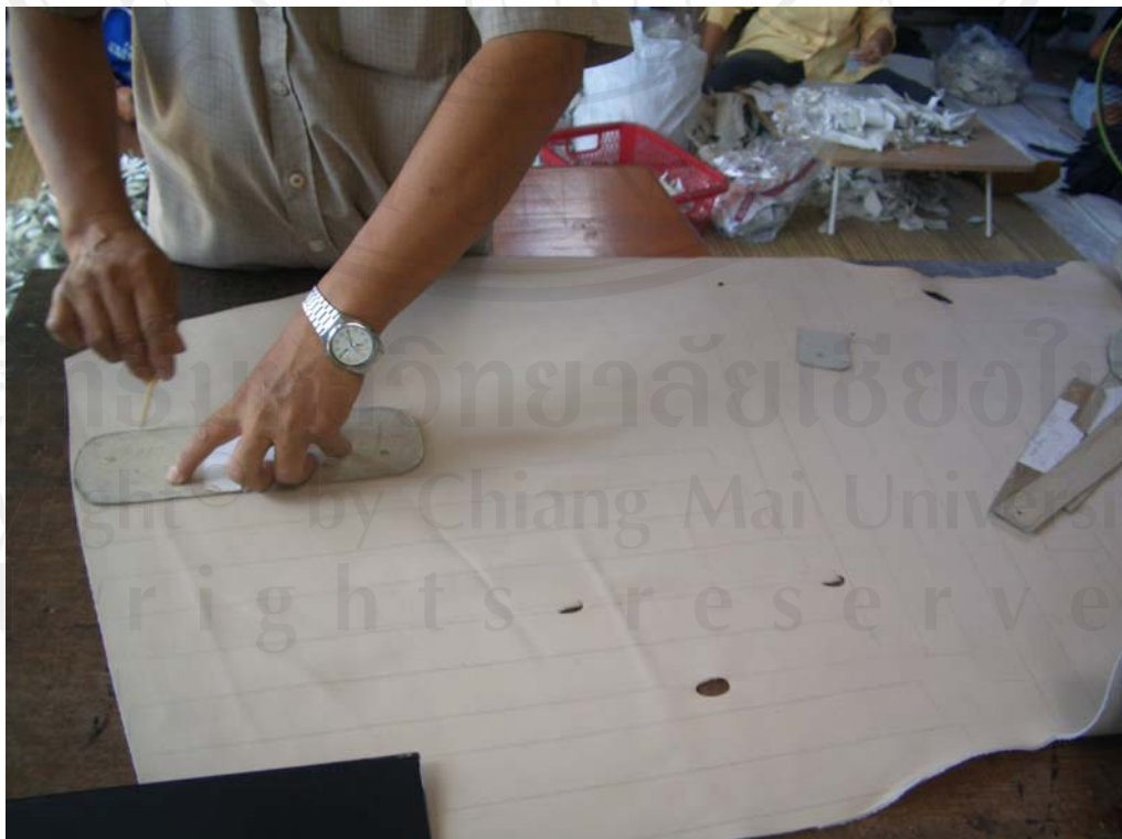
ภาพที่ 2 การวัดหนัง ตามแบบกระดาษแข็ง