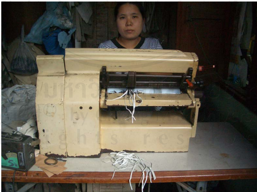
ภาพที่ 6 การซอยหนัง เป็นเส้น