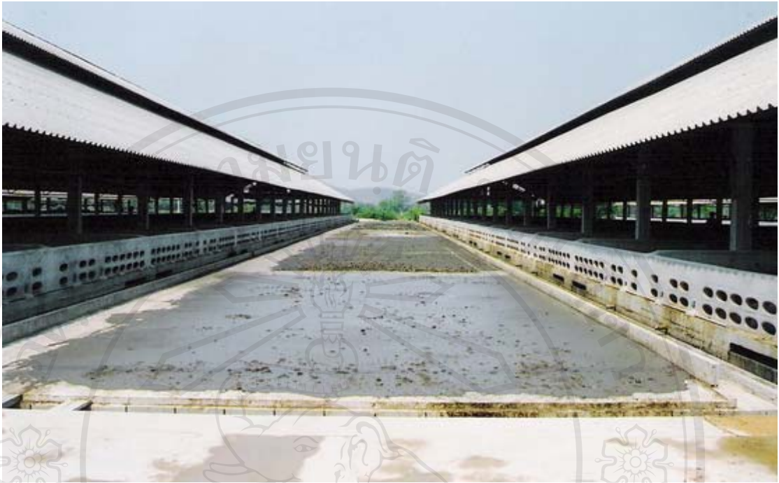
รูปที่ 32 ภาพถ่ายลานตากมูลสุกรของณรงค์ฟาร์ม