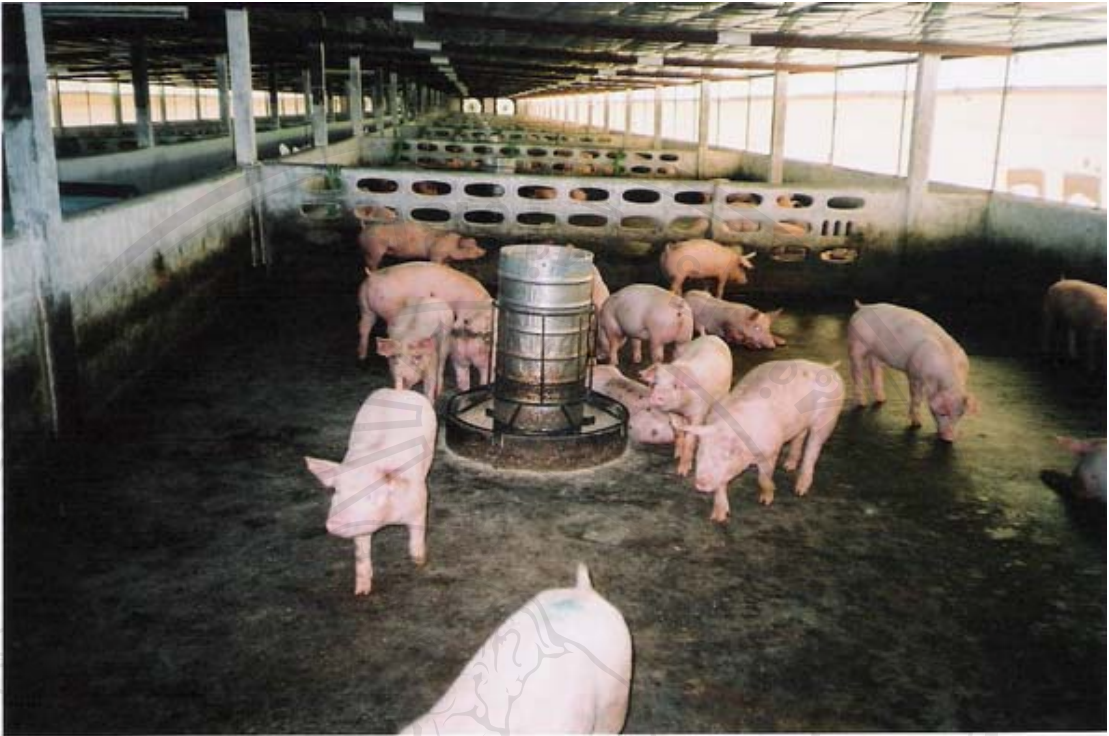
ภาพที่ 18 ภาพถ่ายสุกรขุนและสภาพภายในโรงเรือนของมณีรัตน์ฟาร์ม