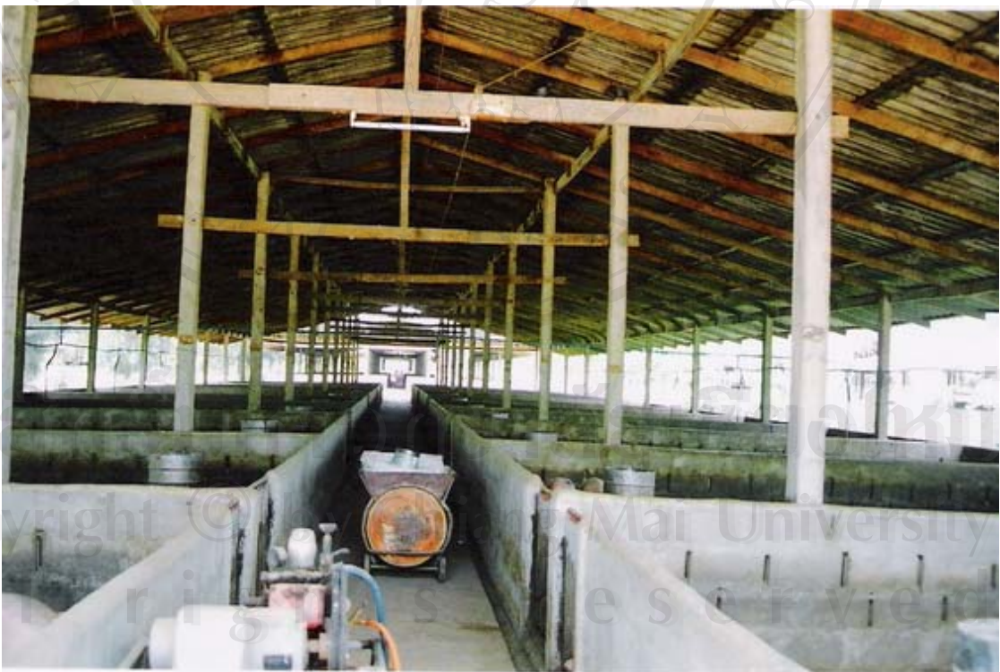
รูปที่ 25 ภาพถ่ายสภาพภายในโรงเรือนของบิ.พี.เอส.ฟาร์ม