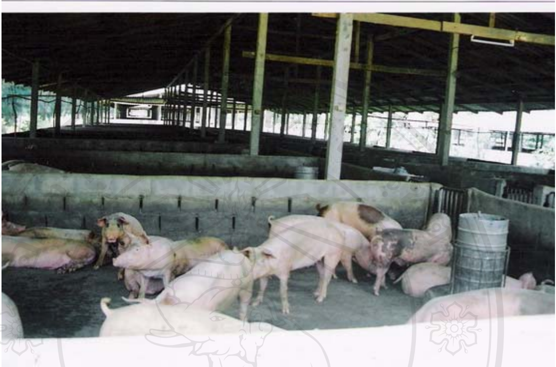
รูปที่ 26 ภาพถ่ายสุกรขุนและสภาพภายในโรงเรือนของบี.พี.เอส.ฟาร์ม