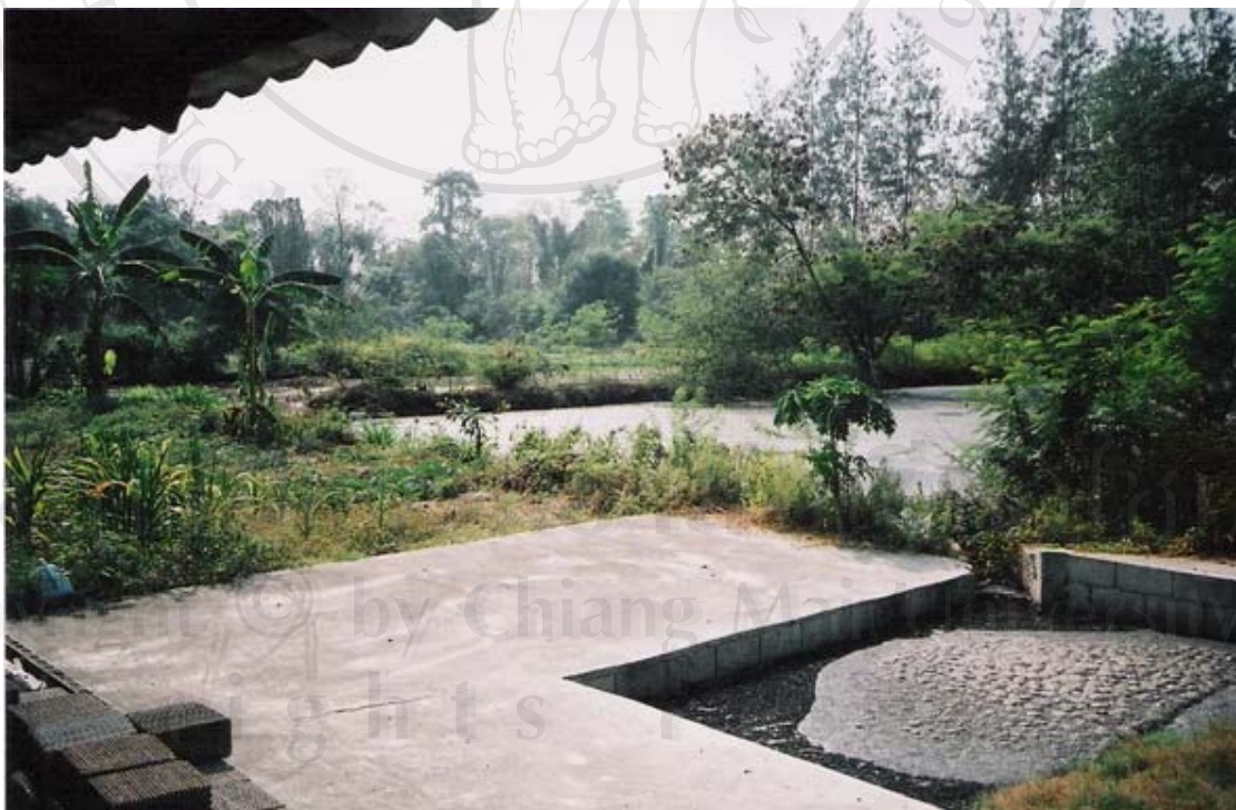
ภาพที่ 21 ภาพถ่ายบ่อน้ำบำบัดน้ำเสียของมณีรัตน์ฟาร์ม