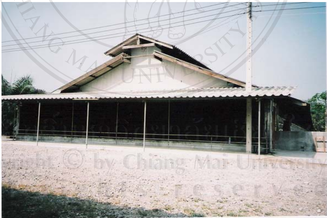
รูปที่ 17 ภาพถ่ายลักษณะโรงเรือนของมณิรัตน์ฟาร์ม

ลิขสิทธิ์ Copyright © All rights reserved