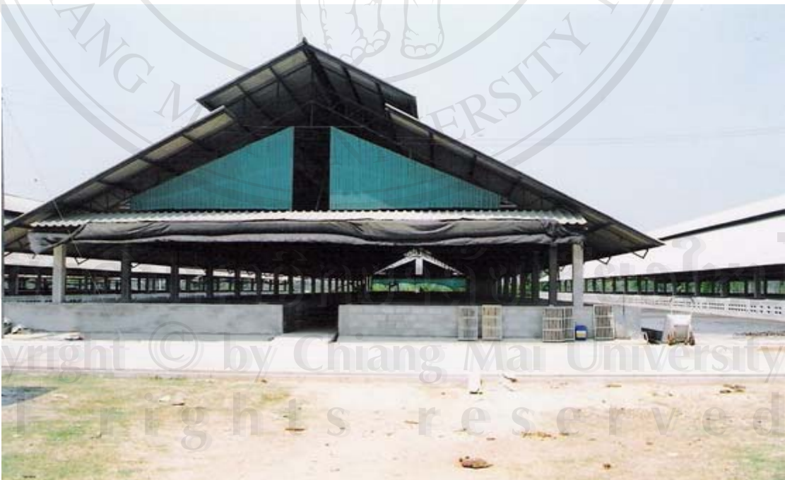
รูปที่ 29 ภาพถ่ายลักษณะโรงเรือนของนรงค์ฟาร์ม