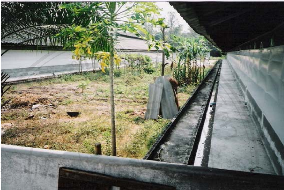
ภาพที่ 20 ภาพถ่ายระบบท่อระบายของเสียจากโรงเรือนของมณีรัตน์ฟาร์ม