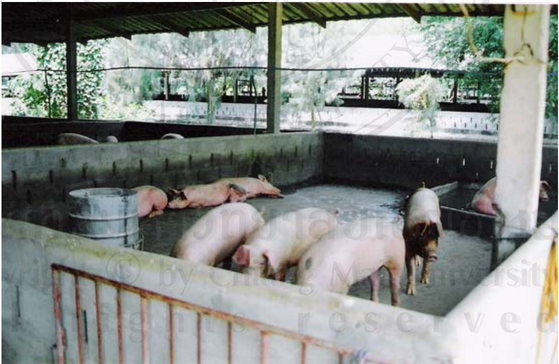
รูปที่ 27 ภาพถ่ายสุกรขุนและสภาพภายในโรงเรือนของของบี.พี.เอส.ฟาร์ม

ลิขสิทธิ์ Copyright © by Chiang Mai University All rights reserved