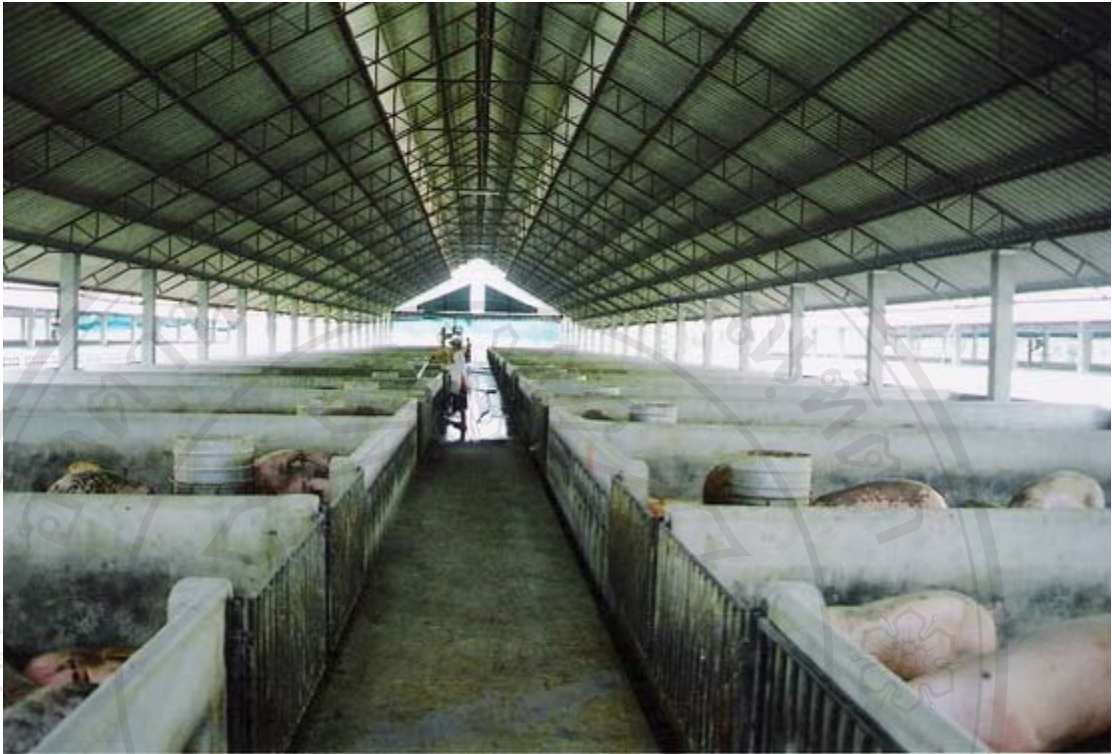
รูปที่ 30 ภาพถ่ายสุกรขุนและสภาพภายในโรงเรือนของณรงค์ฟาร์ม