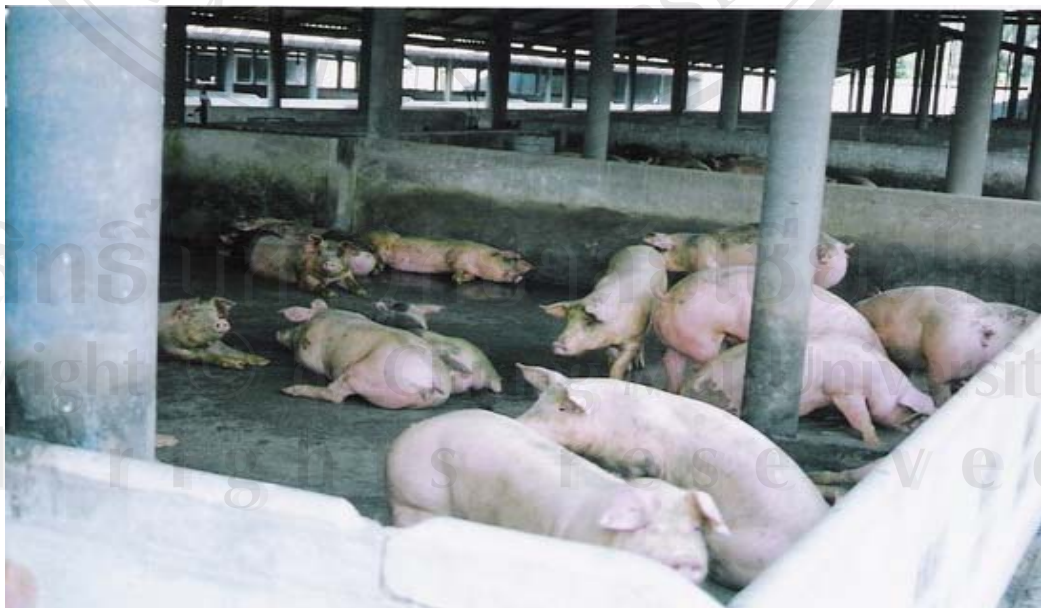
รูปที่ 15 ภาพถ่ายสุกรขุนและสภาพภายในโรงเรือนของฟาร์มเพาะพันธุ์