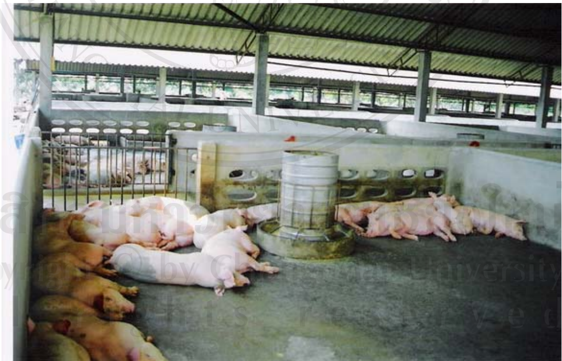
รูปที่ 31 ภาพถ่ายสุกรขุนและสภาพภายในโรงเรือนของณรงค์ฟาร์ม