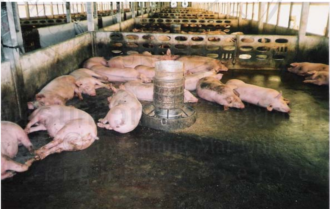
ภาพที่ 19 ภาพถ่ายสุกรขุนและสภาพภายในโรงเรือนของมณีรัตน์ฟาร์ม