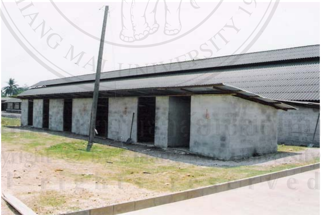
รูปที่ 33 ภาพถ่ายโรงเก็บมูลสุกรที่ตากแห้งแล้วของณรงค์ฟาร์ม

ลิขสิทธิ์ Copyright © All rights reserved