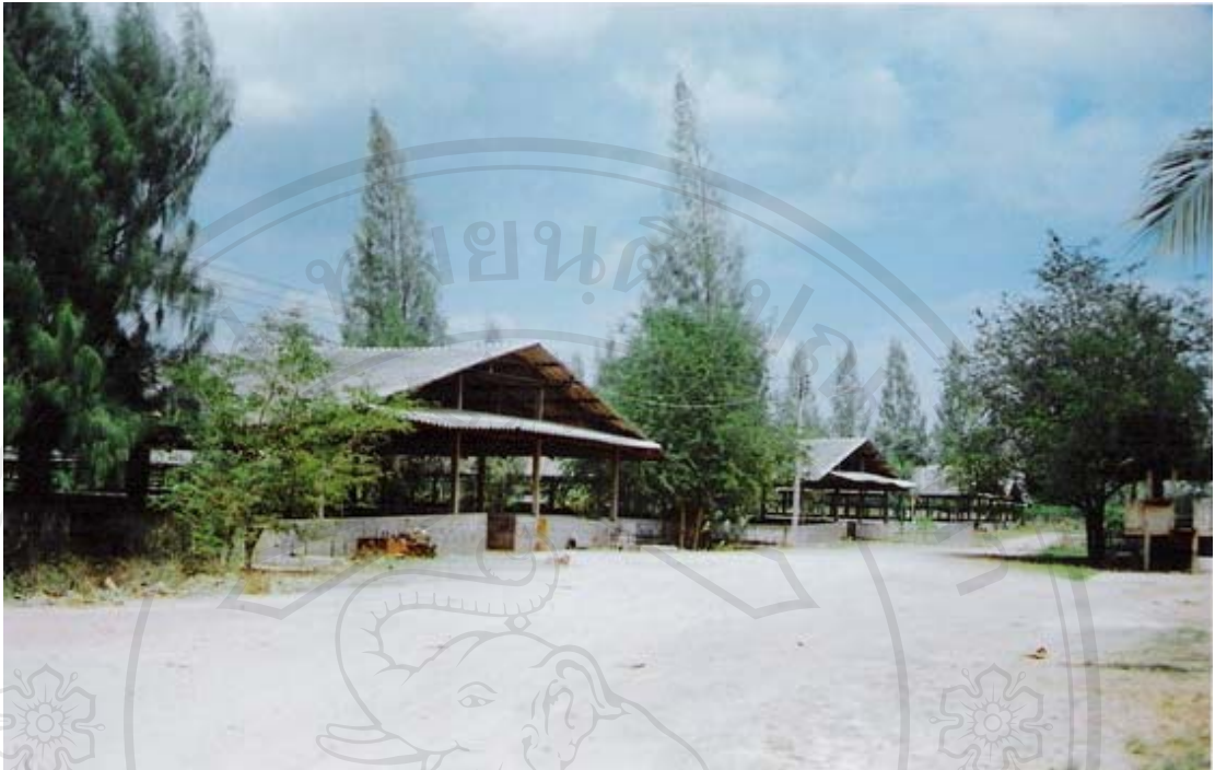
รูปที่ 24 ภาพถ่ายบิ.พี.เอส.ฟาร์ม