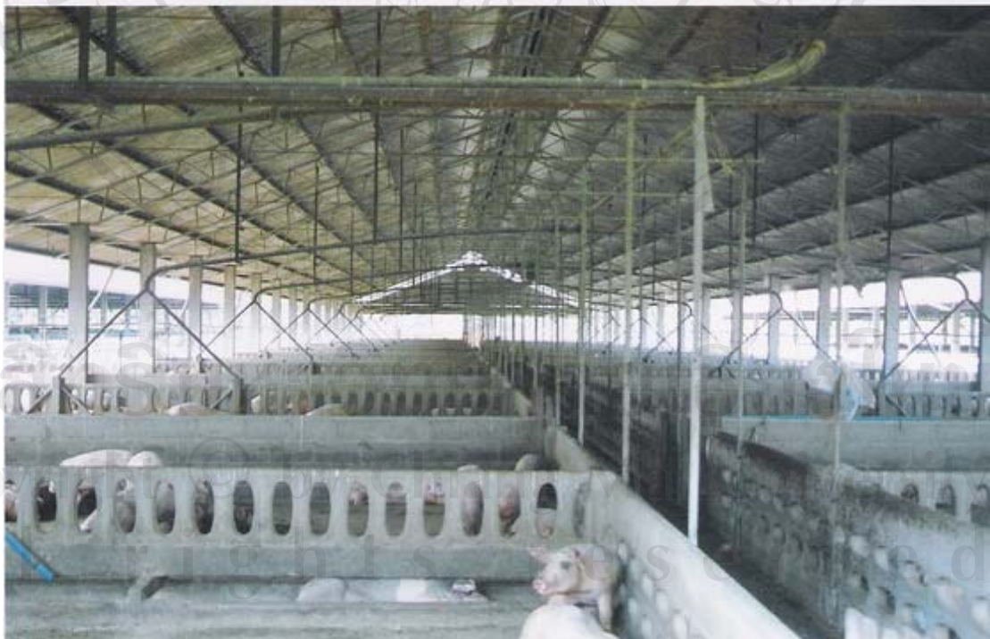
รูปที่ 23 ภาพถ่ายสุกรขุนและสภาพภายในโรงเรือนของเจษฎาฟาร์ม