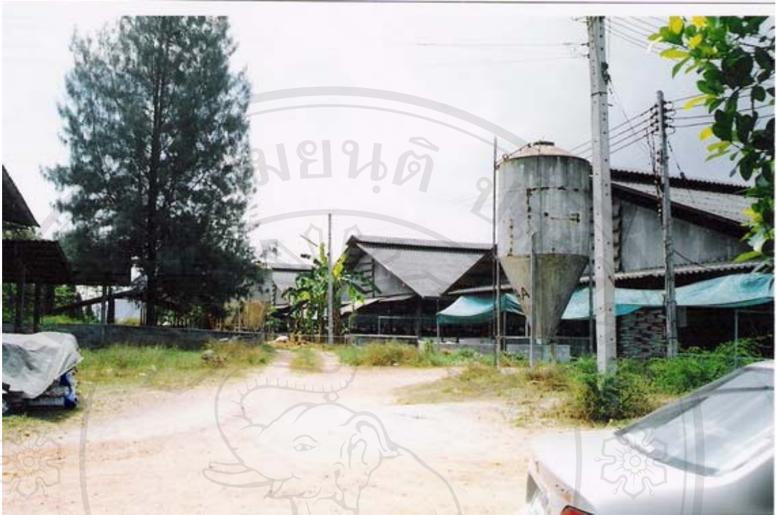
รูปที่ 22 ภาพถ่ายเจษฎาฟาร์ม