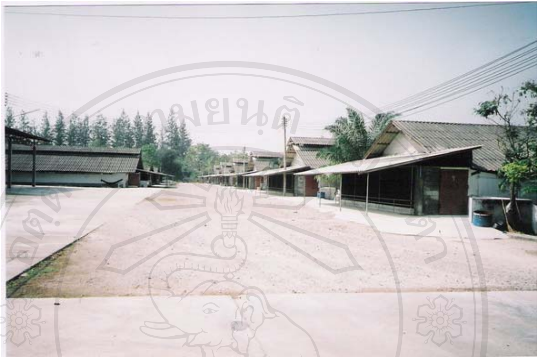
รูปที่ 16 ภาพถ่ายมณิรัตน์ฟาร์ม