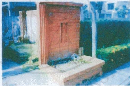
ภาพที่ 3 แสดงสิ่งก่อสร้างด้วยบล็อกประสาน