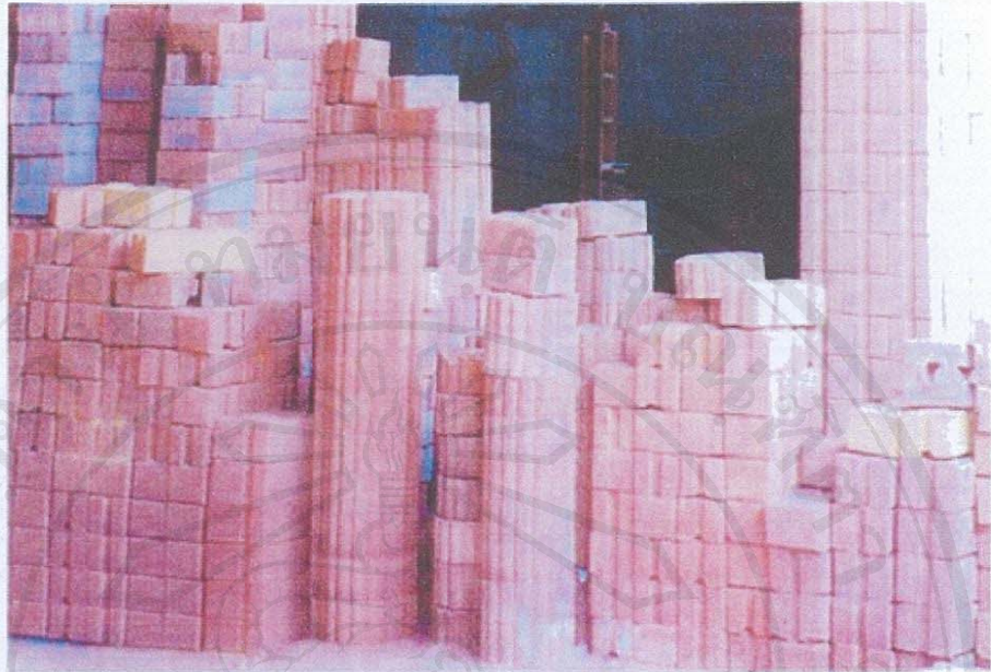
ภาพที่ 1 แสดงบล็อกประสาน