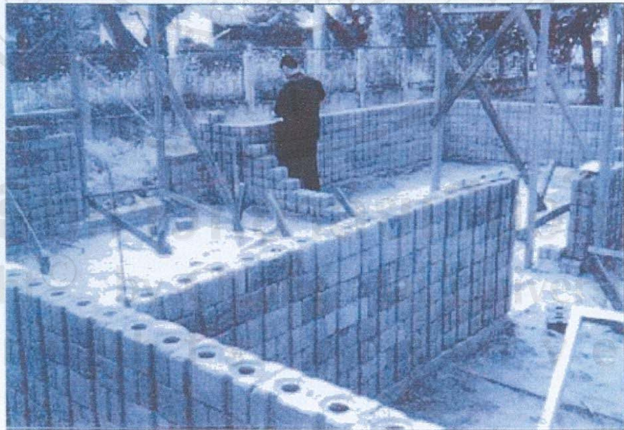
ภาพที่ 2 แสดงกำลังก่อสร้างด้วยบล็อกประสาน