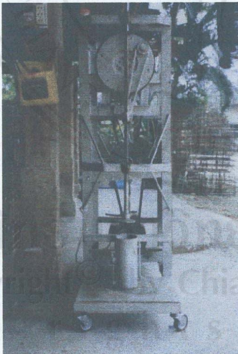
รูป ก.12 ภาพเครื่องอัดก้อนเชื้อเห็ดหอม