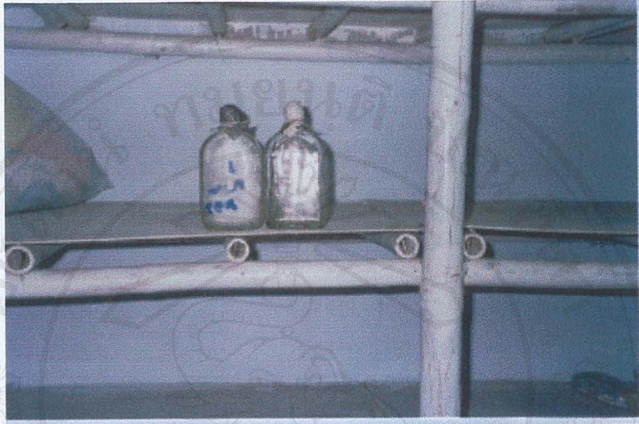
รูป ก.1 ภาพขวดแม่เชื้อหรือเชื้อบริสุทธิ์