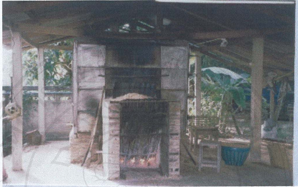
รูป ก.11 ภาพหม้อนึ่งก้อนเชื้อเห็ดหอมแบบหม้อนึ่งความดัน