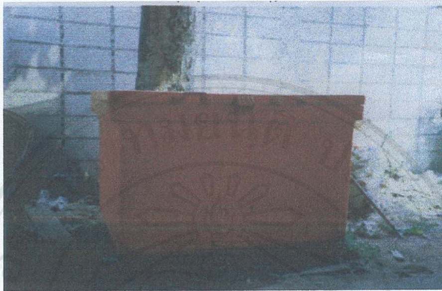
รูป ก.13 ภาพถังแช่ดอกเห็ดหอม