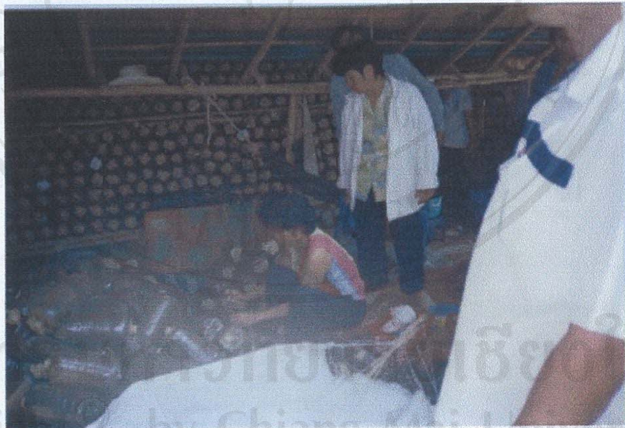
รูป ก.4 ภาพการทำก้อนเชื้อเห็ดหอม