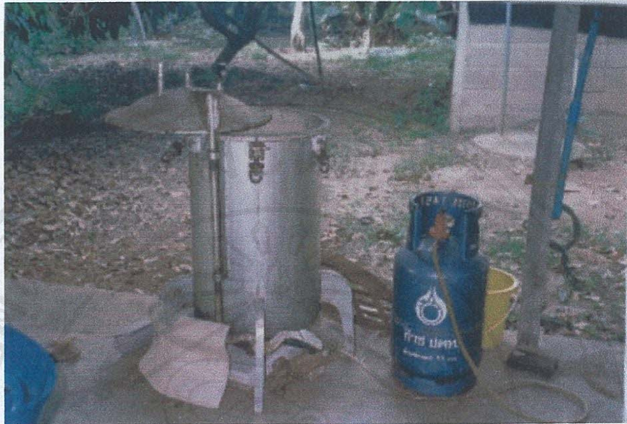
รูป ก.9 ภาพหม้อนึ่งหัวเชื้อเห็ดหอม