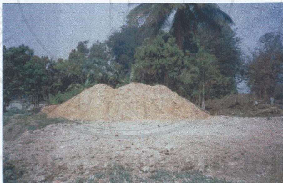
รูป ก.6 ภาพขี้เลื่อยไม้ยางพาราสำหรับทำก้อนเชื้อเห็ดหอม