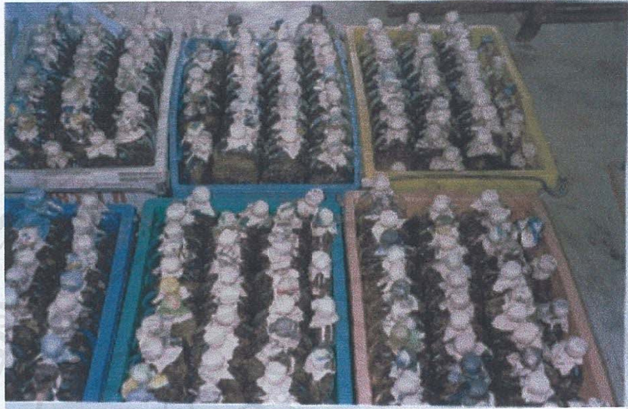
รูป ก.3 ภาพขวดหัวเชื้อในเมล็ดข้าวฟ่างรอการนึ่ง