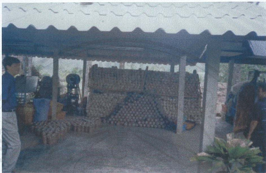
รูป ก.5 ภาพบริเวณทำก้อนเชื้อเห็ดหอม