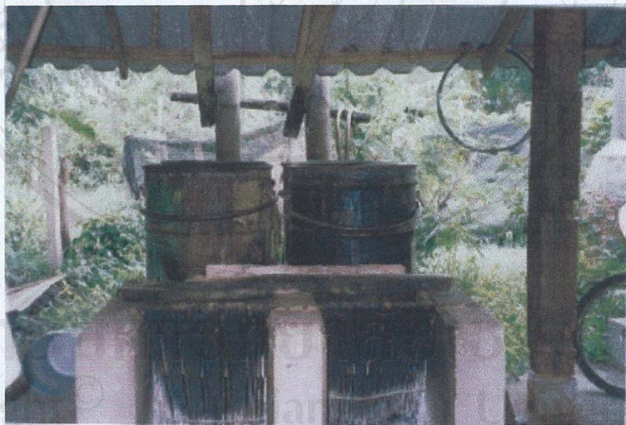
รูป ก.10 ภาพหม้อนึ่งก้อนเชื้อเห็ดหอมแบบหม้อนึ่งลูกทุ่ง