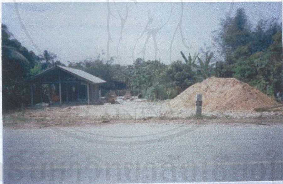
รูป ก.14 ภาพสถานที่เพาะเลี้ยงเห็ดหอมของกลุ่มเพาะเลี้ยงเห็ดหอมและเห็ดอื่น ๆ ตามโครงการพัฒนาเศรษฐกิจระดับชุมชน