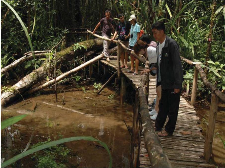
รูปที่ 4.4 พุหนองปลิง