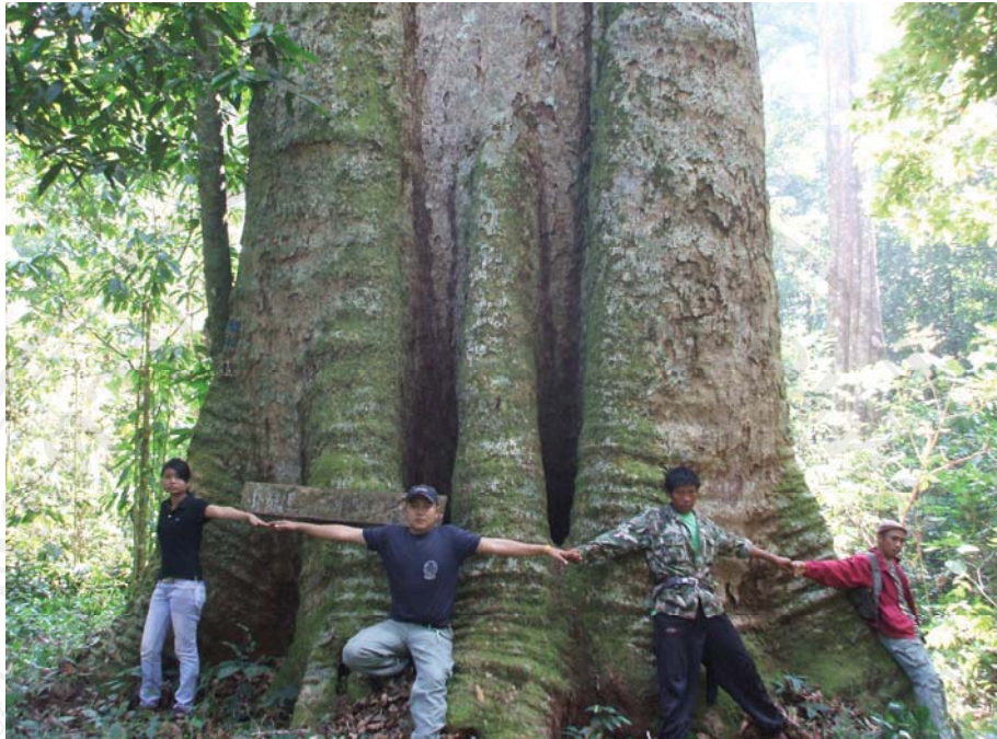
รูปที่ 4.6 ต้นไม้ยักษ์