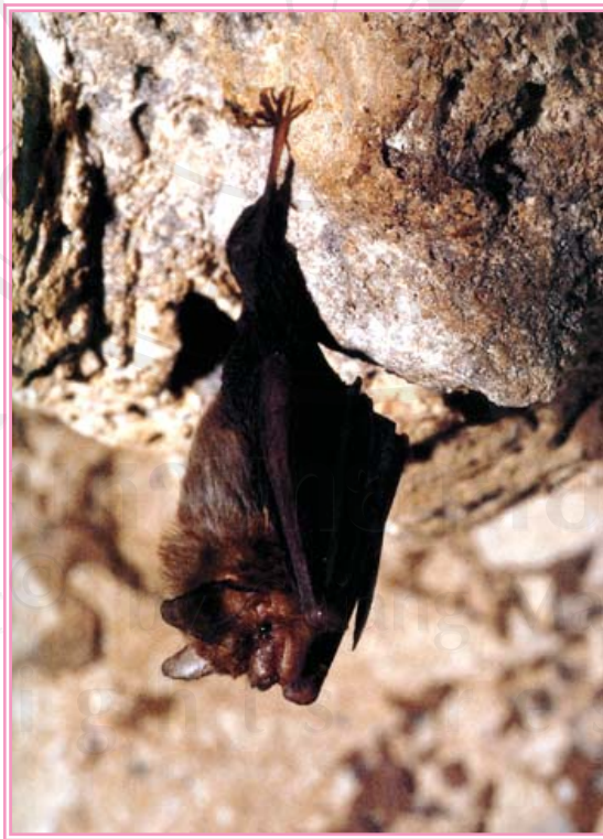
รูปที่ 4.8 ค้างคาวคุณกิตติ