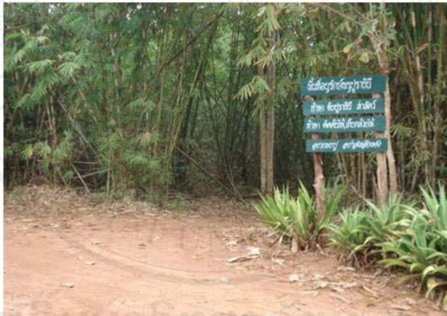
รูปที่ 4.2 พูปูราชนี