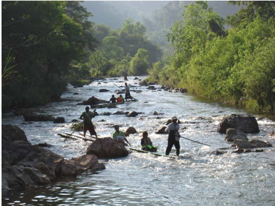
รูปที่ 4.13 กิจกรรมล่องแก่งห้วยปากคอก