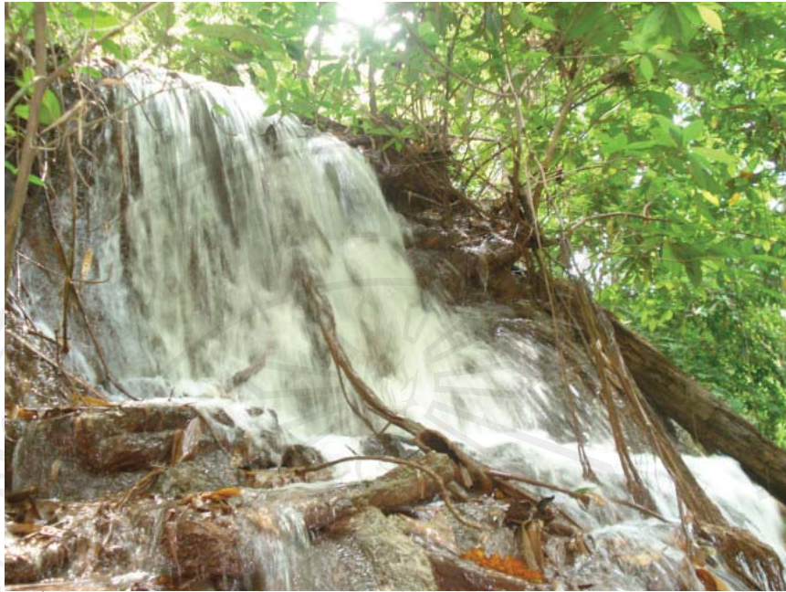
รูปที่ 4.11 น้ำตกโป่งกระดิงงา