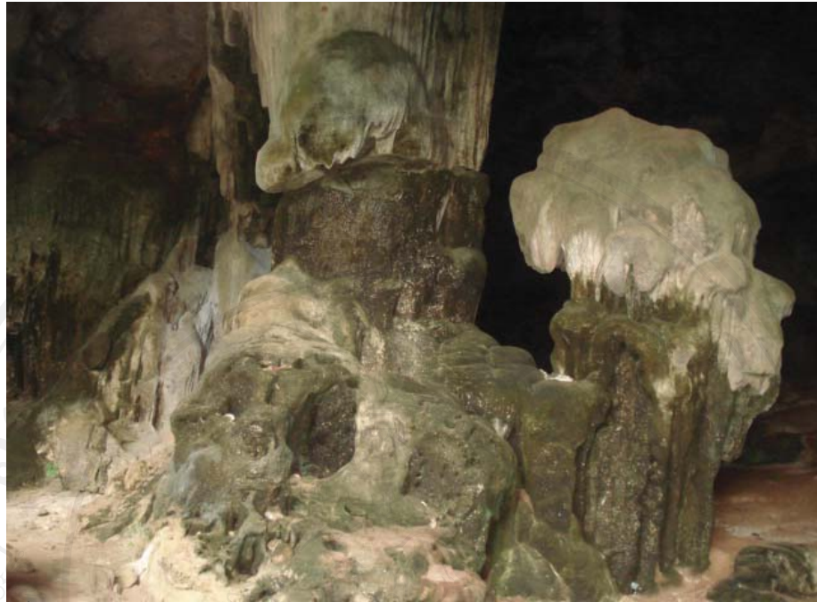
รูปที่ 4.7 ถ้ำ 28 ที่มา : จากการศึกษา