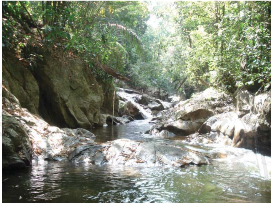
รูปที่ 4.10 น้ำตกสายรุ้ง