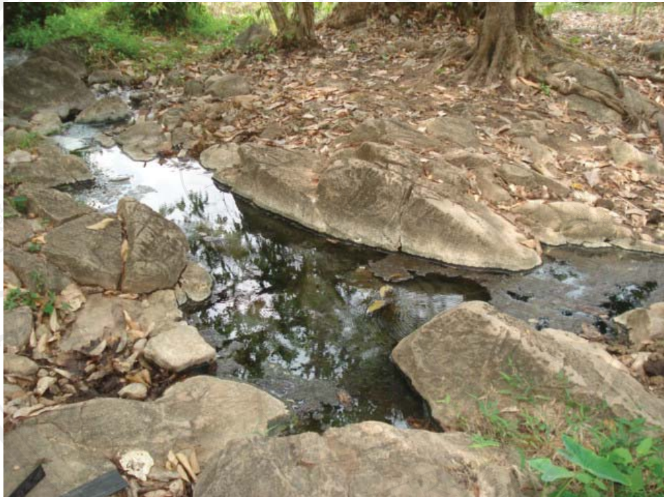
รูปที่ 4.9 โป่งพุร้อน

เป็นพุร้อนที่ผุดขึ้นบริเวณใกล้หน่วยพิทักษ์อุทยานแห่งชาติ ๑ ที่ ทก.3 (โป่งพุร้อน) มีน้ำพุร้อนอยู่ 2 จุด จุดที่ 1 อยู่ทางด้านทิศตะวันออก มีอุณหภูมิ 45 องศาจุดที่ 2 ทางด้านทิศตะวันตก มีอุณหภูมิประมาณ 65 องศา เป็นที่พักของช้างป่าที่มักจะลงมากินโป่งบริเวณนี้ โดยมีตรงกลางระหว่างพุร้อนทั้งสองจุดนี้เป็นแอ่งน้ำ เนื้อที่ประมาณ 5 ไร่ น้ำที่ผุดออกมาจะมีกลิ่นกำมะถันค่อนข้างรุนแรงจึงไม่เหมาะแก่การอาบน้ำแต่เหมาะสำหรับศึกษาเชิงนิเวศ