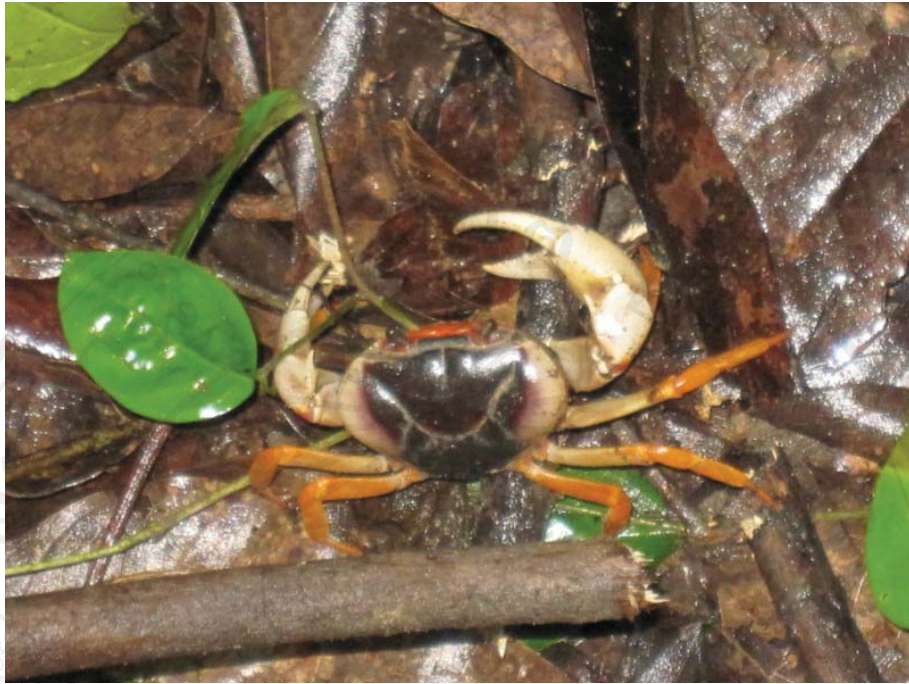
รูปที่ 4.3 ปูราชินี