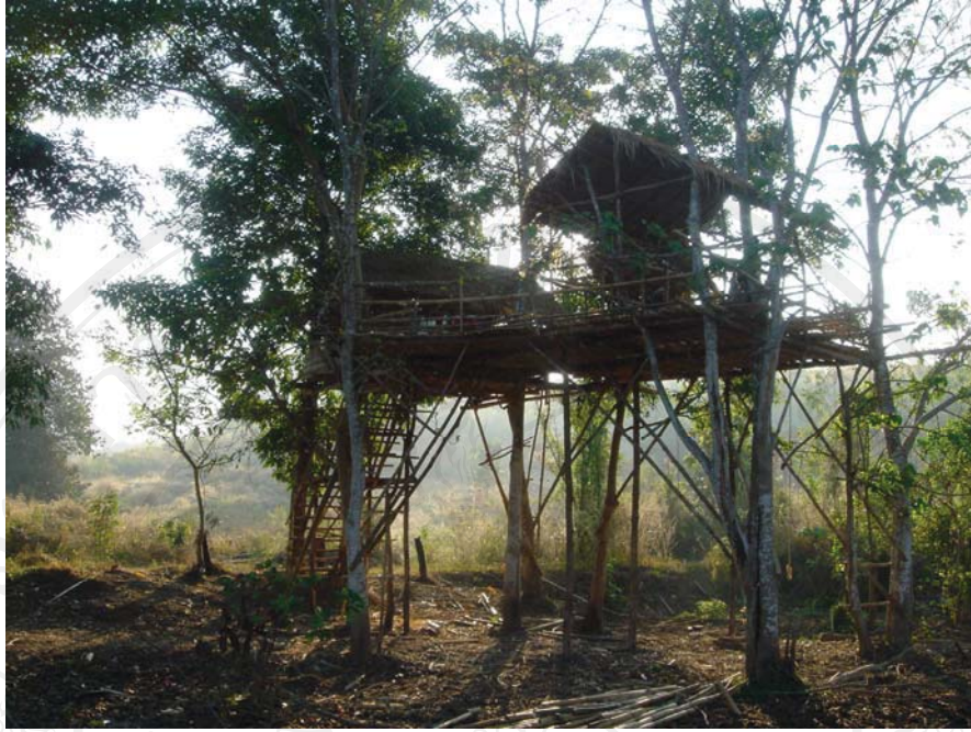
รูปที่ 4.12 กิจกรรมนั่งห้อยคูซ้าง