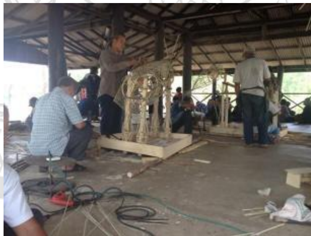
ภาพที่ 4.17 แสดงขั้นตอนการหุ้มไม้ไผ่สานเพื่อทำเป็น โครงข้าง