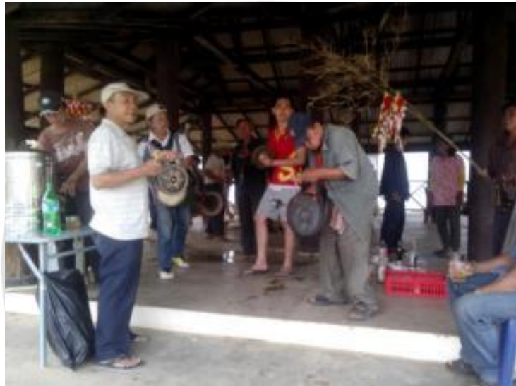
ภาพที่ 4.41 ขบวนกลองมอชิงที่จะได้ใช้หน้าหน้าขบวนช้างผ้า

(2.4) การแสดงที่ใช้หน้าขบวนแห่ช้างผ้าแต่ก่อนนั้น จะมีการแสดง นกโต ฟ้อนเล็บ ฟ้อนนก กลองมอชิง กลองปูลา ปัจจุบันได้เปลี่ยนจากการแห่จาก กลองมอชิงเป็น ใช้รถเครื่องเสียง ในการแห่ร่วมเข้ามา จึงทำให้อัตลักษณ์ ทางวัฒนธรรมได้หายไป รวมถึงภาพลักษณ์ความเป็นเอกลักษณ์ของ ประเพณีได้หายไปอีกด้วย