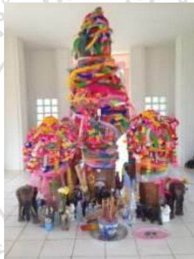
ภาพที่ 4.4 ศาลหลักเมืองแม่เมาะ

ต่อมาในปี พ.ศ. 2539 ชาวอำเภอแม่เมาะได้ร่วมกันบูรณปฏิสังขรณ์ศาลหลักเมืองแม่เมาะ ได้รับงบประมาณสนับสนุนในการจัดสร้างศาลหลักเมืองจากการไฟฟ้าฝ่ายผลิตแห่งประเทศไทย โรงไฟฟ้าแม่เมาะและเหมืองแม่เมาะและองค์การบริหารส่วนตำบลแม่เมาะ โดยทางคณะกรรมการหมู่บ้านเมาะหลวงได้เข้าร่วมมือในการจัดทำอีกครั้งหนึ่ง โดยไปหาไม้ต้นที่ใหญ่กว่ามาจากตำบลจางเหนือ นอกจากนี้ชาวบ้านเมาะหลวง บ้านม่อน บ้านหัวทุ่ง และหมู่บ้านใกล้เคียง ก็มีส่วนร่วมในการสร้างหลักเมือง ได้ทำพิธีอัญเชิญศาลหลักเมืองขึ้นเมื่อ วันที่ 20 พฤศจิกายน 2540 มีนายเฉลิมพล ประทีปนิช ผู้ว่าราชการจังหวัดลำปางเป็นประธานในพิธี 5