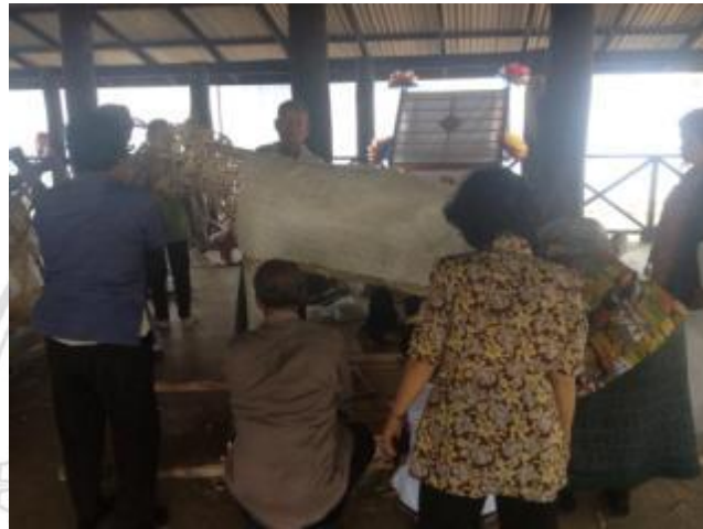
ภาพที่ 4.18 การหุ้มโครงซ้างด้วยกระดาษติดกาว