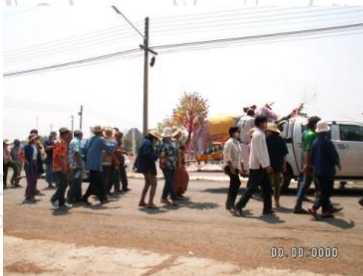
ภาพที่ 4.38 ขบวนแห่ช้างเผือกมายังวัดเมะหลวง