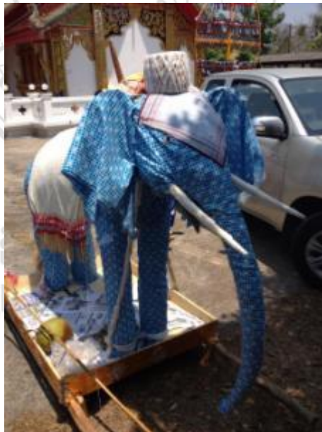
ภาพที่ 4.26 ฝ้าย (เชือกแคะ)

ฝ้าย (เชือกแคะ) ใช้สำหรับมัดไว้ตรงบริเวณขาของช้างผ้า