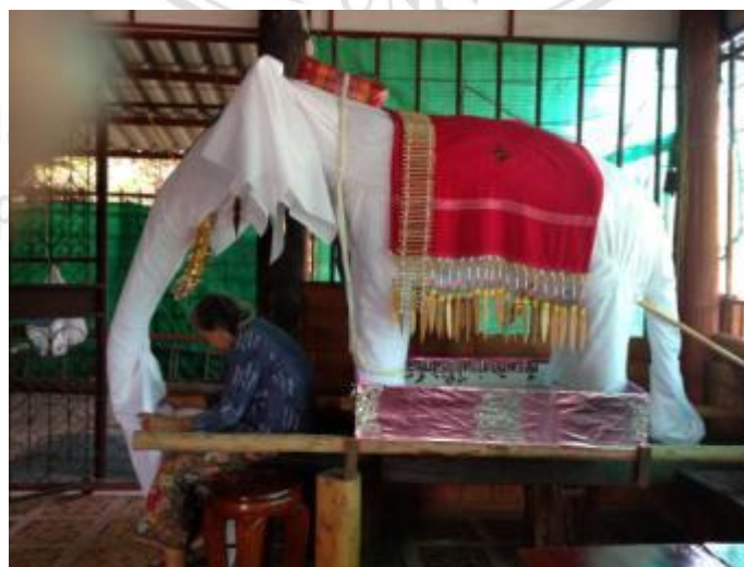
ภาพที่ 4.19 การหุ้มผ้าบริเวณส่วนวงซ้าง