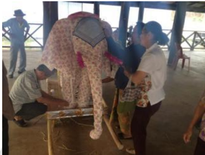
ภาพที่ 4.20 การหุ้มผ้าตกแต่งช้างผ้า