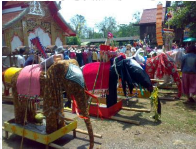
ภาพที่ 4.31 ช้างผ้าเมื่อเสร็จสมบูรณ์