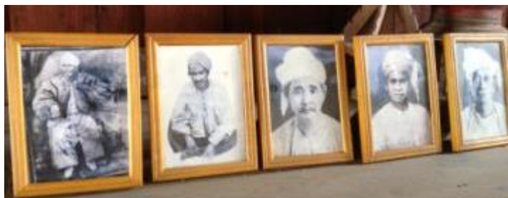
ภาพที่ 4.3 ภาพบุคคลสำคัญในอดีตของชุมชนแม่หลวง