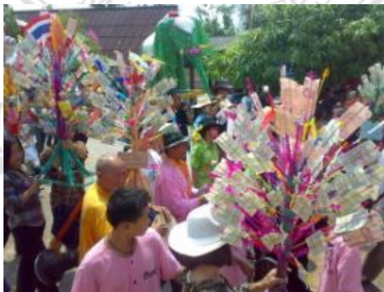
ภาพที่ 4.22 ชั้นข้าวตอกดอกไม้ต้นกัณฑ์คา

ชั้นข้าวตอกดอกไม้ต้นกัณฑ์คา โดยนำใบคามามัดเป็นรูปสามเหลี่ยม แล้วต่อเป็นสามขาแล้วรวบให้เป็นเส้นเดียวไว้กลางสำหรับเสียบปักจ้ยต่าง ๆ ตกแต่งด้วยกระดาษสีต่างๆ ให้สวยงาม