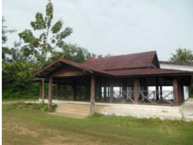
ภาพที่ 4.6 ศาลากลางบ้านปัจจุบัน