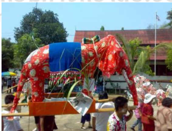
ภาพที่ 4.15 ช้างผ้า