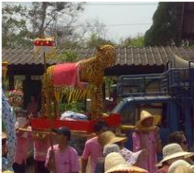
ภาพที่ 4.29 รูปแบบสัตว์ตามราศีเกิด

นอกจากจะถวายช้างผ้าแล้ว ยังได้มีการทำเป็นสัตว์ตามปีนักษัตรราศีเกิดของคนที่ตั้งใจจะถวายอีกด้วย หรืออาจจะทำตามนักษัตรที่ประจำปีที่มีกันแก้กันก็ได้