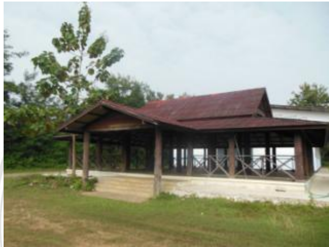
ภาพที่ 4.32 ศาลากลางบ้าน

ปัจจุบันนี้ แทบจะไม่ได้ใช้อะไรมากนักนอกจากจะเป็นสถานที่รวมตัวกันของช่างฝีมือที่จะเป็นศูนย์กลางของการทำช่างฝ้าชุมชน เมื่อเสร็จงานก็จะนำช่างฝ้าที่ได้ไปตั้งขบวนแห่ไป ตามสถานที่ต่างๆ ศาลากลางบ้านนี้ก่อนวันงานจะมีกลุ่มชาวบ้านที่ได้รับคำสั่งจาก ผู้ใหญ่บ้านมาทำความสะอาดและถางหญ้า เพื่อจะเข้าไปใช้สอย