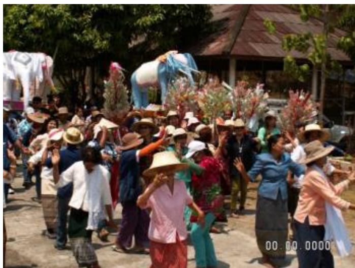
ภาพที่ 4.39 ขบวนแห่ช้างผ้ามายังวัดมะหลาง