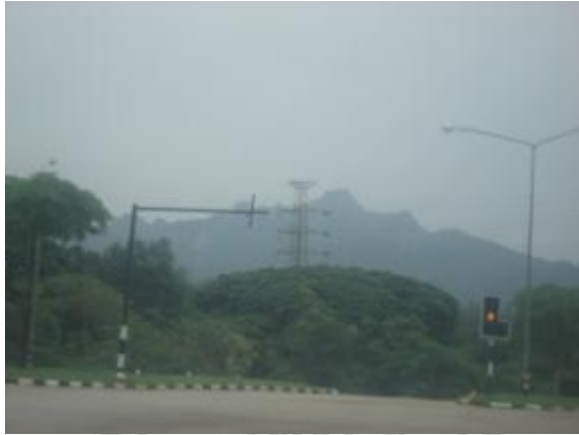
ภาพที่ 4.11 คอยผาซ้าง