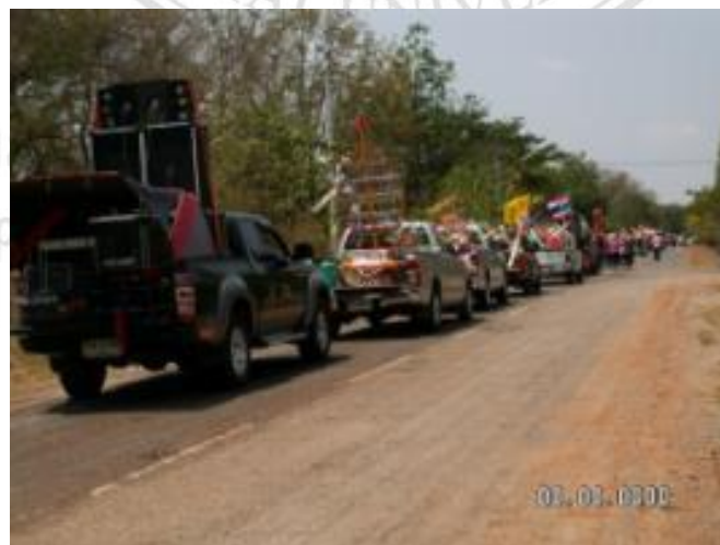
ภาพที่ 4.40 การขนช้างผ้ามาไว้ที่ศาลากลางบ้านโดยใส่หลังรถกระบะ สมัยก่อนจะใช้วิธีแห่กันมา