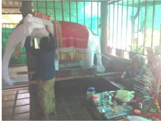
ภาพที่ 4.14 ชาวบ้านชุมชนเมะหลวงช่วยกันทำช้างผ้า