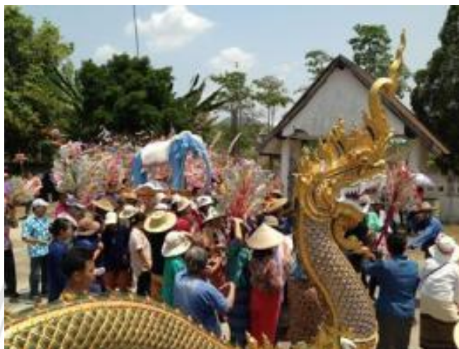
ภาพที่ 4.37 ขบวนแห่ช้างเผือกมายังวัดเมะหลวง

ปัจจุบันนี้การแห่ช้างเผือกเพื่อไปถวายยังวัด ช้างเผือกส่วนใหญ่จะไม่ถูกแกะนำไปใช้ สอยจะถูกต้องเก็บไว้บนศาลาวัด และบางครั้งผู้ที่นำมาถวายก็จะนำกลับบ้านไป เพื่อที่จะนำมาถวายในปีต่อไป 18