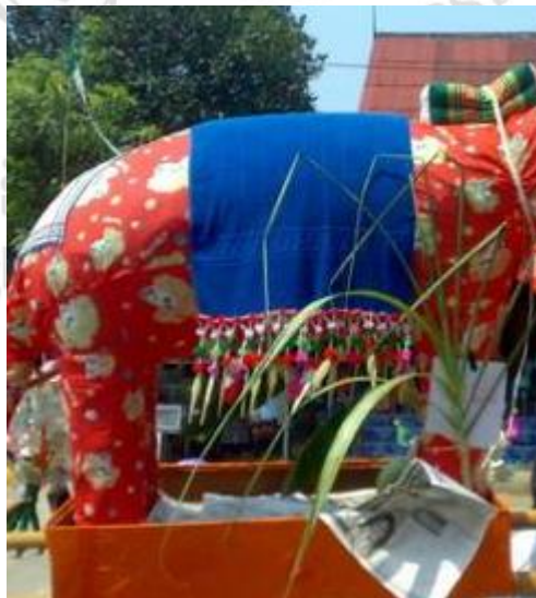
ภาพที่ 4.24 ผ้าคลุมหลังช้าง

ผ้าคลุมหลังช้าง เป็นผ้าฝืนสีเหลี่ยมผืนผ้า ตรงปลายประดับด้วยโบไฮหรือช่อ นิยมใช้ผ้าขนหนูก็ได้เนื่องจากพอถวายแล้วพระสงฆ์สามารถนำไปใช้ได้