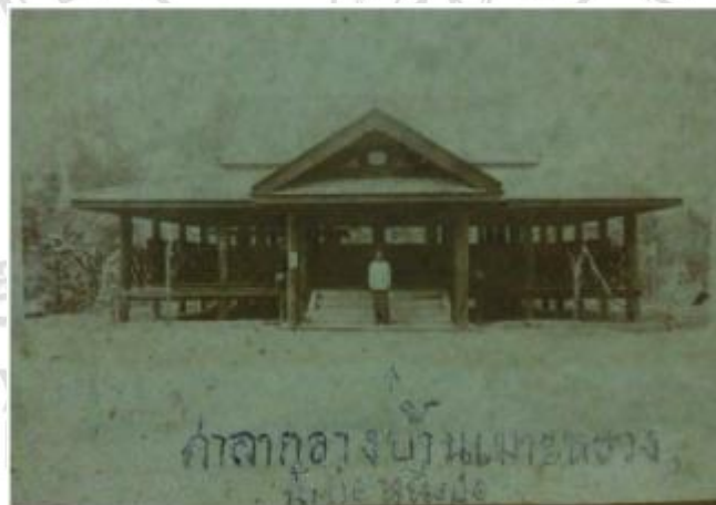
ภาพที่ 4.5 ศาลากลางบ้านในอดีต

ปัจจุบันศาลากลางหลังเดิมนี้นี้ ถูกย้ายมาสร้างขึ้นใหม่ในด้านข้างของศาลหลักเมือง โดยใช้ไม้สัก มุงกระเบื้องสมัยใหม่ และเปลี่ยนรูปทรงไปจากศาลากลางบ้านหลังเดิม โดยภาพเขียนจิตรกรรมประดับศาลากลางบ้านหลังเดิม ถูกถอดไปเก็บไว้ที่วัดเกาะหลวง แต่น่าเสียดายที่ต่อมาเจ้าอาวาสวัดเกาะหลวงได้ลบแล้วเขียนใหม่ ปัจจุบันศาลากลางบ้านหลังใหม่ไม่ค่อยได้ใช้ประโยชน์อะไรมากนัก จะใช้เพียงงานประเพณีแห่ช้างผ้าเท่านั้น เพื่อเป็นที่ชุมนุมของชาวบ้านช้างผ้าที่ศาลาแห่งนี้ แล้วแห่ไปยังวัดเกาะหลวง ซึ่งอยู่ไม่ไกลกันนัก 6