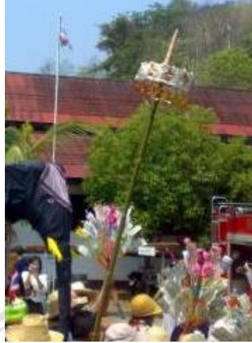
ภาพที่ 4.21 ฉัตร

ข้อ นำไม้ไผ่ที่มีกิ่งใบมาจัดทำตกแต่งด้วยผ้าแดงตัดเป็นรูปสามเหลี่ยม คล้ายใบไผ่หรือซ้อนมัดตกแต่งส่วนล่าง