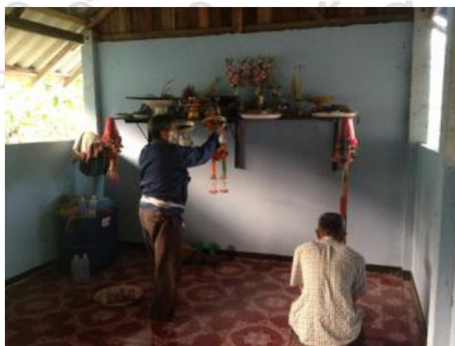
ภาพที่ 4.34 ชาวบ้านชุมชนเกาะหลวงทำพิธีบอกกล่าวผีบรรพบุรุษ

ปัจจุบันนั้น ประเพณีแห่ช้างผ้าได้มีเพียงนำไปถวายบอกกล่าวแก่ศาลหลักเมือง และผีบ้าน ผีเรือน บางจุดเท่านั้น พอเสร็จสิ้นก็แยกย้ายกันกลับ โดยนำช้างไปเก็บไว้ที่บ้านผู้นำชุมชนและบ้านของผู้ที่มีจิตศรัทธาทำถวาย