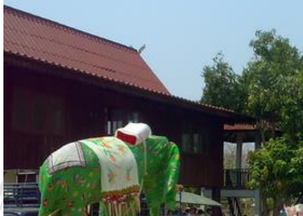
ภาพที่ 4.23 หมอน

พิธีกรรมนี้ เพราะจะใช้หมอน เกณฑ์ถวายแต่ศาลหลักเมือง ฝึบ้าน ในแต่ละบ้าน ก่อนที่จะนำช้างไปถวายที่วัด โดยไม่ว่า จะเป็นสัตว์ชนิดใดก็ตามก็ต้องมีหมอนมัดไว้บริเวณคอทุกตัว