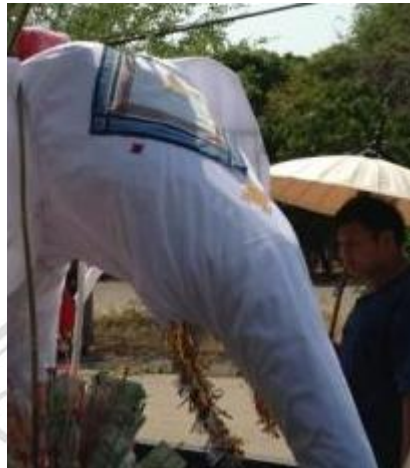
ภาพที่ 4.25 ผ้าเช็ดหน้าประดับช้างผ้า

ผ้าเช็ดหน้า จะถูกประดับไว้บริเวณก้นและหน้าผากของช้างเพื่อที่จะนำไปถวายแก่พระสงฆ์เช่นกัน