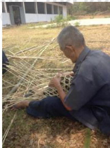
ภาพที่ 4.16 แสดงขั้นตอนการสานไม้ไผ่เพื่อทำโครงช้างผ้า