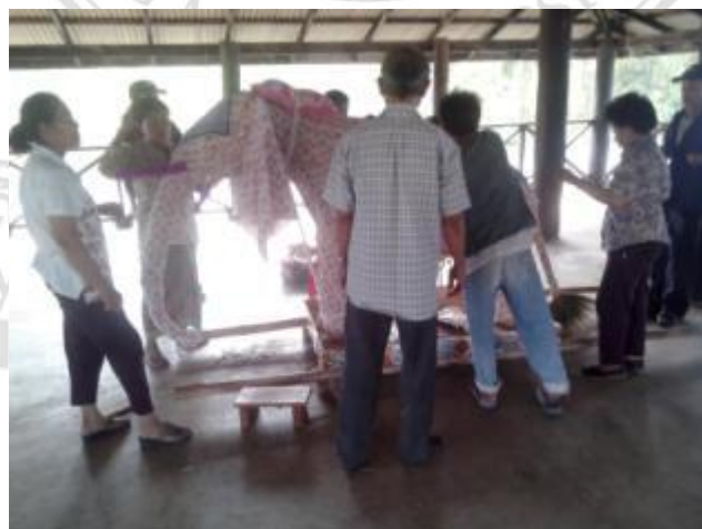
ภาพที่ 4.28 ผ้าหุ้มซ้าง

ผ้าหุ้มซ้าง จะเป็นผ้าสีสุภาพตามความสะดวก สมัยก่อนมักจะเป็นผ้าฝ้าย ที่ทอขึ้นมาเองแล้วนำมาข้อมเป็นสีเหลือง สำหรับใช้ถวายแล้วพระสงฆ์ จะนำมาตัดเป็นจีวร หรือใช้ตามกิจของสงฆ์ต่อไป ซึ่งปัจจุบันได้ใช้ผ้า ตามความสะดวกเนื่องจากไม่นิยมที่จะนำผ้ามาใช้ และไม่นิยมซื้อผ้า จีวรมาหุ้มเพราะผ้ามีสั้น การหุ้มซ้างผ้านั้นต้องใช้ผ้าถึง 10 เมตร ในการ หุ้มทั้งหมด