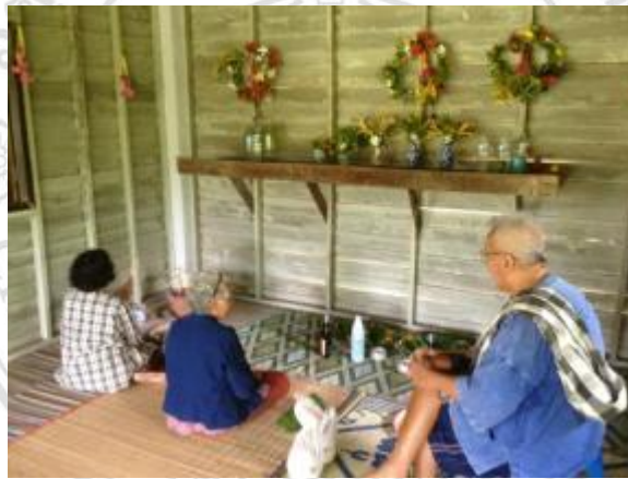
ภาพ 4.10 การเลี้ยงผี ที่แม่เมาะ

ปัจจุบันคนในชุมชนแม่หลวงได้เปลี่ยนแปลงการดำรงชีวิตไปมากการประกอบพิธีกรรมเลี้ยงผีดังกล่าวนี้เริ่มมีเพียงแค่กลุ่มคนผู้สูงอายุในหมู่บ้านที่จะได้ร่วมมือกันสืบสานการเลี้ยงผี ซึ่งคนในวัยทำงานนั้น ได้ออกไปทำงานยังต่างถิ่น ทำให้การร่วมมือในการเข้าร่วมกิจกรรมน้อยลงเต็มที่ มีเพียงคนกลุ่มเล็ก ๆ ไม่กี่คน เท่านั้น