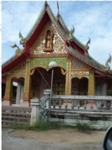
ภาพที่ 4.8 วัดเกาะหลวง

ต่อมาเมื่อมีการย้ายหมู่บ้านจากการก่อสร้างโรงไฟฟ้าลิกไนต์ ซึ่งให้เวนคืนพื้นที่บริเวณ ที่ตั้งบ้านเกาะหลวง และหมู่บ้านใกล้เคียงทั้งหมด ผู้ดำเนินการและทางอำเภอโดย ศึกษาธิการอำเภอแม่เกาะรับผิดชอบดูแลการขนย้ายสิ่งของต่างๆและย้ายวัดมาตั้งอยู่ใน ที่แห่งใหม่ ซึ่งปัจจุบันวัดเกาะหลวงตั้งอยู่บริเวณถนนแม่เกาะเหนือ ตำบลแม่เกาะ อำเภอแม่เกาะ จังหวัดลำปาง 8