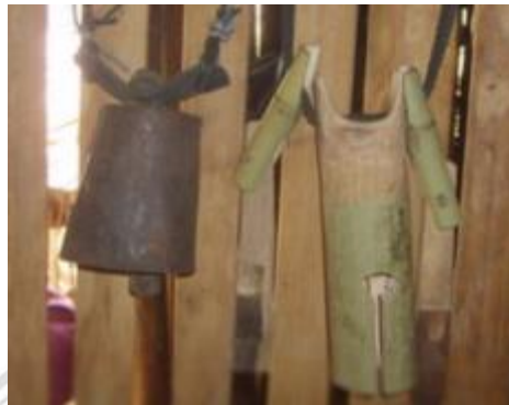
ภาพที่ 4.27 หอก

หอก ใช้สำหรับมัดบริเวณคอของซ้างผ้า หากเป็นการถวายเป็นสัตว์ชนิดอื่นก็ จะใช้กระดิ่ง ตามความสะดวก