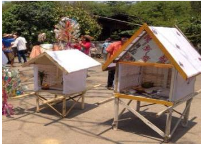
ภาพที่ 4.30 หอผ้าขาว