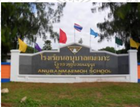
ภาพที่ 4.9 โรงเรียนอนุบาลแม่เมาะ

โรงเรียนอนุบาลแม่เมาะ (ชุมชน 1) เดิมชื่อ โรงเรียนบ้านเมาะ (เมาะหลวงศึกษา) ตั้งขึ้นเมื่อ พ.ศ. 2476 อาศัยศาลาวัดเมาะหลวงเป็นที่เรียน ต่อมาปี พ.ศ. 2479 ชุนศรีหิงส์สวัสดิ์ นายอำเภอเมืองลำปาง ได้ซื้อที่ดินกลางหมู่บ้านสถานที่เรียนและได้ขยาย โดยผู้ปกครองนักเรียนและคณะกรรมการสถานศึกษา โดยได้บริจาคที่ดิน จำนวน 19 ไร่ 3 งาน สร้างอาคารเรียน ในปี 2500 และได้รับงบประมาณขยายอาคารเรียน และอาคารประกอบตลอดมา 9