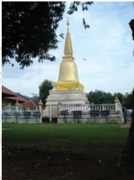
ภาพที่ 4.7 วัดทุ่งกล้วยโพธาราม

และปราสาททำด้วยไม้ลึงรักปิดทองประดับกระจก และจากคำบอกเล่าของชาวบ้าน วัดทุ่งกล้วยแห่งนี้กล่าวว่า เป็นวัดที่มีความสำคัญต่อหมู่บ้านเมะหลวงมาแต่อดีตก่อน การสร้างวัดเมะหลวง ซึ่งศิลปวัตถุและโบราณวัตถุภายในวัดแสดงให้เห็นลักษณะ วัฒนธรรมของชาวเมะหลวงที่เริ่มจากกลุ่มชาวไทยใหญ่ อายุสมัยของการสร้างวัดทุ่ง กล้วย น่าจะอยู่ในราวต้นพุทธศตวรรษที่ 25 7