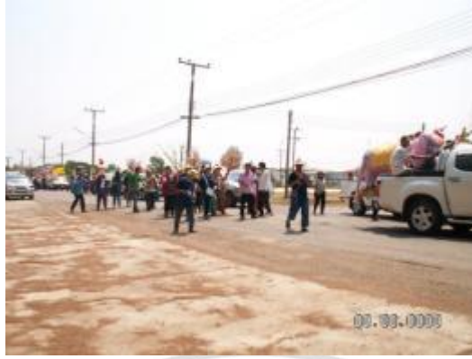
ภาพที่ 4.13 ขบวนแห่ช้างผ้าห่มชนเผ่าหลวงในปัจจุบัน