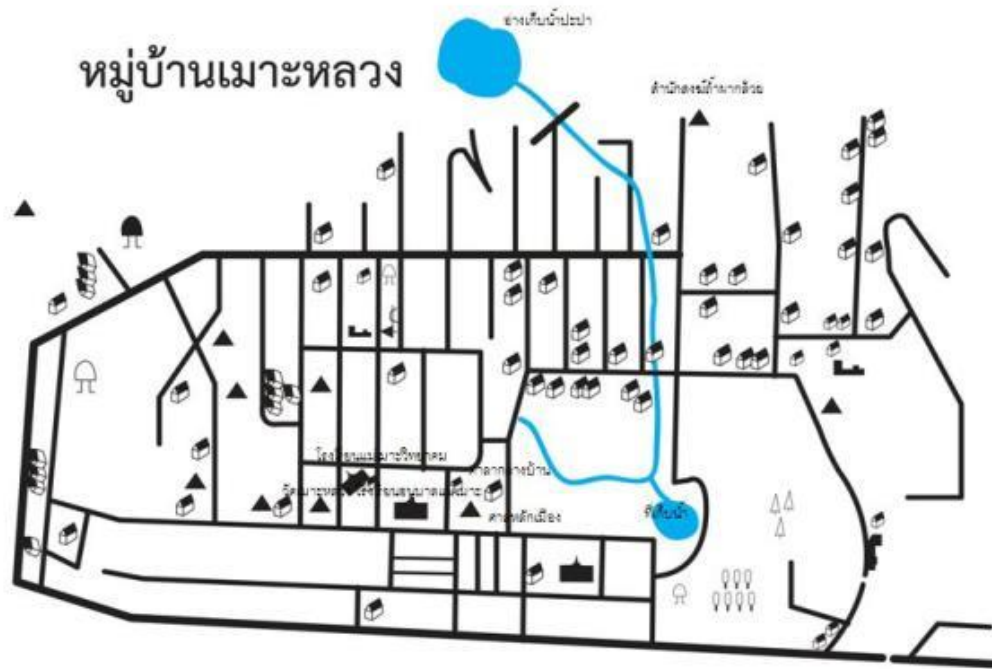
ภาพที่ 4.1 แผนที่หมู่บ้านแมะหลวง ที่มา : โครงการศึกษาเรียนรู้ชุมชนการจัดทำแผนที่ทางสังคม 2554