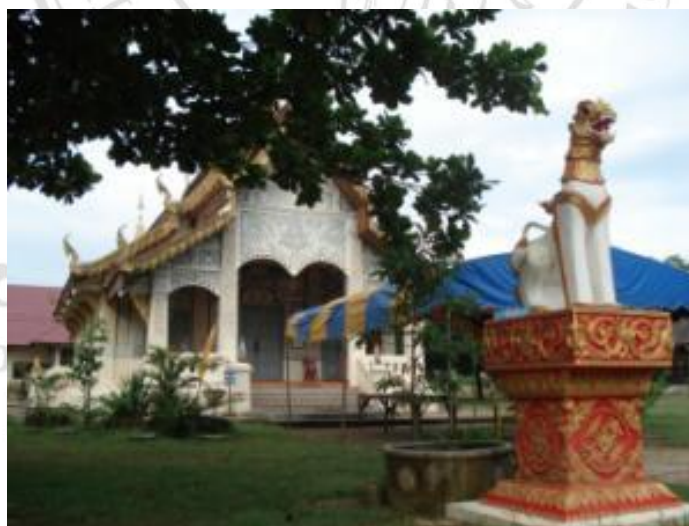
ภาพที่ 4.35 วัดทุ่งกล้วยโพธาราม ชุมชนเกาะหลวง

ปัจจุบันการแห่ช่างฝ้าเมื่อเสร็จสิ้นพิธีจากวัดทุ่งกล้วยโพธารามเสร็จก็จะได้นำช่างฝ้าทั้งหมดกลับมาไว้ที่บ้านผู้นำชุมชนและบ้านของผู้ที่มีจิตศรัทธาทำถวาย