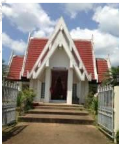
ภาพที่ 4.33 ศาลหลักเมือง

ศาลหลักเมืองก่อนวันงานในวันที่ 15 ก็จะมีชาวบ้านอาสาสมัครเข้าร่วมทำความสะอาด โดยมีผู้ใหญ่บ้านเป็นผู้ดูแล