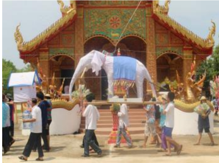
ภาพที่ 4.36 ขบวนช้างผ้าและห่อผ้าขาวถวายแก้วตุงกล้วย

วันที่ 16 เมษายน 8.00 น. ชาวบ้านจะร่วมกันตั้งขบวน ช้างผ้าทั้งหมด บริเวณศาลากลางบ้าน แล้วแห่ไปที่วัดเมะหลวงโดยจะมีขบวนพ็อนรำ พ็อนโต กลองมอชิง นำหน้าในการแห่อย่างสนุกสนาน