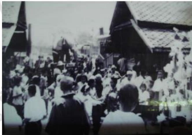
ภาพที่ 4.12 การแห่ช้างฟ้าชุมชนเมาะหลวงในอดีต