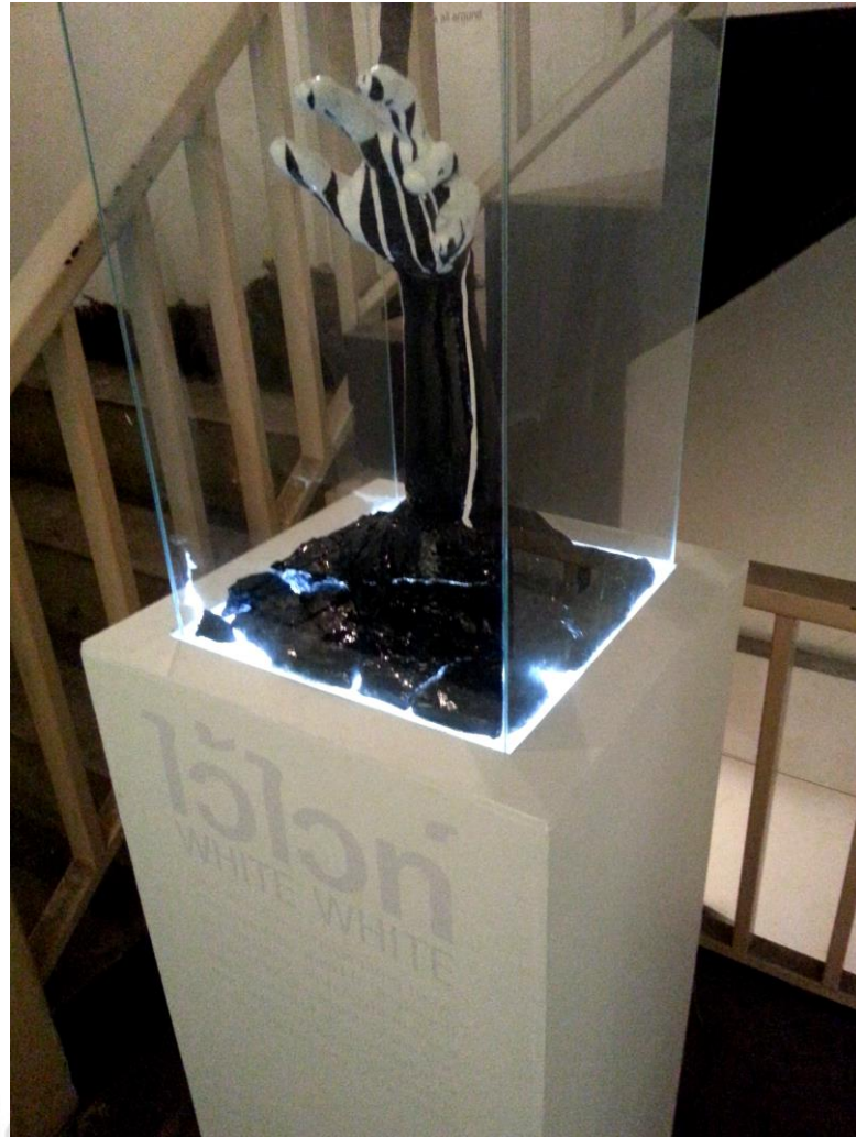
ผลงานของผู้ศึกษา “ไว้วทท์” (There are so many reason to be.. white white)

ผู้ศึกษาได้นำแนวคิดบางส่วนจากการศึกษาในความต้องการมีผิวขาวของคนในสังคมมาสร้างเป็นสื่อในการสื่อสารเพื่อสะท้อนให้เห็นถึงมุมมองหนึ่งที่เป็นวิถีปฏิบัติของคนในสังคม และรับการบริโภคความต้องการเหล่านั้นอย่างไม่อาจหลีกเลี่ยงได้