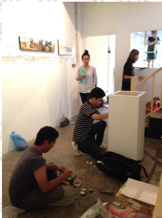
ผู้ศึกษากำลังประกอบคำอธิบายและตกแต่งแทนจิตว่าง

จากผลงาน กล่าวถึง การนิยามความเป็นร่างกายของคนที่สังคมที่เปรียบร่างกายดั่งกับวัตถุชนิดหนึ่งที่รอการรังสรรค์ ประดิษฐ์ เพื่อเป็นวัตถุแห่งการถูชมองที่สมบูรณ์แบบที่สุด วาทกรรมแห่งศิวขานับเป็นสับเซตหนึ่งของความงดงามทางกายภาพที่หม่อมวลถวิลหาเพื่อให้ได้มาซึ่งการครอบครองด้วยการยอมรับทางสังคมทำให้วาทกรรมดังกล่าวเปรียบดั่งใบเบิกทางสู่ความต้องการที่ซ่อนแฝงด้วยอำนาจจากการประดิษฐ์วัตถุอย่างวิจิตรบรรจง กล่าวได้ว่าการครอบครองในวาทกรรมเป็นความปรารถนาอันยิ่งยวดโดยไร้ซึ่งกรอบแห่งปีศาจปไตชิปไตยที่ใครๆต่างต้องการไขว้คว้าและปรารถนาให้หลุดพ้นจากเส้นกรอบเดิมแห่งความเป็นตัวตน