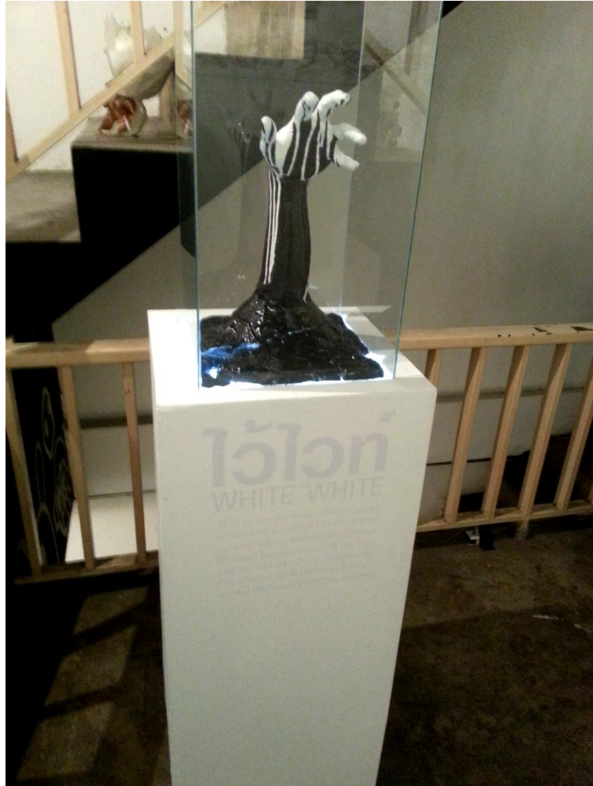
ผลงานถูกติดตั้งอย่างสมบูรณ์

ลิขสิทธิ์มหาวิทยาลัยเชียงใหม่ Copyright© by Chiang Mai University All rights reserved