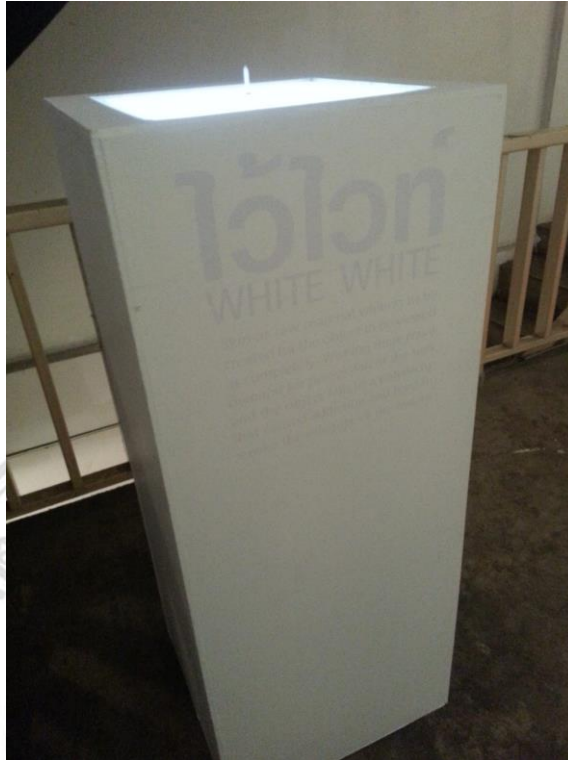
ติดตั้งตามตำแหน่งและทดสอบระบบไฟ