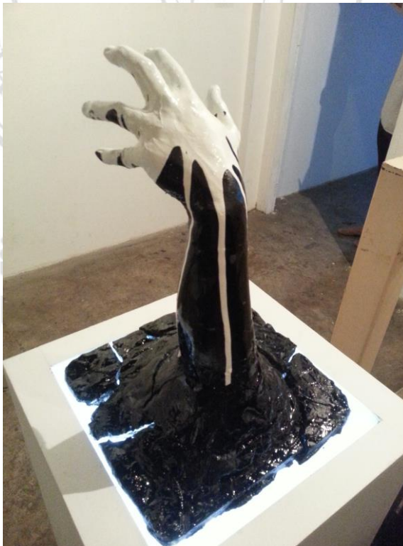
ประกอบตัวชิ้นงานและจัดวางตามตำแหน่ง