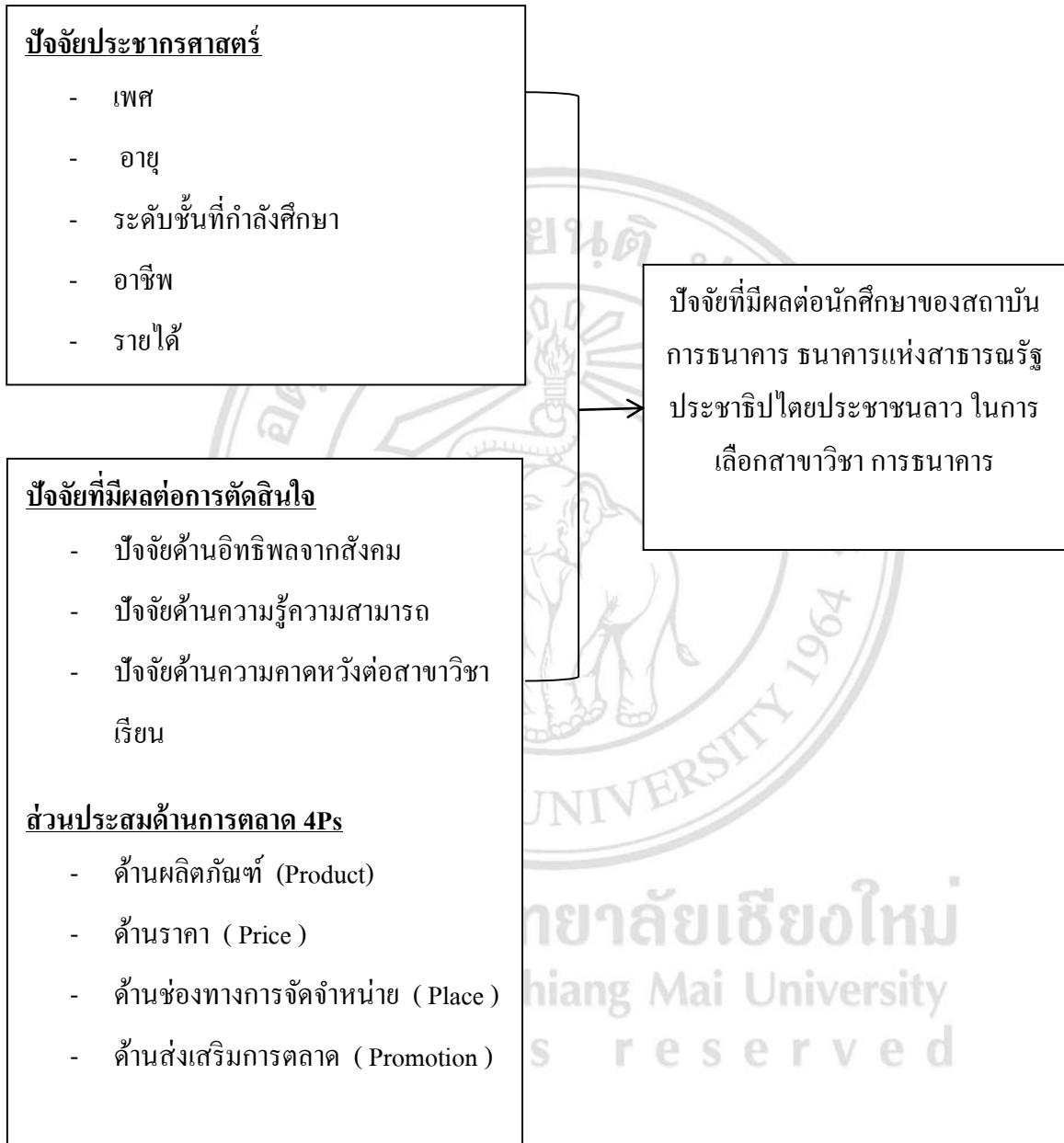
แผนภาพที่ 1 แสดงกรอบแนวคิดในการวิจัย