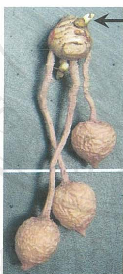
ตาข้างที่มีการเจริญ