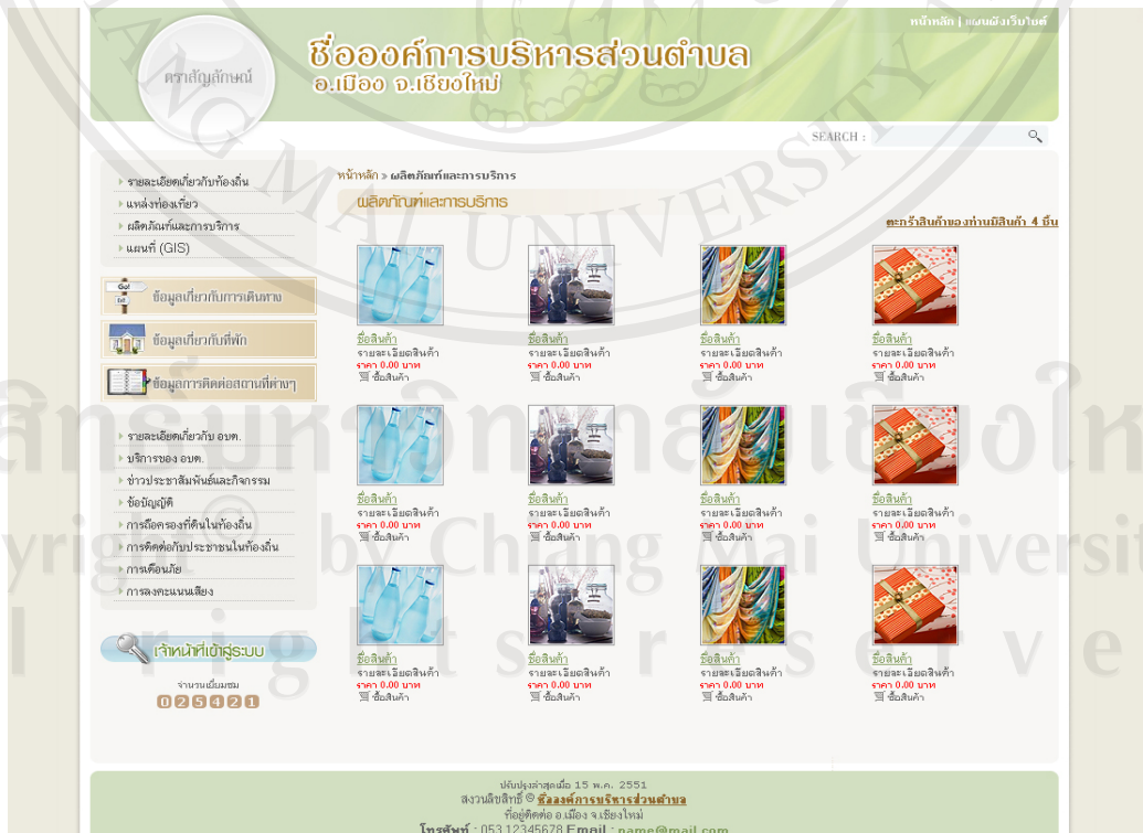
รูป ข.4 แสดงเว็บเพจผลิตภัณฑ์และการบริการ