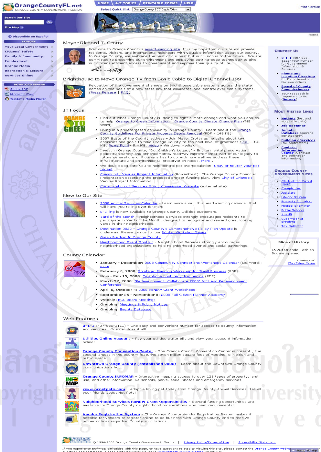
รูป จ.4 แสดงเว็บเพจองค์กรปกครองส่วนท้องถิ่น Orange County, Florida

http://www.orangecountyfl.net - Orange County, Florida