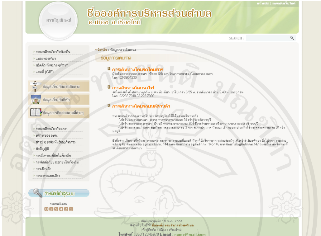
รูป ข.6 แสดงเว็บเพจข้อมูลการเดินทาง