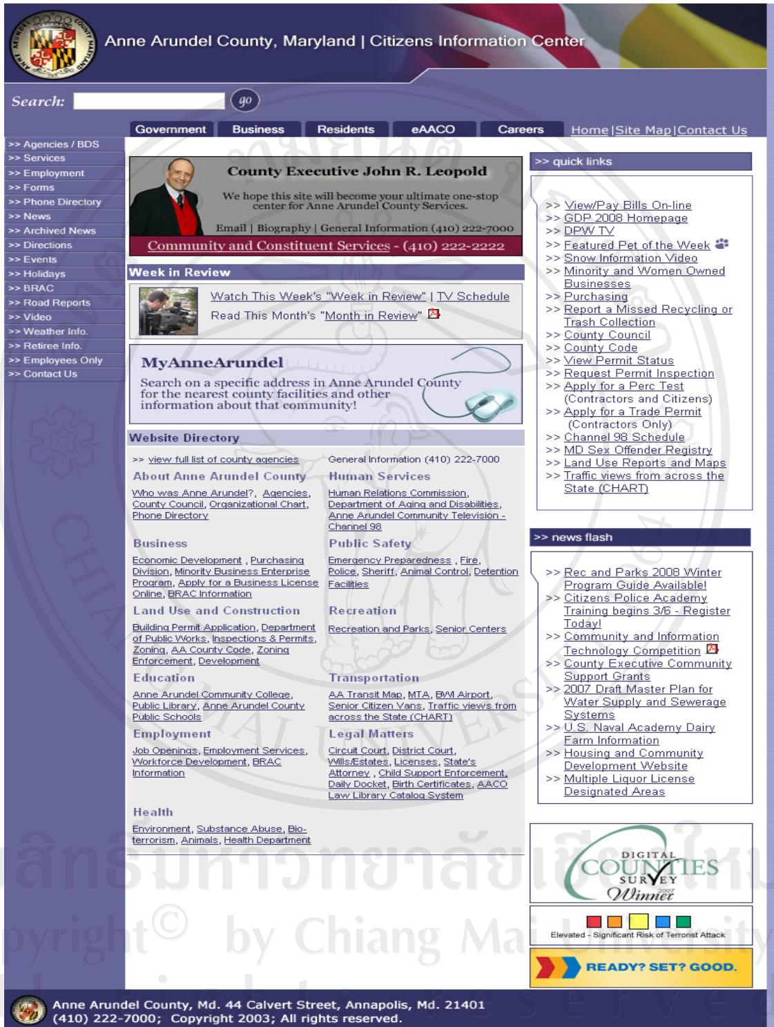
รูป น.6 แสดงเว็บเพจองค์กรปกครองส่วนท้องถิ่น Anne Arundel County, Maryland

http://www.aacounty.org - Anne Arundel County, Maryland