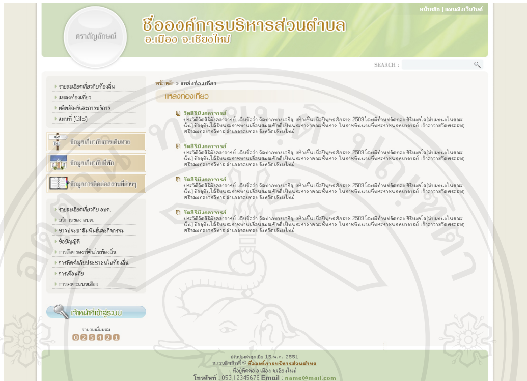
รูป ข.3 แสดงเว็บเพจแหล่งท่องเที่ยว