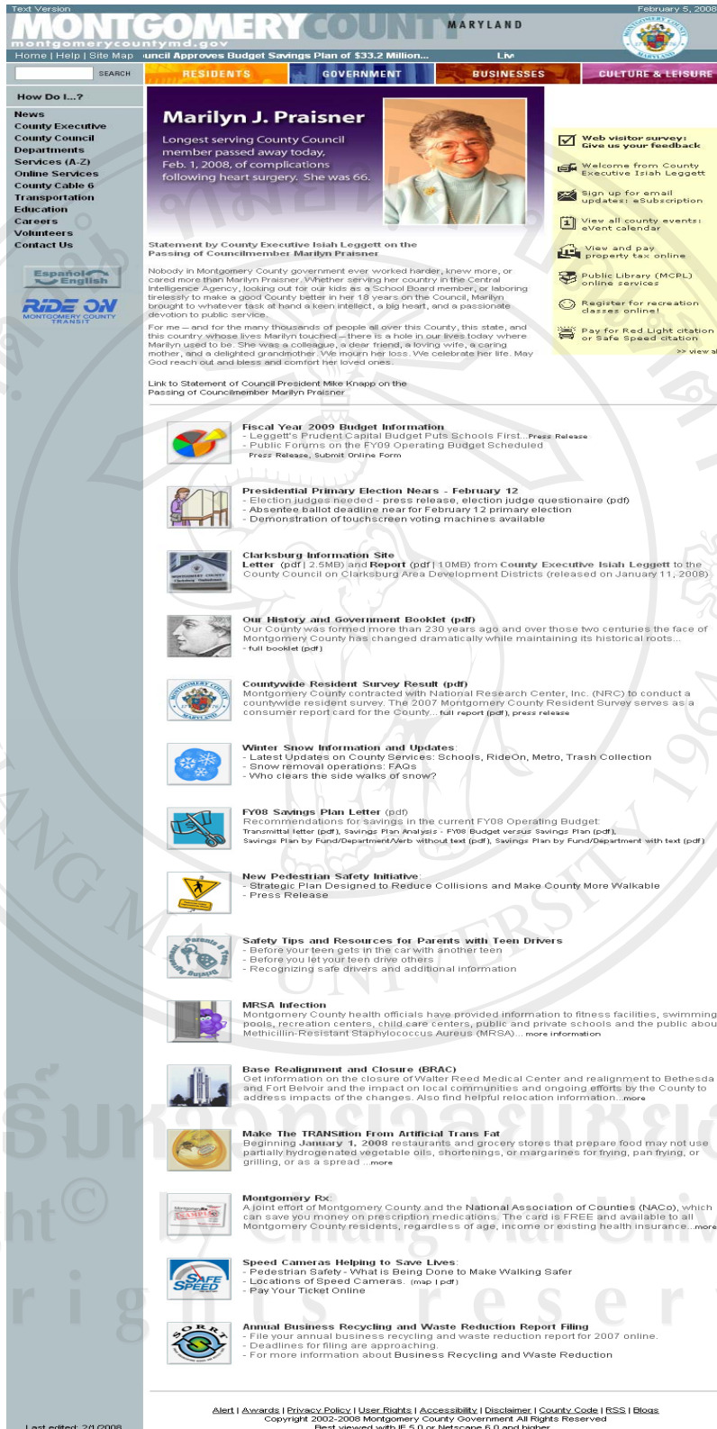
รูป ฉ.5 แสดงเว็บเพจองค์กรปกครองส่วนท้องถิ่น Montgomery County, Maryland

http://www.montgomerycountymd.gov - Montgomery County, Maryland