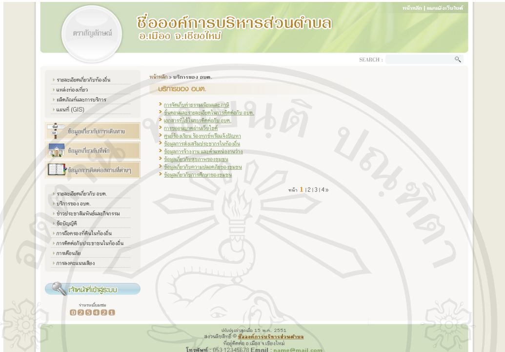
รูป ข.8 แสดงเว็บเพจบริการของ อบต.