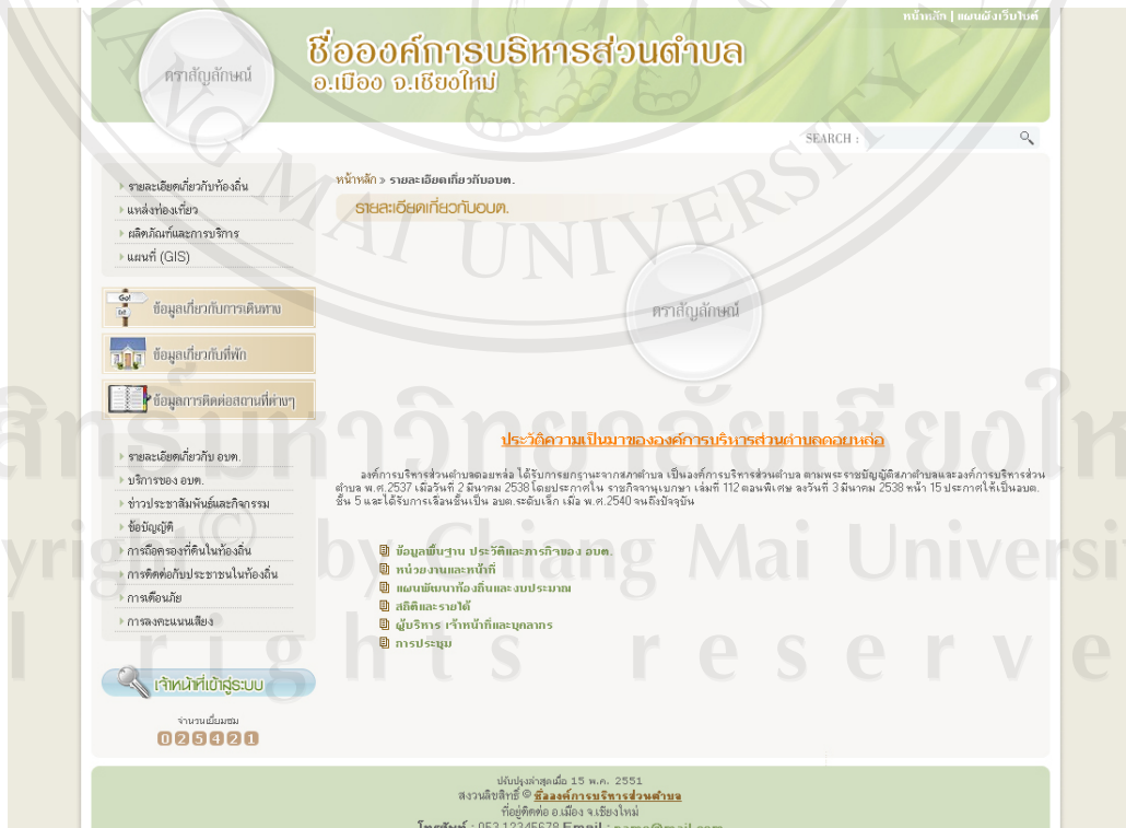
รูป ข.7 แสดงเว็บเพจรายละเอียดเกี่ยวกับ อบต.