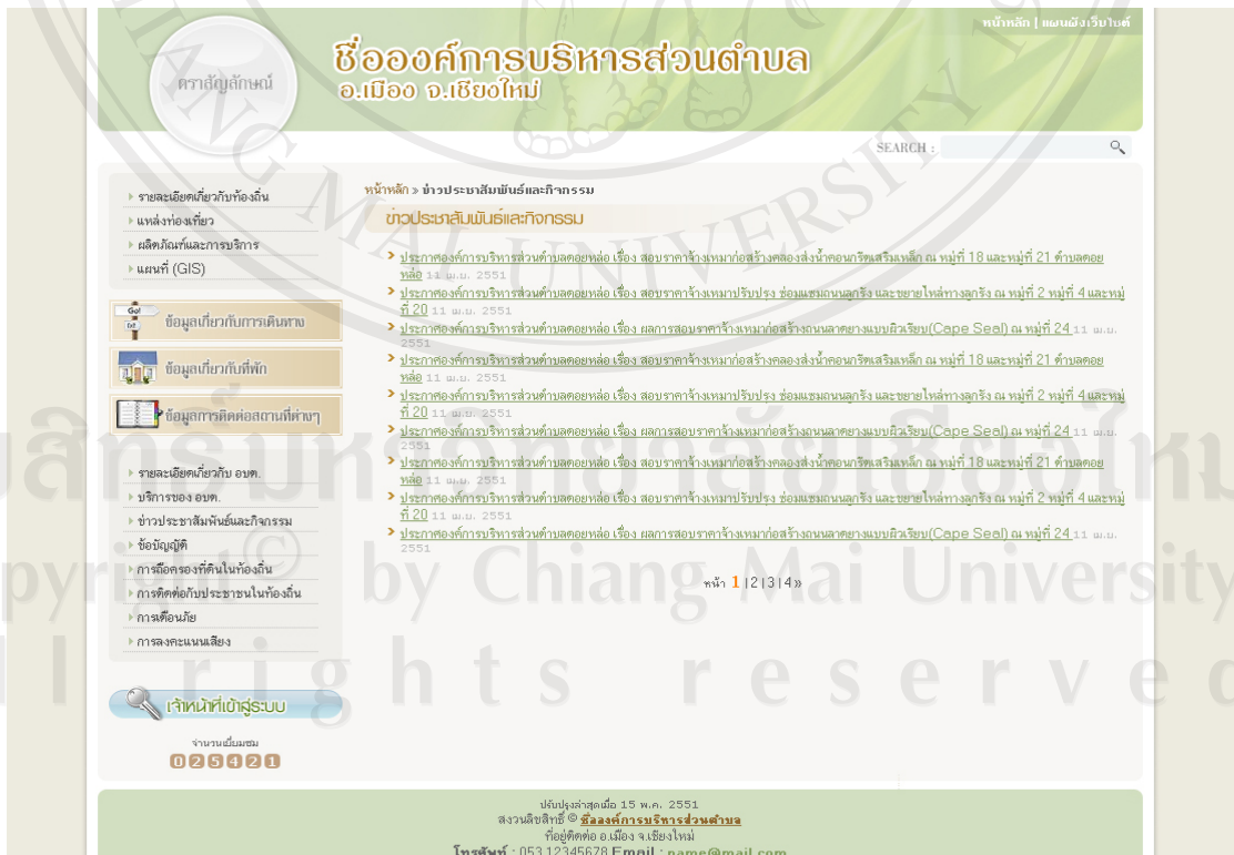
รูป ข.9 แสดงเว็บเพจข่าวประชาสัมพันธ์และกิจกรรม