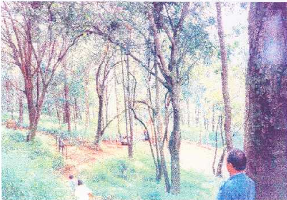
ภาพที่ 13 กิจกรรมเดินป่า ศึกษาธรรมชาติ (1)