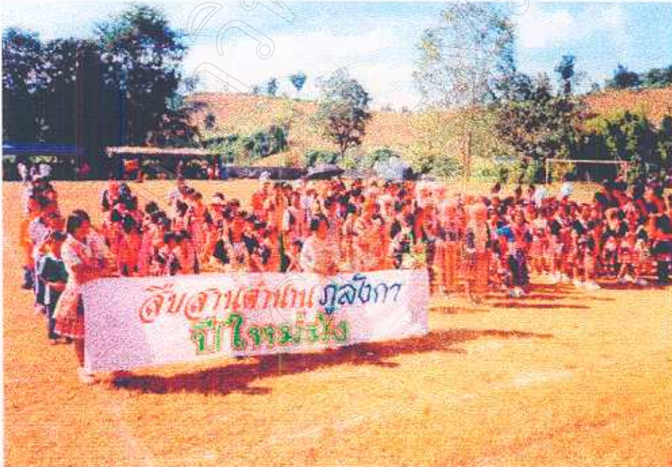
ภาพที่ 9 ทรัพยากรท่องเที่ยวทางด้านวัฒนธรรมชนเผ่า