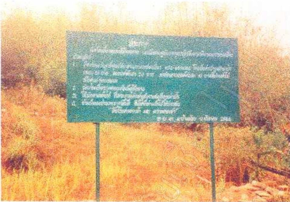
ภาพที่ 10 ป้ายประกาศระเบียบปฏิบัติในการท่องเที่ยวของตำบลผาช้างน้อย