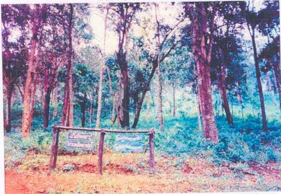
ภาพที่ 23 ป้ายสื่อความหมายธรรมชาติภายในแหล่งท่องเที่ยว