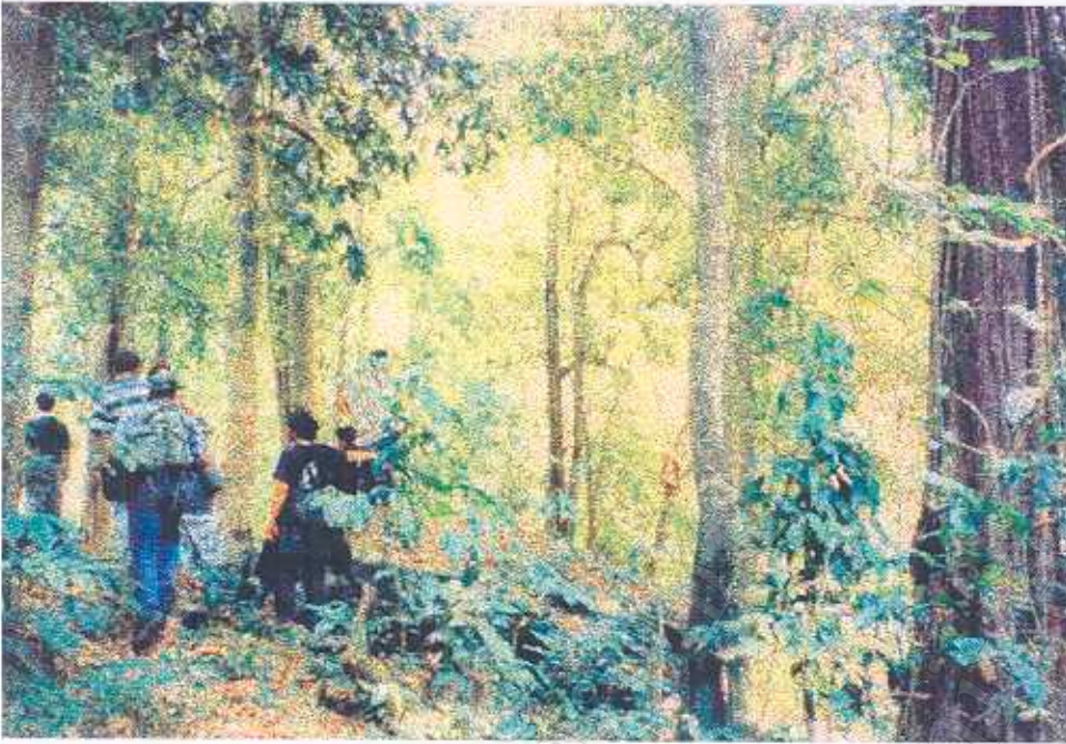
ภาพที่ 14 กิจกรรมเดินป่า ศึกษาธรรมชาติ (2)