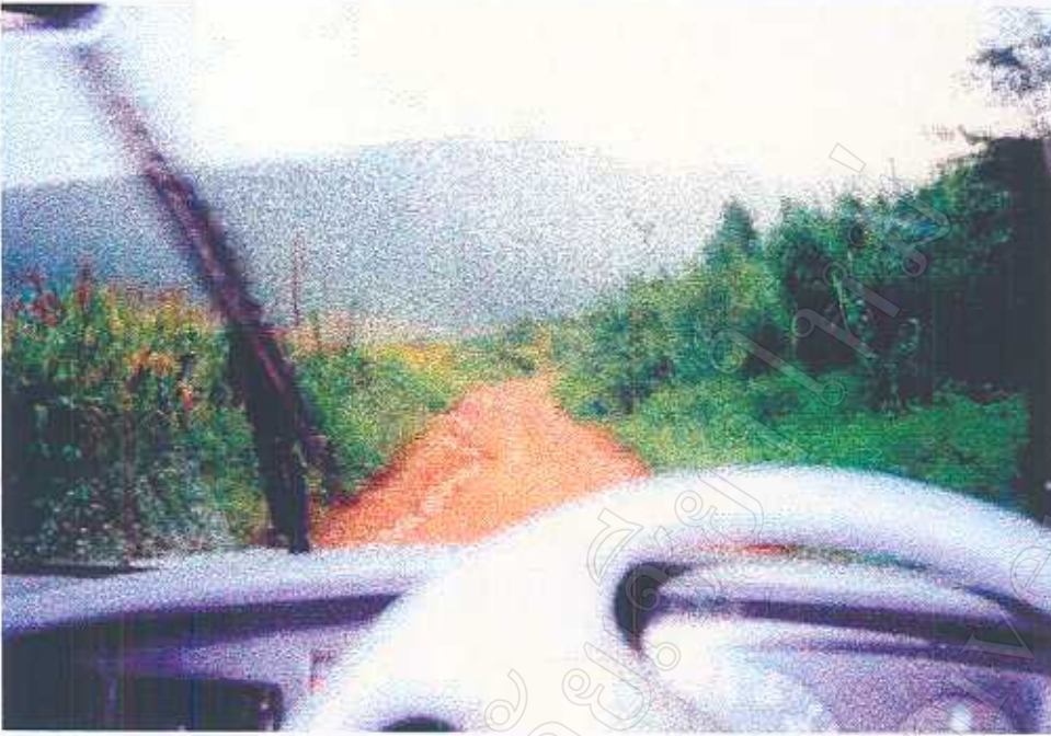
ภาพที่ 16 สภาพเส้นทางภายในแหล่งท่องเที่ยว