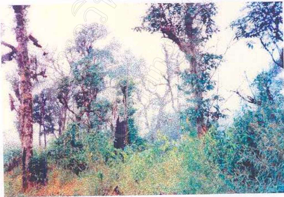
ภาพที่ 7 สภาพป่าภายในแหล่งท่องเที่ยว (3)