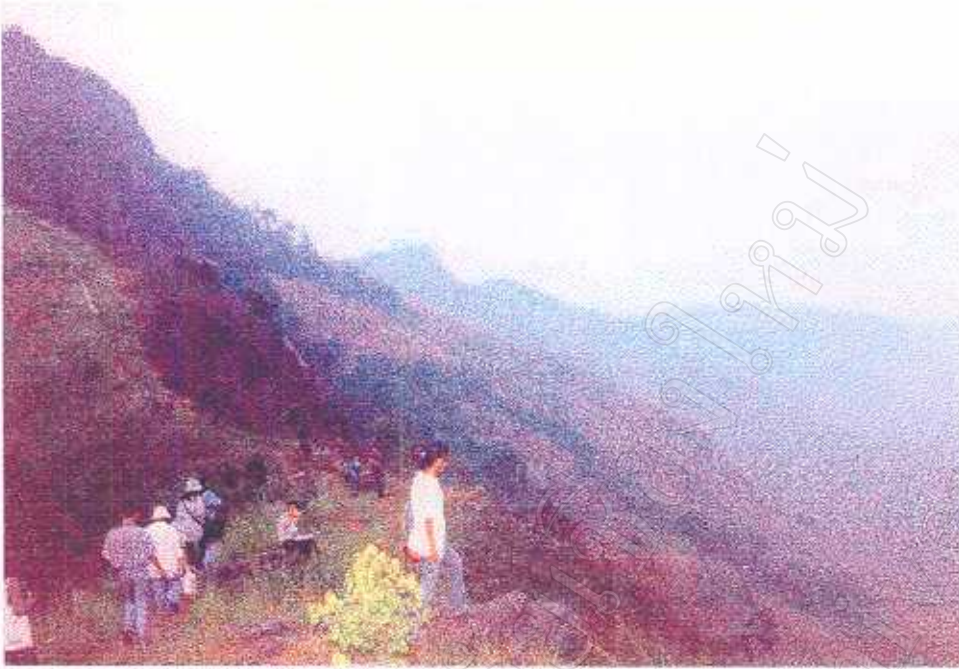
ภาพที่ 8 วิถีชีวิตที่สวนภายในแหล่งท่องเที่ยว