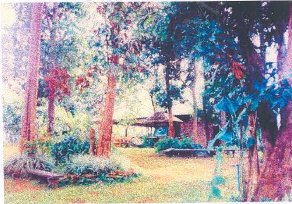
ภาพที่ 21 ศูนย์บริการนักท่องเที่ยวของคำบลผาซำงน้อย