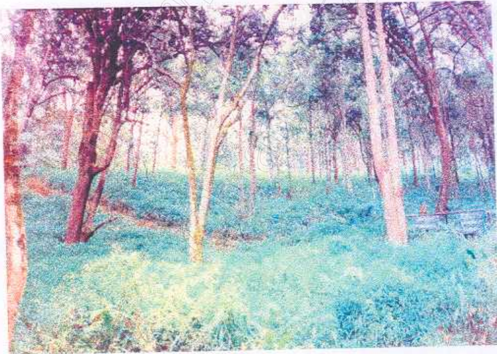
ภาพที่ 5 สภาพป่าภายในแหล่งท่องเที่ยว (1)