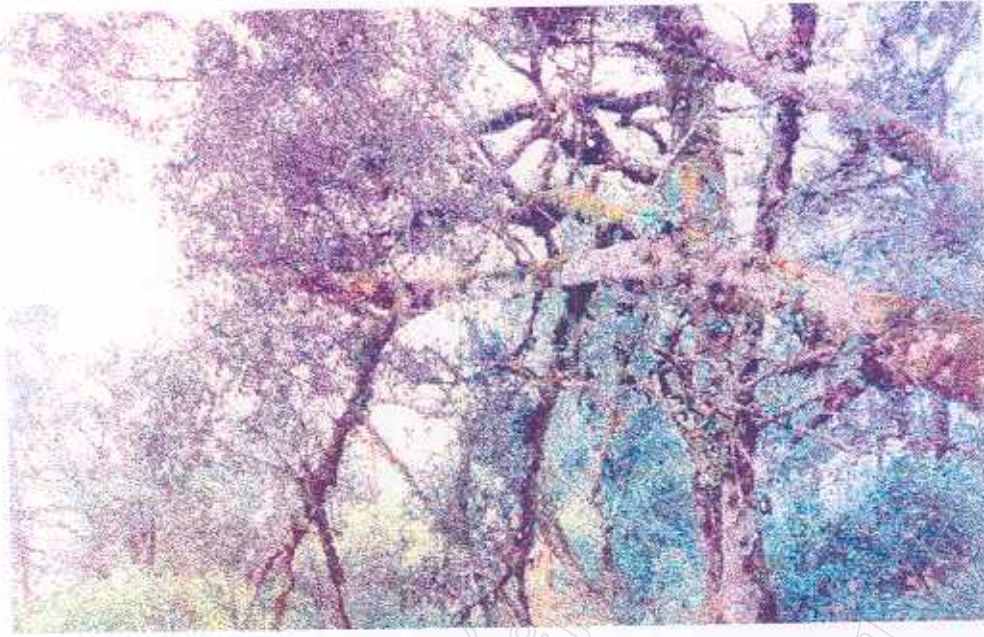
ภาพที่ 6 สภาพป่าภายในแหล่งท่องเที่ยว (2)