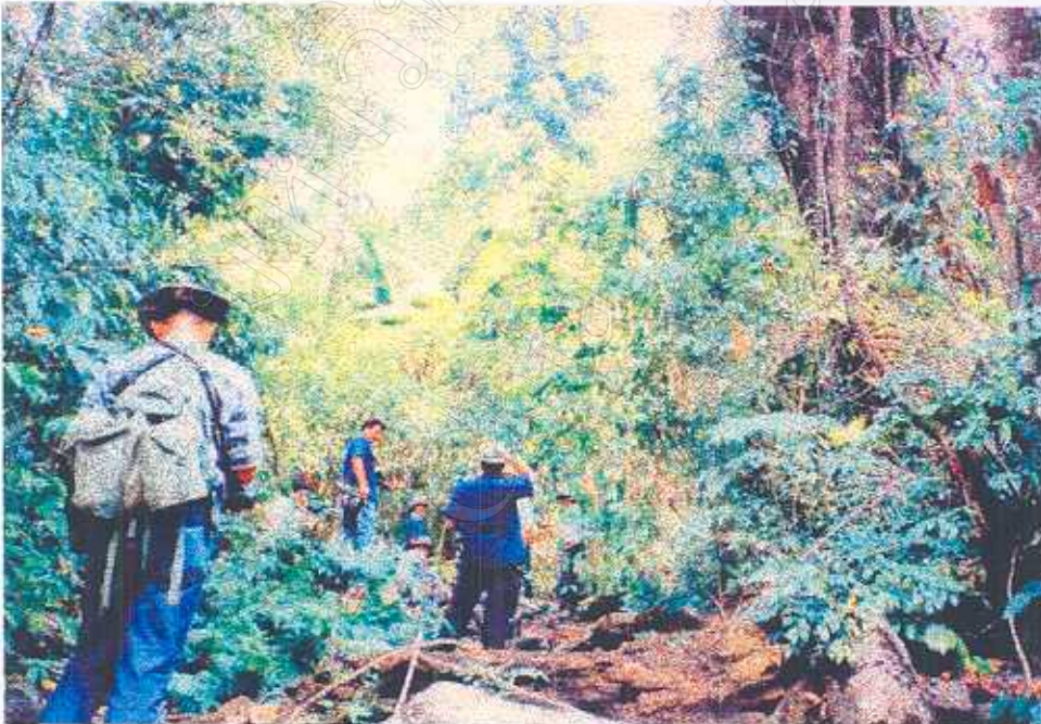
ภาพที่ 15 กิจกรรมเดินป่า ศึกษาธรรมชาติ (3)