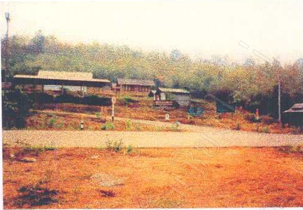
ภาพที่ 20 แสดงที่ตั้งชุมชนวัฒนธรรมชาวเขาคำบลผาซำงน้อย