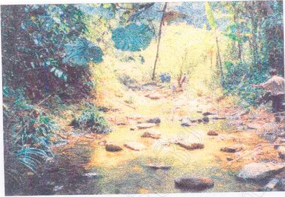
ภาพที่ 4 สภาพแวดล้อมภายในแหล่งท่องเที่ยว