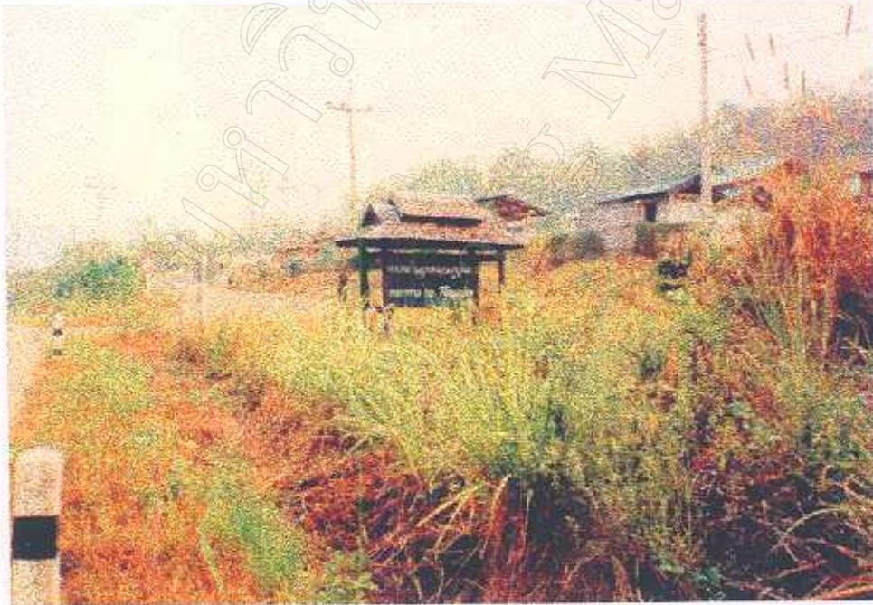
ภาพที่ 19 ป้ายบอกเส้นทางภายในแหล่งท่องเที่ยว