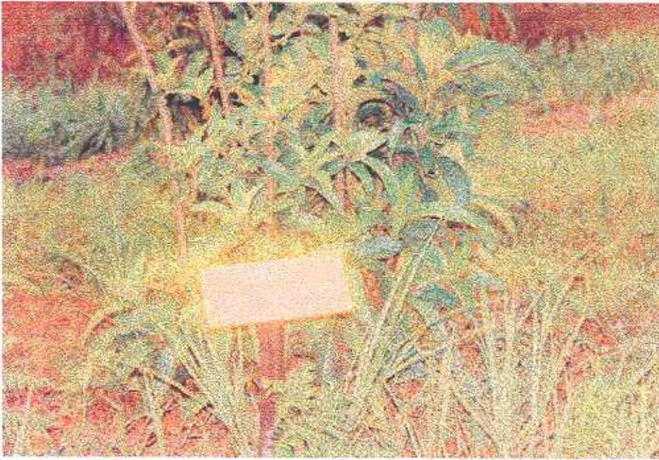
ภาพที่ 12 ป้ายสื่อความหมายธรรมชาติภายในแหล่งท่องเที่ยว