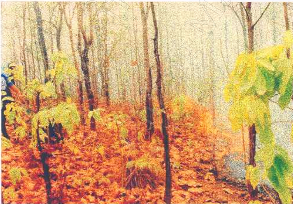
ภาพที่ 11 ไฟไหม้ป่า ปัญหาสำคัญของการจัดการแหล่งท่องเที่ยว