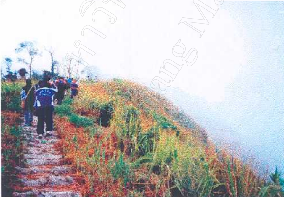
ภาพที่ 17 สภาพเส้นทางเดินเท้าภายในแหล่งท่องเที่ยว