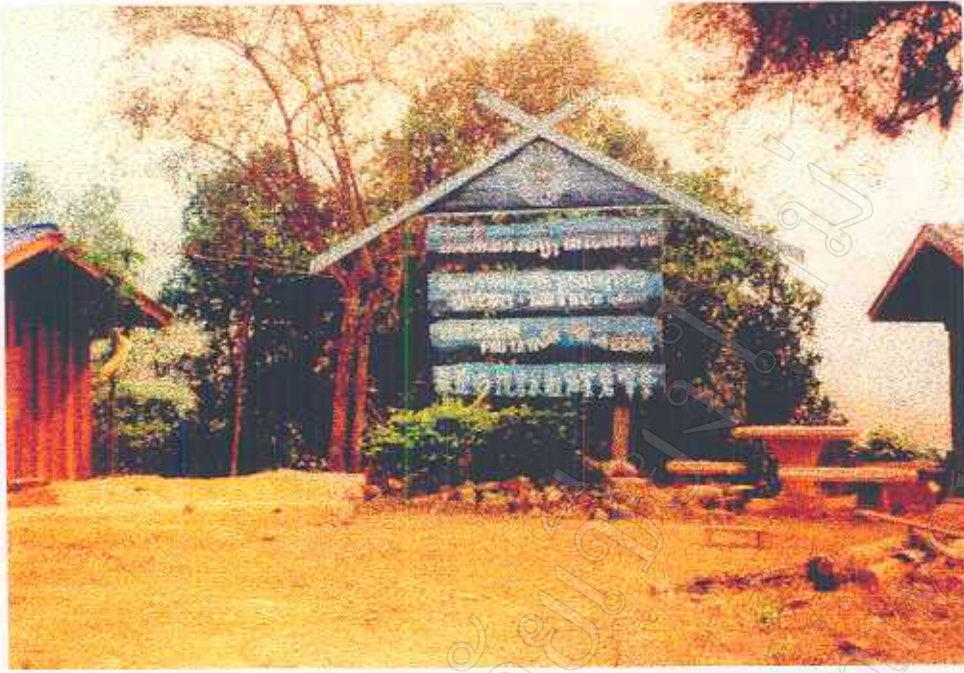
ภาพที่ 18 ป้ายแสดงตำแหน่งที่ตั้งของแหล่งท่องเที่ยว