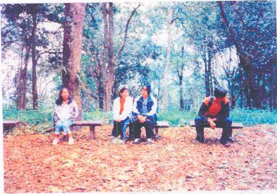
ภาพที่ 22 จุดนั่งพักระหว่างเส้นทางเดินป่า