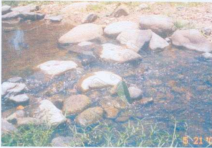
ภาพที่ 3 ภาพหินที่ไหลในชุมชน