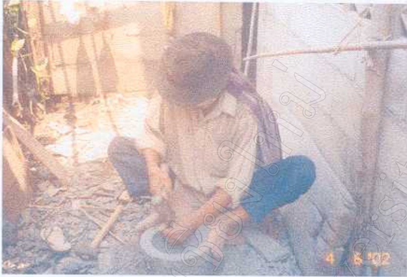
ภาพที่ 6 วิธีการแกะสลักครกหิน