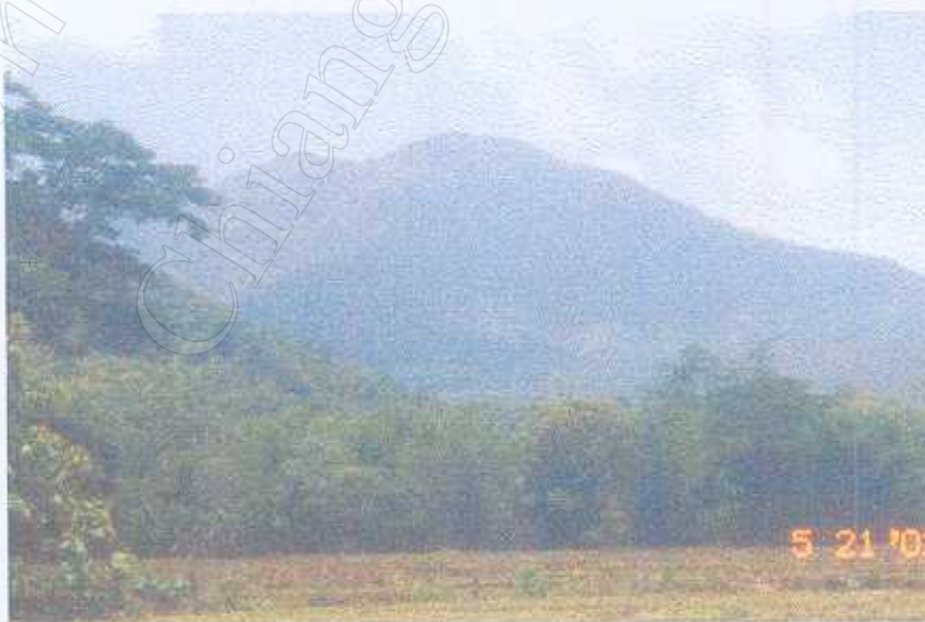
ภาพที่ 2 สภาพทรัพยากรทั่วไปของชุมชน

องค์การบริหารส่วนตำบลมีทรัพยากรธรรมชาติที่สำคัญ คือ กว๊านพะเยา ซึ่งเป็นแหล่งทำมาหากินของประชาชนในพื้นที่ นอกจากนั้นยังมีป่าไม้ ซึ่งเป็นแหล่งทำมาหากินของป่าของประชาชนเพื่อใช้ในการดำรงชีพ และยังมีทรัพยากรดินและหินที่สำคัญที่สามารถนำมาทำเป็นเครื่องปั้นดินเผาที่สวยงามและคงทน ในชุมชนบ้านจิวเหนือ ซึ่งชุมชนแห่งนี้เป็นที่เก่าแก่มีฝีมือในการแกะสลัก พระพุทธรูป ทำครกหิน และได้นำเอาทรัพยากรธรรมชาติมาใช้ เพราะจะสังเกตได้ว่า จะอยู่ใกล้กับภูเขามากที่สุดและจะมีหินที่สามารถนำมาใช้ประโยชน์ได้ ซึ่งเป็นที่มาของการแกะสลัก หินทราย ทรัพยากรหินที่สามารถนำมาผลิตเป็นครกหินได้อีกด้วยและเป็นแหล่งหินที่นำมาทำครกแล้วสวยงามและคงทน ซึ่งชุมชนบ้านจิวเหนือนิยมทำกันมาตั้งแต่สมัยบรรพบุรุษ เริ่มจากการนำเอาหินมาแกะสลักพระพุทธรูปก่อน แล้วนำมาประยุกต์เป็นครกหิน ขายได้ง่ายและสะดวกเป็นที่นิยมของคนทั่วไป และทรัพยากรที่สำคัญคือ น้ำตกจ้ำป่าทอง ซึ่งเป็นน้ำตกที่อยู่ใกล้ชุมชนมากที่สุด และ นักท่องเที่ยวนิยมมาเที่ยวโดยเฉพาะในช่วงร้อน