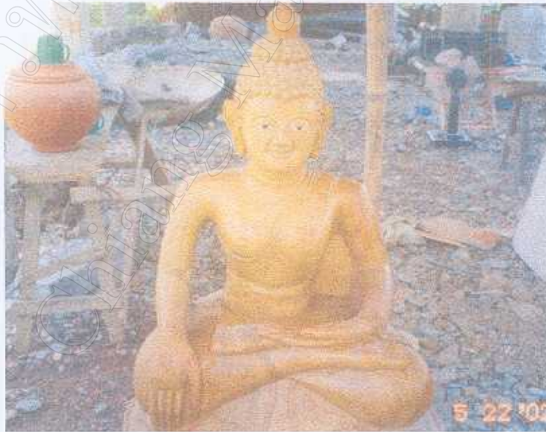
ภาพที่ 5 แกะสลักพระพุทธรูป

เนื่องจากจังหวัดพะเยามีเอกลักษณ์ด้านศิลปวัฒนธรรม แหล่งประวัติศาสตร์ ศาสนาสถาน รวมทั้งมีแหล่งท่องเที่ยวประเภทศิลปวัฒนธรรมและหัตถกรรม สามารถดึงดูดนักท่องเที่ยวได้ จึงทำให้มีศักยภาพและโอกาสในการพัฒนาให้เป็นศูนย์กลางการท่องเที่ยว จึงได้เกิดอาชีพขึ้นในแต่ละชุมชน ซึ่งแต่ละชุมชนจะมีจุดเด่นของแต่ละพื้นที่ ขึ้นอยู่กับสภาพแวดล้อมและภูมิอากาศที่เอื้อต่อการผลิต จึงทำให้เกิดอุตสาหกรรมในครัวเรือนขึ้นมาเพื่อหารายได้ในการดำรงชีพจึงเกิดอาชีพต่างๆ ดังเช่นชุมชนบ้านงิ้วเหนือที่ผลิต ครกหิน แกะสลักพระพุทธรูป และปั้นหม้อ ซึ่งเป็นที่ขึ้นชื่อของทางจังหวัด จากที่ขายในหมู่บ้านก็ขยายใหญ่เป็นอุตสาหกรรมขายให้บุคคลทั่วไป จึงทำให้เกิดการขยายกิจกรรม มีพ่อค้ามาลงทุนซื้อไปขายที่อื่น และร้านค้าย่อยๆ ก็จะมาตั้งดินค้าเพื่อนำไปขายยังพื้นที่อื่น จึงได้เกิดโครงการลงทุนด้านอุตสาหกรรมซึ่งการ ลงทุนส่วนนี้เป็นของภาคเอกชนทั้งหมด อุตสาหกรรมเหล่านี้จะมีศักยภาพทั้งด้านวัตถุดิบและตลาด รองรับจะต้องใช้เงินลงทุนตั้งแต่ 330 – 2,820 ล้านบาท และสามารถสร้างรายได้ระหว่าง 890 – 6,400 ล้านบาท (แผนลงทุนจังหวัดพะเยา, 2537)สรุปได้ดังนี้