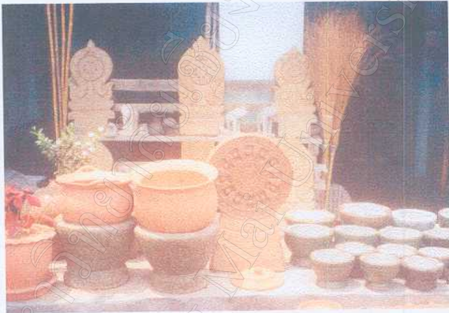
ภาพที่ 7 ผลิตภัณฑ์ ที่วางจำหน่าย

ได้ติดต่อหรือเข้าไปเยี่ยมชมได้ ถือว่าเป็นการส่งเสริมให้ชุมชนมีรายได้และสร้างความเข้มแข็งจะทำให้ชุมชนนั้นมีการพัฒนาผลิตภัณฑ์ของตนเองและส่งเสริมให้สร้างรายได้ให้แก่คนในชุมชนหลังฤดูทำนาและเพื่อไม่ให้คนในชุมชนไปทำงานที่อื่น หรือจังหวัดอื่น ให้หันมาทำงานที่จังหวัดหรือชุมชนของคนต่อไป