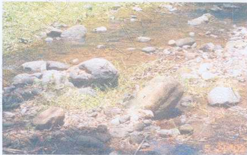
ภาพที่ 4 หินที่นำมาผลิตในสมัยก่อน