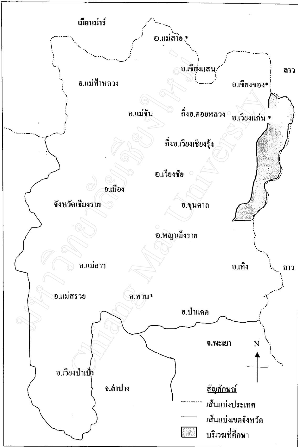
แผนภูมิที่ 3 แสดงแผนที่ที่ตั้งถิ่นฐานชาวไทยเชื้อจังหวัดเชียงราย *