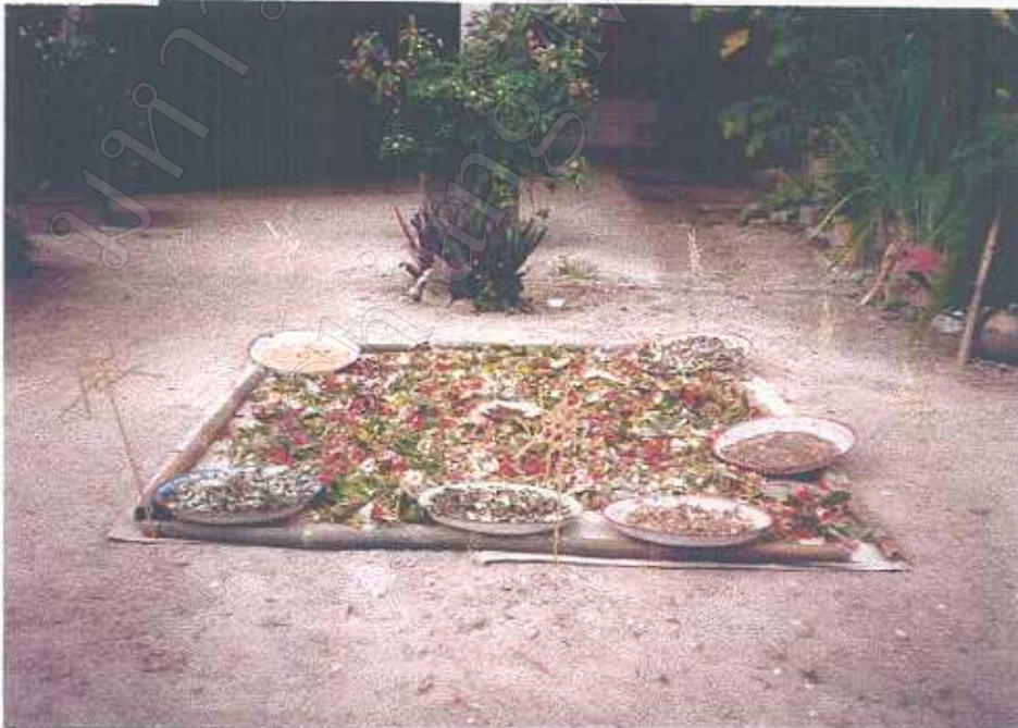
พิธีกรรมในการนำสมุนไพรมาตากแดดตามความเชื่อ