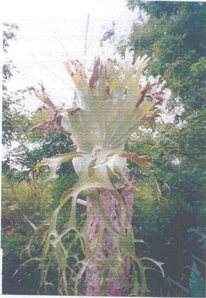
พืชสมุนไพรจากป่าที่ หมอพื้นบ้านนำมาปลูก (กระเช้าตึก)