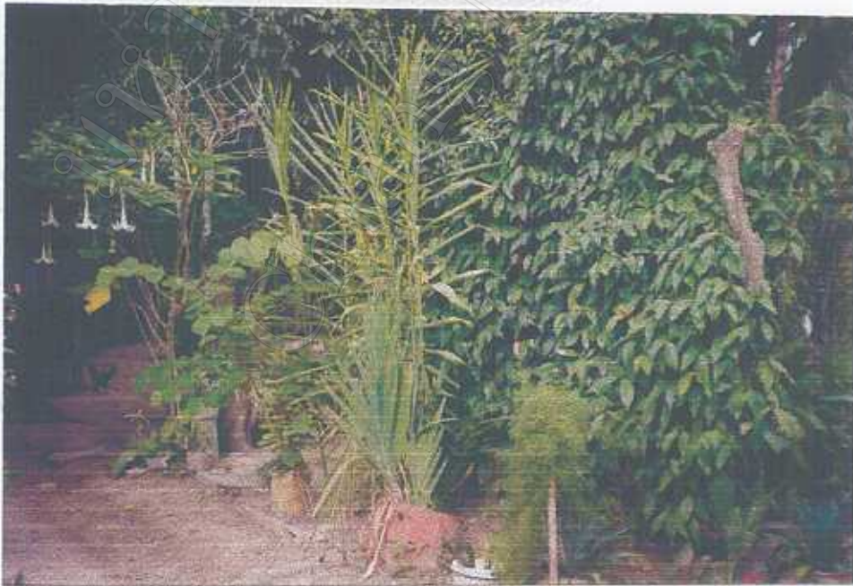
สวนสมุนไพรของหมอพื้นบ้าน ปลูกเพื่ออนุรักษ์สมุนไพรและสะดวกต่อการใช้