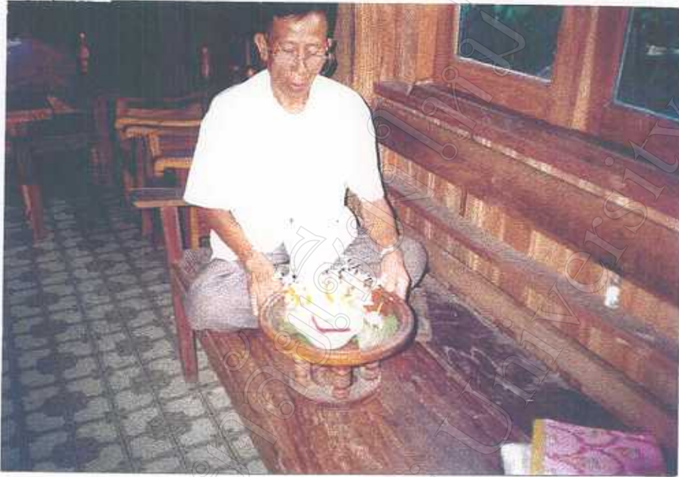
การขึ้นขันรักษา ประกอบด้วยเครื่องบูชาต่าง ๆ