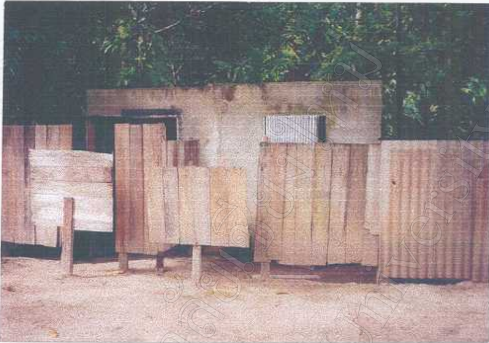
ห้องอบสมุนไพรของหมอพื้นบ้าน ในหมู่บ้าน เป็นวิธีการรักษาแบบหนึ่ง