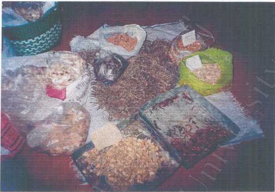
สมุนไพรที่เก็บมาจากป่า ถูกนำมาเก็บรักษาไว้ตามวิธีการของหมอแต่ละคน