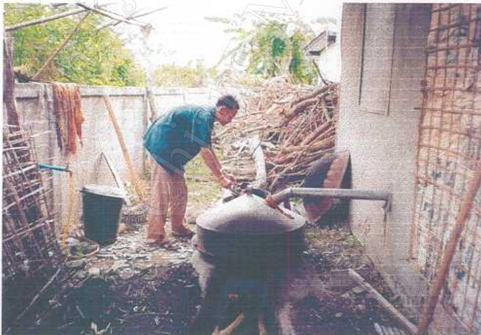
การใช้ภูมิปัญญา ในการนำไอน้ำสมุนไพรมาอบตัวและ ใช้ชาดื่มสมุนไพรดื่มเพื่อปรับธาตุ