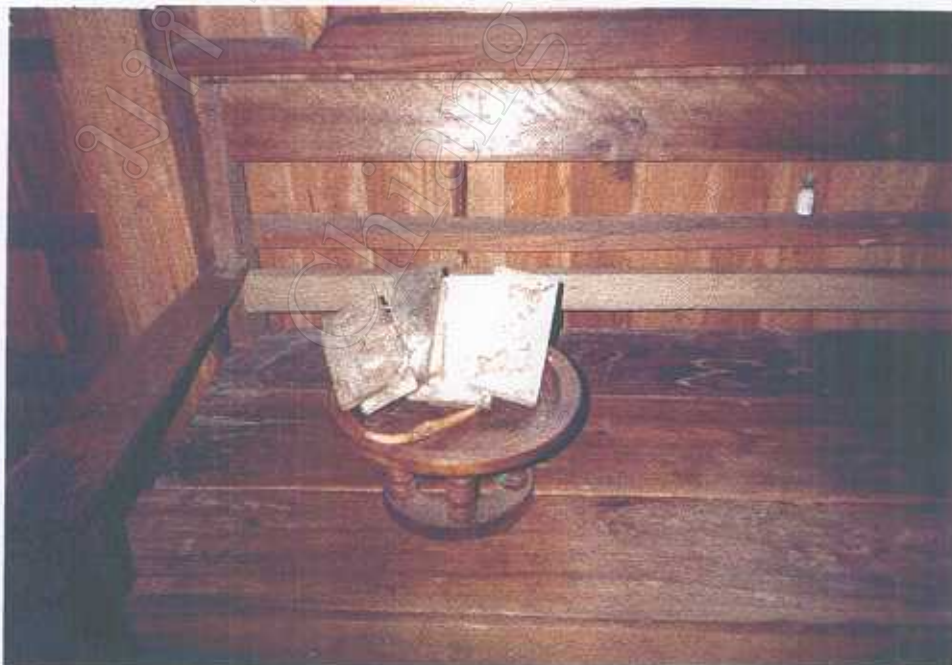
สุครยาสมุนไพรรและเขาสัตว์ที่หมอพื้นบ้านใช้ในกระบวนการรักษา