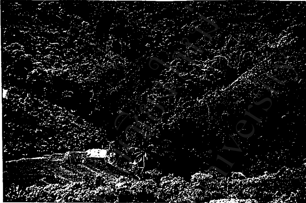
การทำนาแบบขั้นบันได