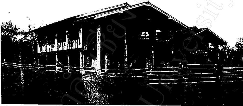
บ้านชาวพื้นราบ