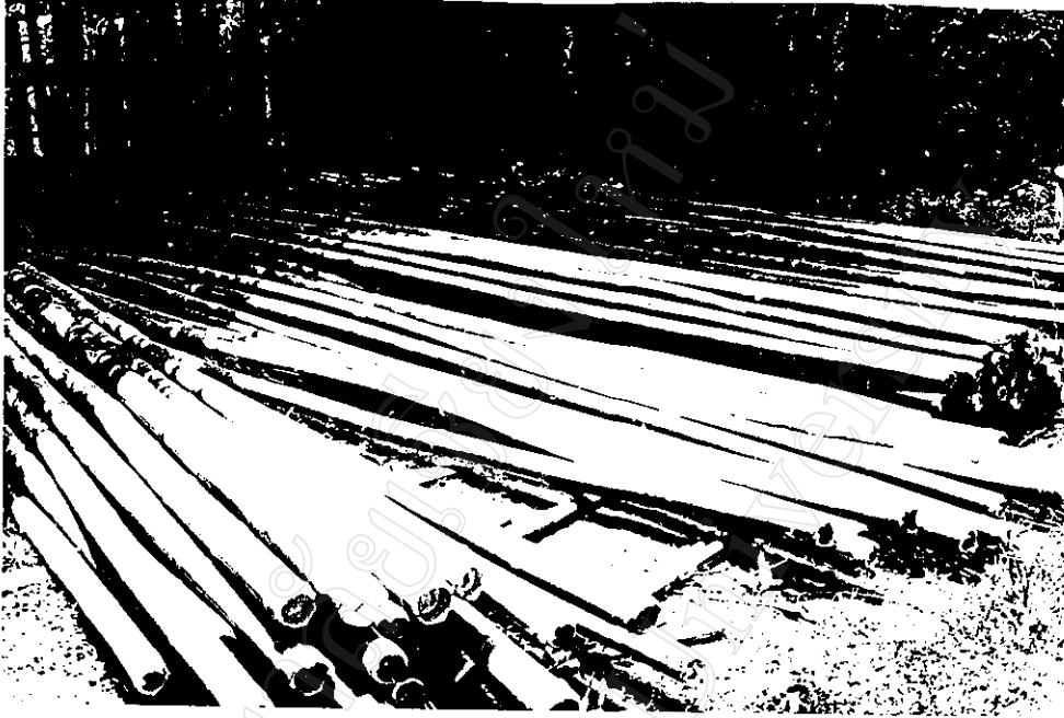
ไม้ไฟนำไปจำหน่าย