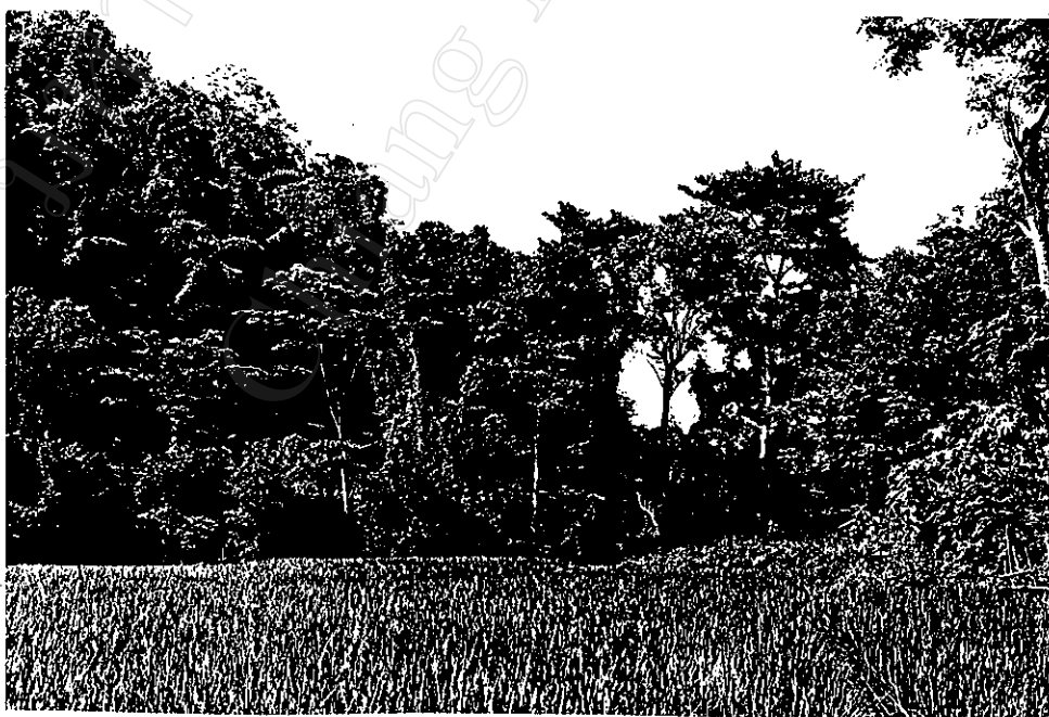
การอนุรักษ์ป่าต้นน้ำรอบ ๆ หมู่บ้าน