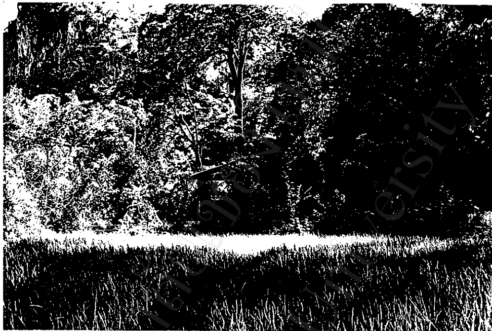
ศาลเจ้าพ่อหอ บริเวณน้ำไหลออกจากรู 3 รู