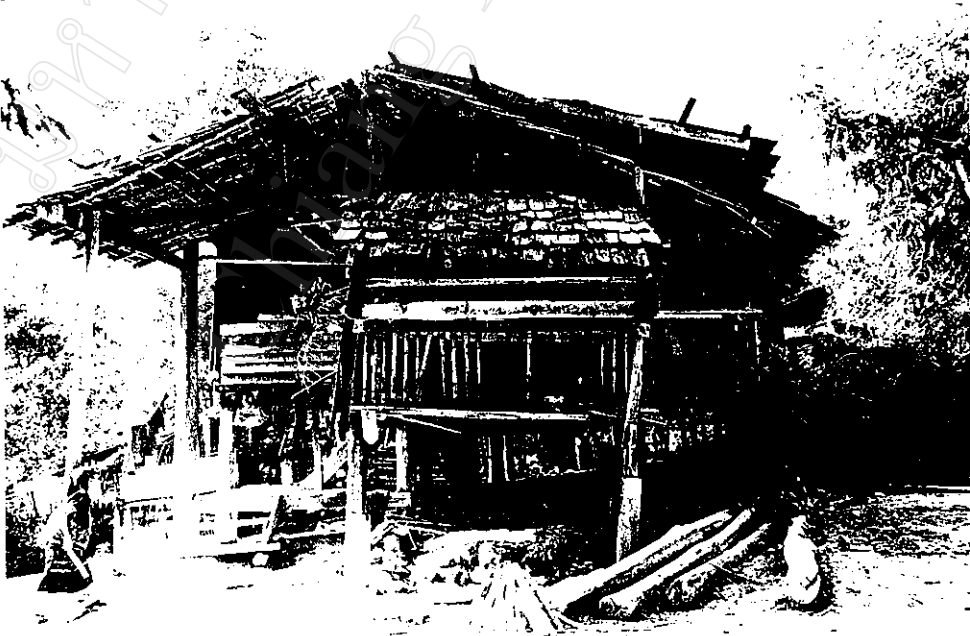
บ้านชาวไทยภูเขา