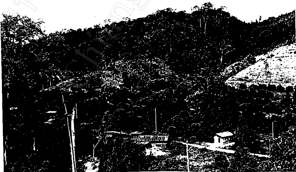
การทำไร่เลื่อนลอยและการทำสวนผลไม้