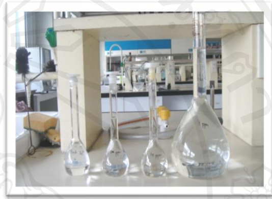
ภาพ ข. 2 สารละลายเมลามีนความเข้มข้นต่างๆ