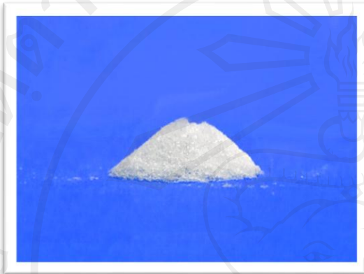
ภาพ ข. 1 ลักษณะผงเมลามีนความบริสุทธิ์ร้อยละ 99