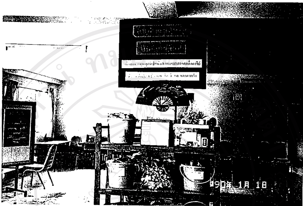
รูปภาพที่ 3 กิจกรรมการสร้างการมีส่วนร่วมของพระสงฆ์และบุคคลทั่วไปในการสงเคราะห์ชุมชนกรณีปัญหาโรคเอดส์ จากการระดมทุน