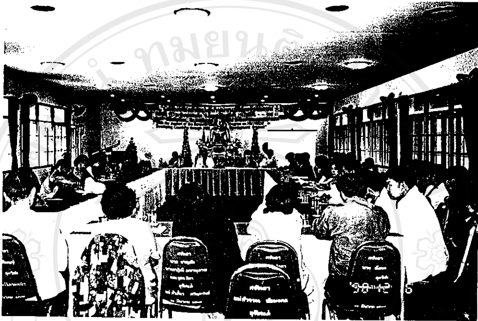
รูปภาพที่ 7 กิจกรรมการประสานความร่วมมือระหว่างบ้าน วัด ชุมชน ในการแก้ไขปัญหาโรคเอดส์ โดยการจัดเวทีเสวนาระหว่างพระสงฆ์ ผู้นำชุมชน ผู้ติดเชื้อ ชาวบ้าน องค์กรภาครัฐ และเอกชน

ลิขสิทธิ์มหาวิทยาลัยเชียงใหม่ Copyright© by Chiang Mai University All rights reserved