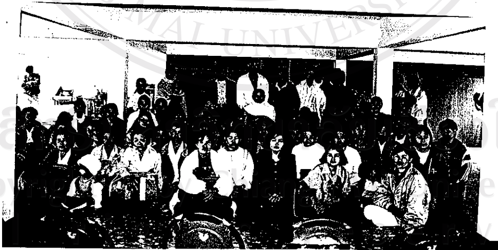
รูปภาพที่ 2 กิจกรรมการสงเคราะห์ผู้ที่ประสบปัญหาเรื่องโรคเอดส์ โดยการแจกของ ในการพบปะกลุ่มประจำเดือน