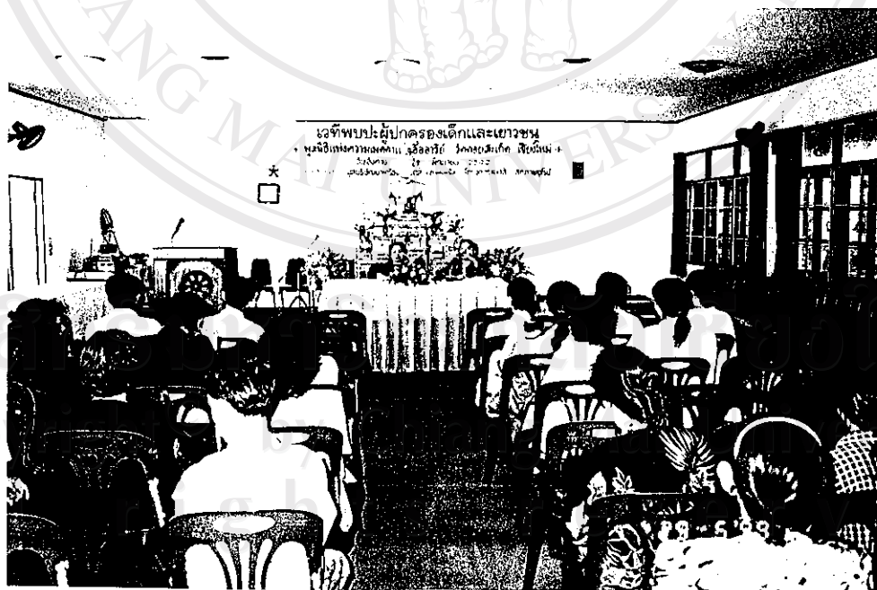
รูปภาพที่ 4 กิจกรรมการสร้างครอบครัวให้ปลอดภัยจากโรคเอดส์ โดยการสร้างความเข้าใจในเรื่องโรคเอดส์แก่ผู้ปกครองเยาวชน