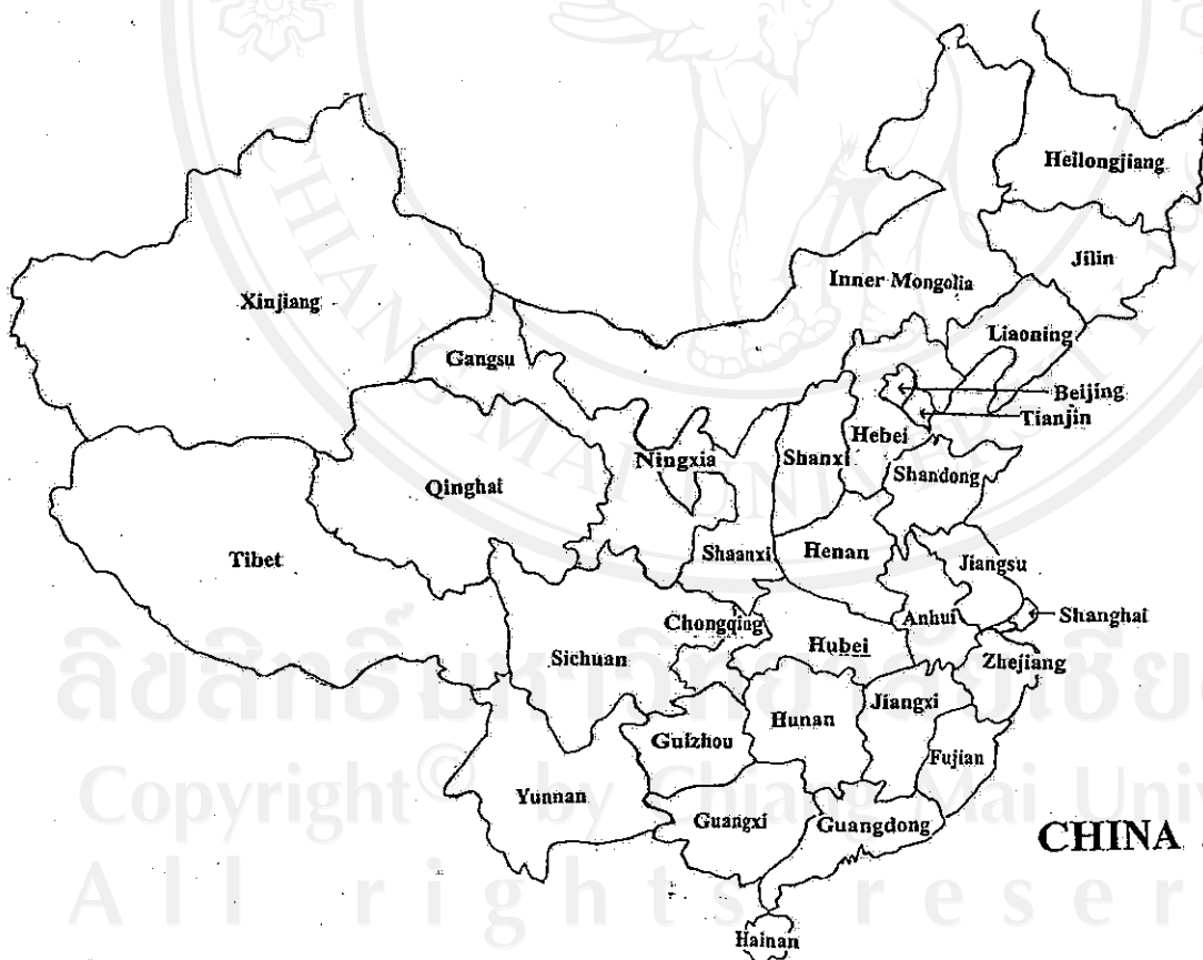
รูป 4.1 แผนที่ประเทศจีน

2.7 เขตภาคใต้ของจีน ครอบคลุมพื้นที่มณฑลยูนนาน (Yunnan) และเขตปกครองตนเองกวางสี (Guangxi) มีประชากรประมาณ 90 ล้านคน และมีผลผลิตมวลรวมประชาชาติคิดเป็นอัตราส่วนร้อยละ 3.8 ของผลผลิตมวลรวมทั่วทั้งประเทศ