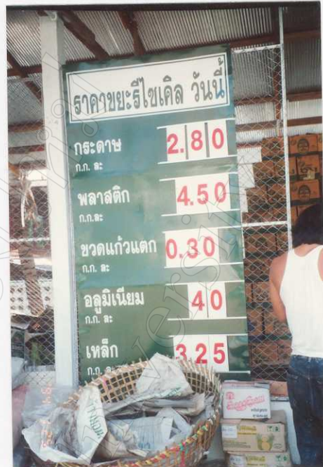
ราคากลางของขยะรีไซเคิล