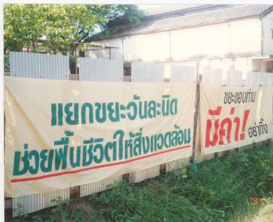
ป้าย ประกาศ เพื่อรณรงค์ให้มีการคัดแยกขยะ