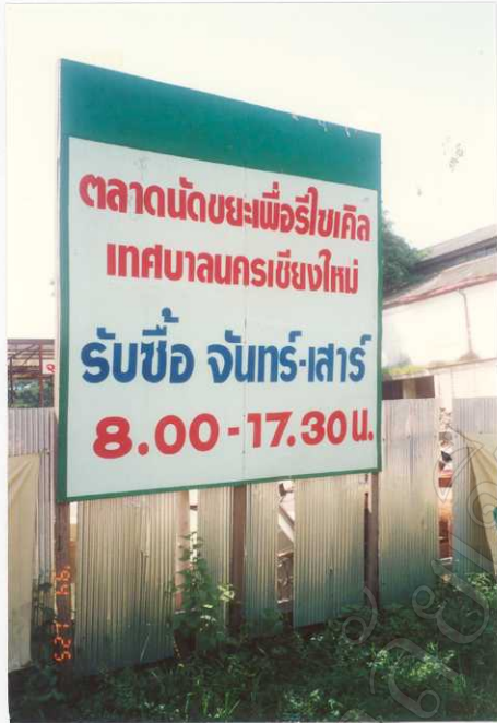
ตลาดกลางซื้อ-ขายขยะ ซึ่งได้เปิด ดำเนินการไปแล้ว