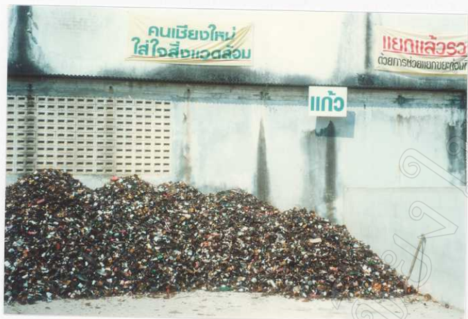
ขยะรีไซเคิลที่ทำการคัดแยก ออกเป็นชนิดต่างๆ เรียบร้อยแล้ว