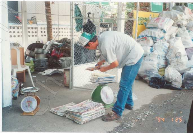
กิจกรรมการซื้อ-ขาย ขยะรีไซเคิล ที่ตลาดกลางซื้อขายขยะรีไซเคิล