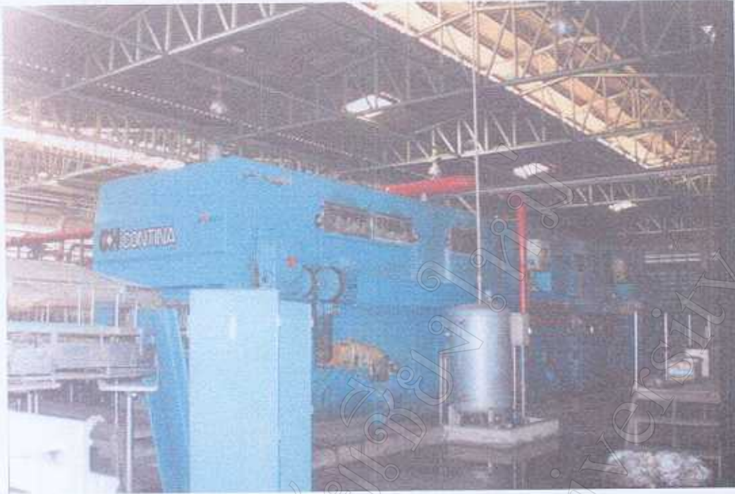
เครื่องลึงขวด