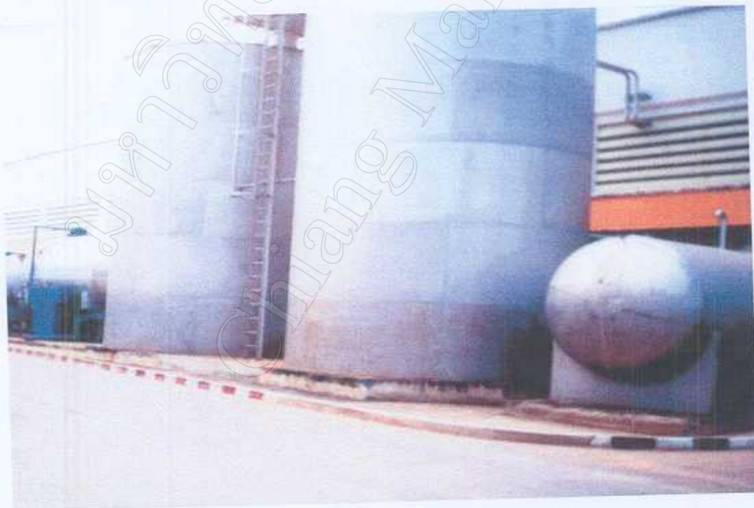
ถังเก็บน้ำที่ 1 และ 2