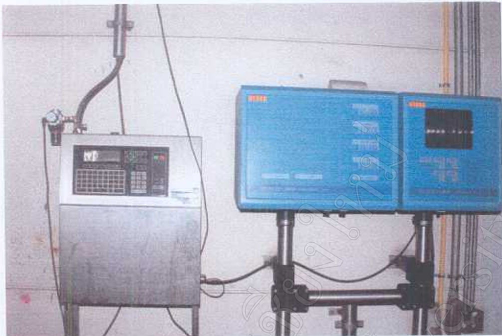
เครื่อง Ink jet และเครื่องตรวจปริมาณน้ำ