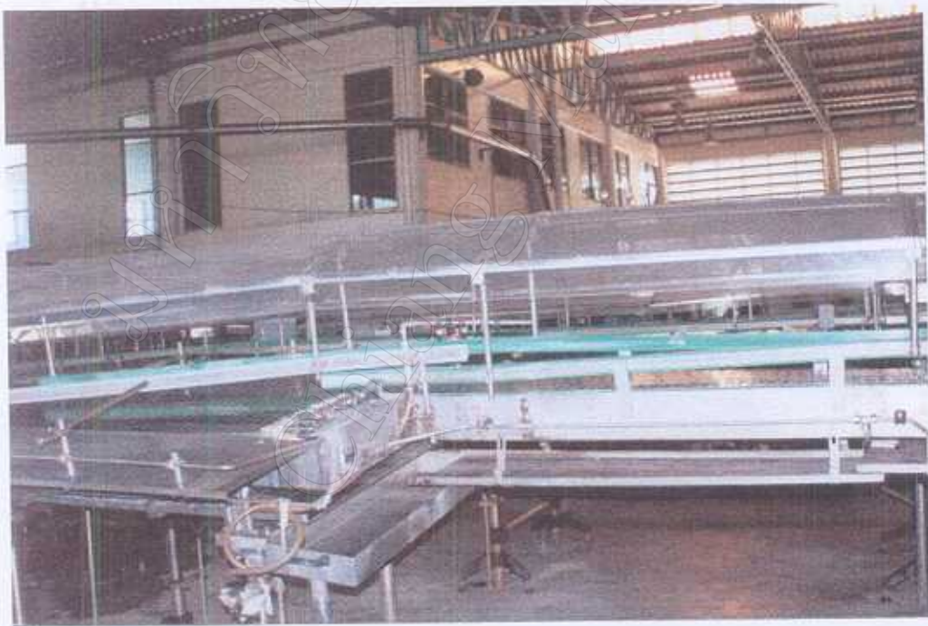
รางเดินขวดไปยังเครื่องบรรจุ