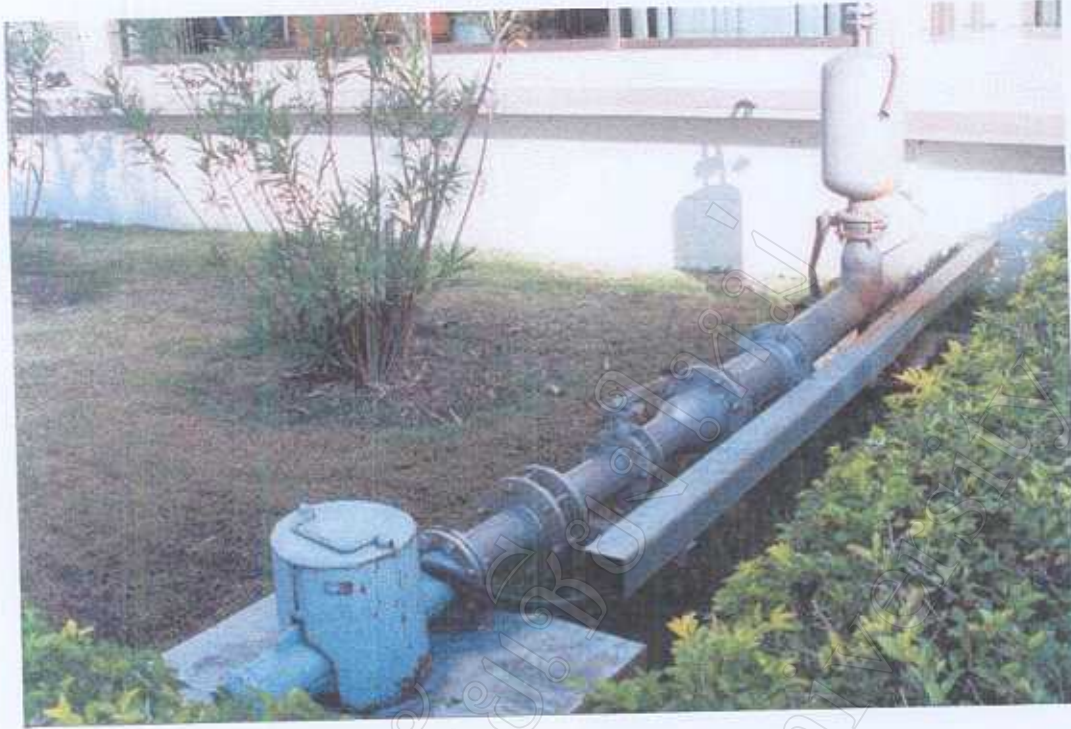
ปั้มน้ำบาดาล