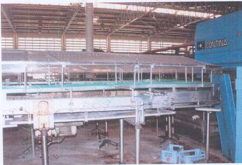
รางเดินขวดออกจากเครื่องลึงขวด