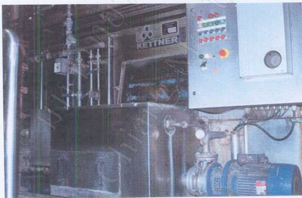
ระบบเครื่องล้างล้าง