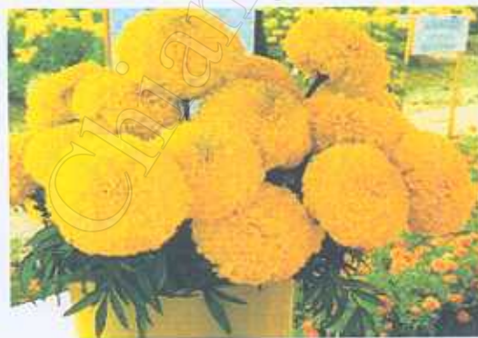
ภาพที่ 3-1 ลักษณะของดอกดาวเรือง

ลักษณะทางพฤกษศาสตร์ของดาวเรือง คือ มีลักษณะเป็นไม้ดอกที่มีต้นสูงประมาณ 25 – 60 ซม. ใบเป็นรูปหอก ปลายแหลม ขอบหยัก ดอกเป็นช่อกระจุกเดี่ยวที่ปลายยอด ดอกวงนอกกลีบดอกเป็นรางรูปน้ำ โคนเป็นหลอดเล็ก ปลายแผ่ดอกวงใน กลีบดอกเป็นหลอด มีหลายสี เช่น สีส้ม เหลืองทอง ขาว และสองสีในดอกเดียวกัน และมีทั้งดอกชั้นเดียวและดอกซ้อน 2