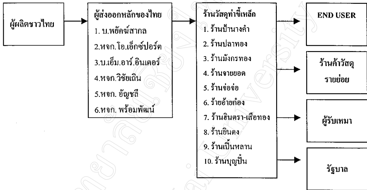
ภาพที่ 4 แสดงช่องทางการจัดจำหน่าย และการกระจายสินค้าวัสดุก่อสร้างจากประเทศไทยไปยังประเทศเมียนมาร์ผ่านชายแดนแม่สาย-ท่าซีเหล็ก

ช่องทางการจัดจำหน่าย และการกระจายสินค้าใช้วิธีการกระจายสินค้าเหมือนกับทางฝั่งไทย คือ ร้านผู้แทนจำหน่ายเป็นผู้ส่งออกสินค้า และส่งให้ร้านค้าช่วงที่ทำซีเหล็ก และร้านค้าช่วงที่ทำซีเหล็กก็จะเป็นผู้นำเข้าสินค้า และส่งต่อไปยังร้านค้าที่เมืองอื่น ๆ โดยร้านค้าช่วงที่ทำซีเหล็กจะมีใบอนุญาตนำเข้าสินค้าจากทางการพม่าด้วย ดังภาพที่ 4