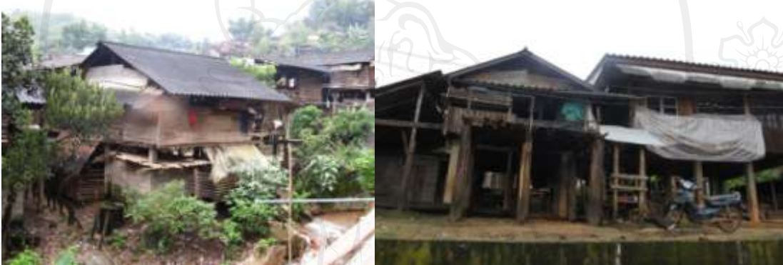
ภาพ 4-2 ตัวอย่างการบันทึกภาพถ่ายสภาพแวดล้อมของชุมชนบ้านดง พ.ศ. 2553