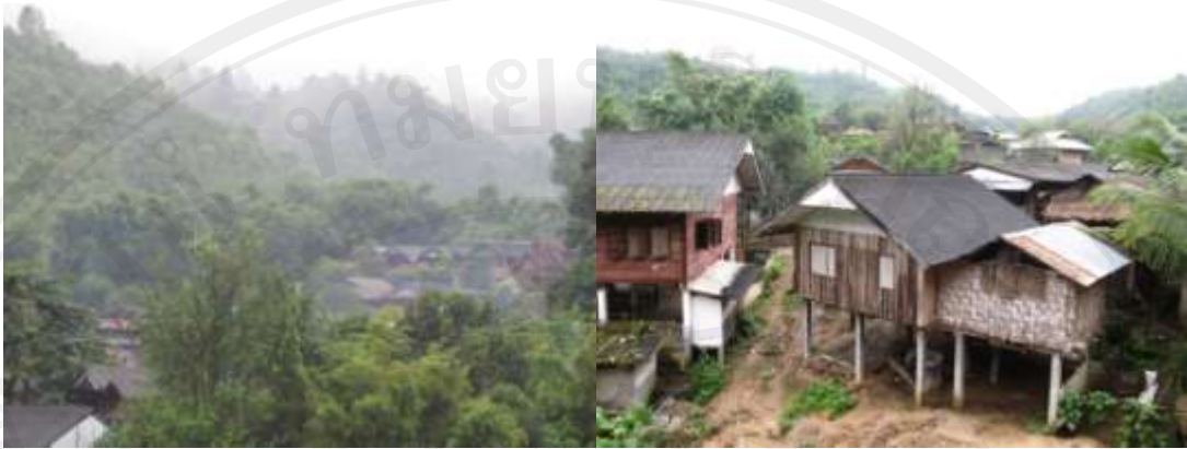
ภาพ 4-1 ตัวอย่างการบันทึกภาพถ่ายสภาพแวดล้อมของชุมชนบ้านดง พ.ศ. 2553