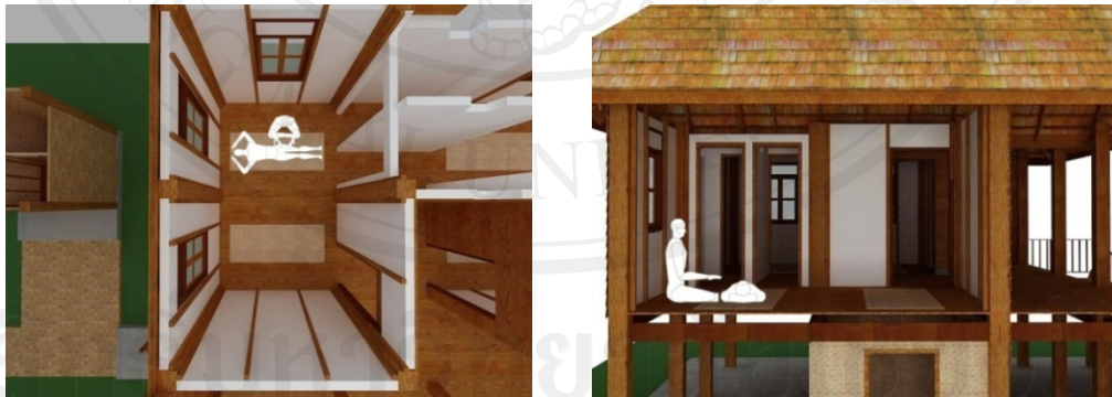
รูปที่ 52 รูปที่ว่างทางกิจกรรมการนวดทั่วไป, การนวดเส้นต่างๆ ที่สัมพันธ์กับสภาพแวดล้อมส่วนห้องนอน ของเรือนพื้นดินเชียงใหม่