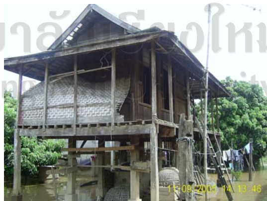
บ้านเลขที่ 120 นายหนึ่ง พรหมดีบ