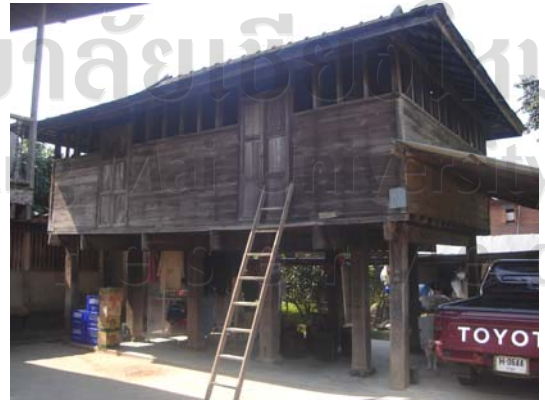
บ้านเลขที่ 109 นายบุญทา ธรรมไชย