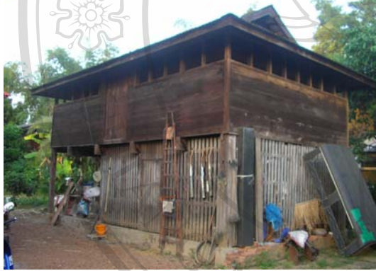
บ้านเลขที่ 24 นายทอง ปวงคำ