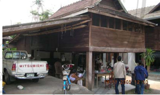
บ้านเลขที่ 23 นายคำ ศรีกันทา