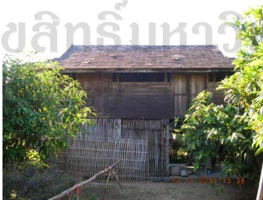
บ้านเลขที่ 131 นายจันทร์ดีป ธรรมไชย