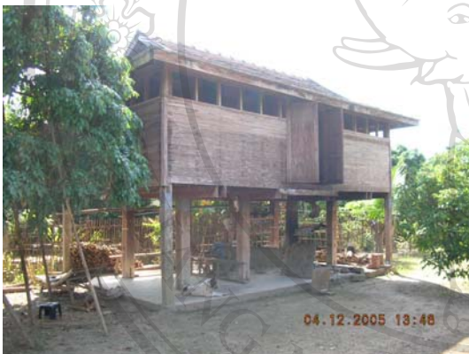
บ้านเลขที่ 81 นายดองจันทร์ พงษ์ใส