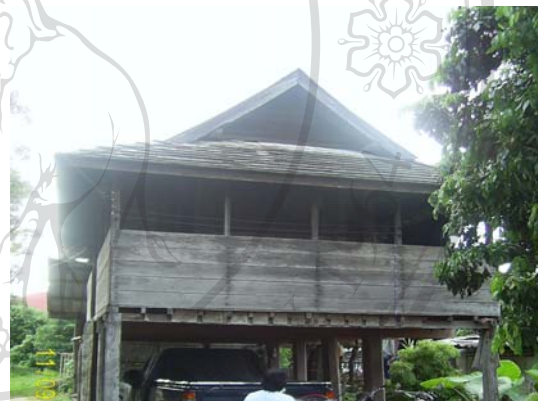
บ้านเลขที่ 83 นางนาง แ่งจันทร์