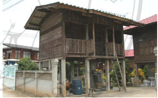
บ้านเลขที่ 43 นายมูล สมณะ