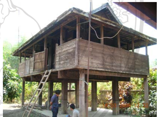
บ้านเลขที่ 66 นางสาวจันทร์ดี จันทร์ไชย