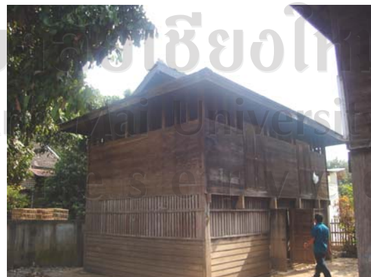
บ้านเลขที่ 1 นายจันทร์ตา อินตะวงค์