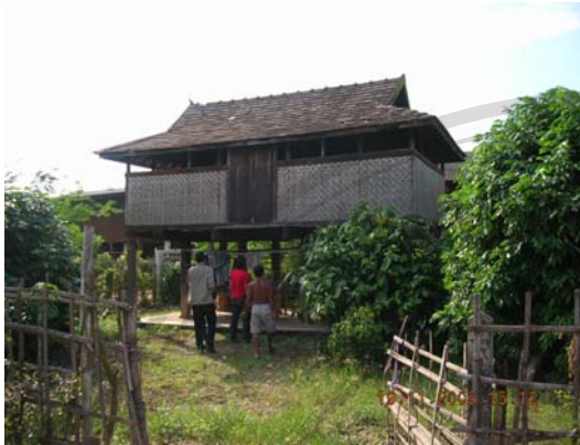
บ้านไม่มีเลขที่ นายดอก สมานะ