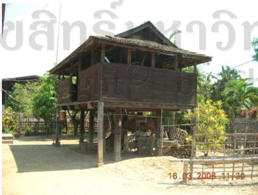
บ้านเลขที่ 67 นายคำมูล อินปัน