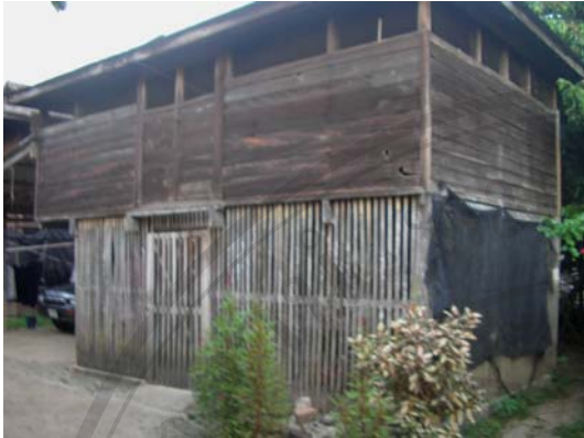
บ้านเลขที่ 93 นายตื้อ ธรรมณี