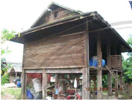
บ้านเลขที่ 57 นางสาว จันทร์พรหม