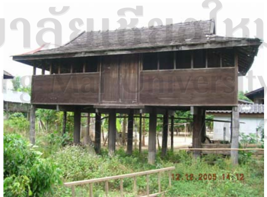
บ้านเลขที่ 56 นางสาว สุแก้ว