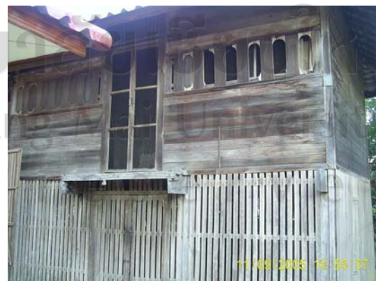
บ้านเลขที่ 89 นางพิมลพรรณ จันทรพรหม