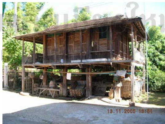
บ้านเลขที่ 39 อัยศรีวัลย์ ดีบสุยะ