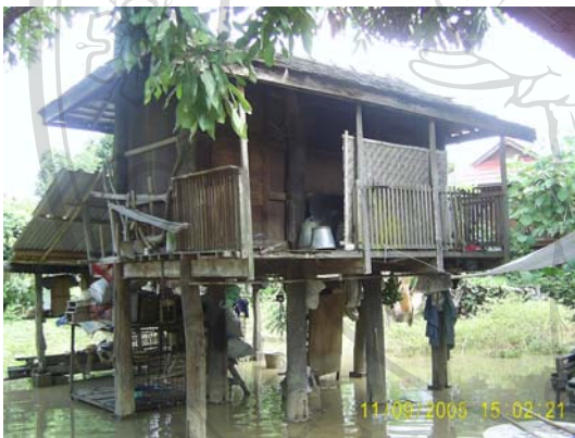
บ้านเลขที่ 66 นายแก้ว ตันอกภัย