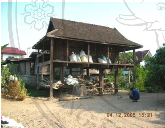
บ้านเลขที่ 40 แม่อุ้ยก่อง อินปิ่น