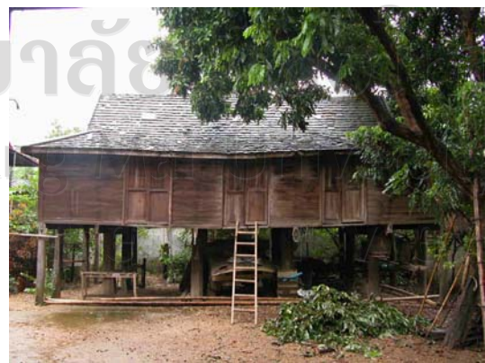
บ้านเลขที่ 17 นายจำเริญ ทะนันไชย