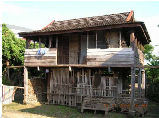
บ้านเลขที่ 43 นายทอง คุณา