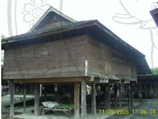
บ้านเลขที่ 90 นายคำมูล สิงห์กัณฑ์