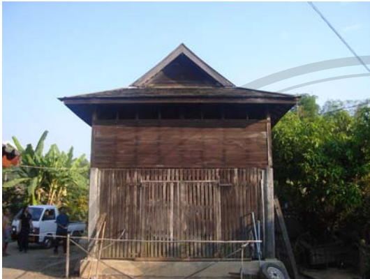
บ้านเลขที่ 126 นายปิ่น จันทร์ไชย