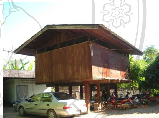
บ้านเลขที่ 10 นายมานพ บ่วงคำ