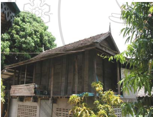
บ้านเลขที่ 12 นายอรุณ สิทธิเจริญ