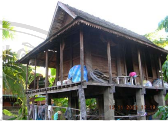
บ้านเลขที่ 25 นายสม จันทร์ดี