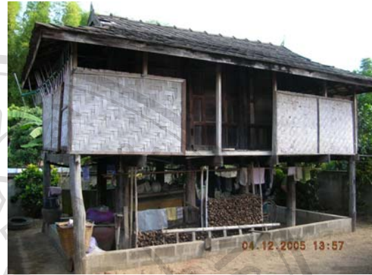
บ้านเลขที่ 136 นายแก้ว สิทธิเจริญ