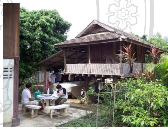
บ้านเลขที่ 36 นายบุญช่วย อินตุน