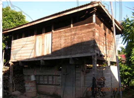
บ้านเลขที่ 55 นางนาง ปัญญาโน