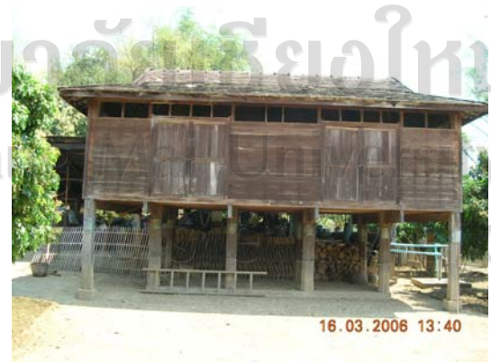
บ้านเลขที่ 42 นางจันทร์หอม หงษ์ทอง