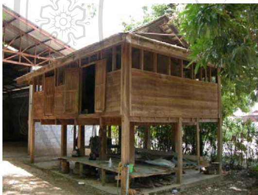
บ้านไม่มีเลขที่ นายมนัส จันทร์ไชย