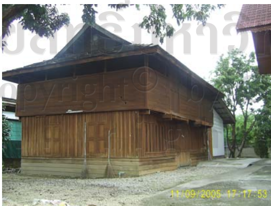
บ้านเลขที่ 93 นางอ้นคำ บุญตัน