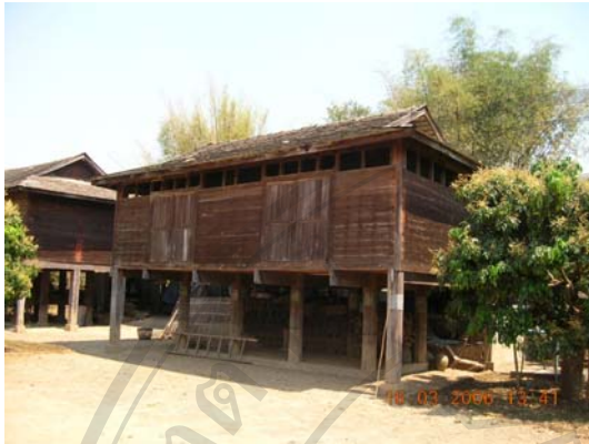
บ้านเลขที่ 42/1 นางจันทร์หอม หงษ์ทอง