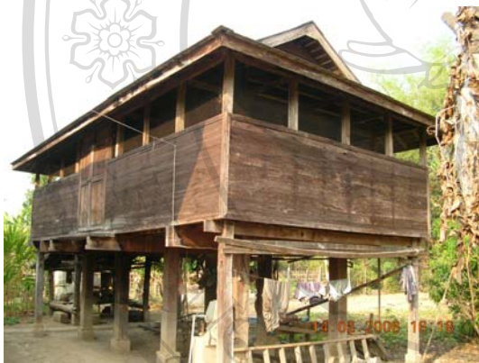
บ้านเลขที่ 3 นายคำ ศรีพรหม