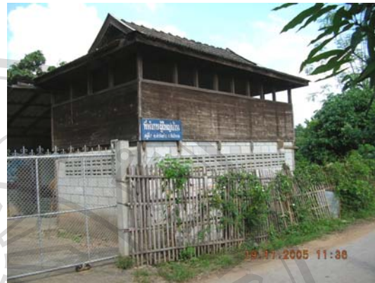
บ้านเลขที่ 96 นายพินกร ตีบสุยะ