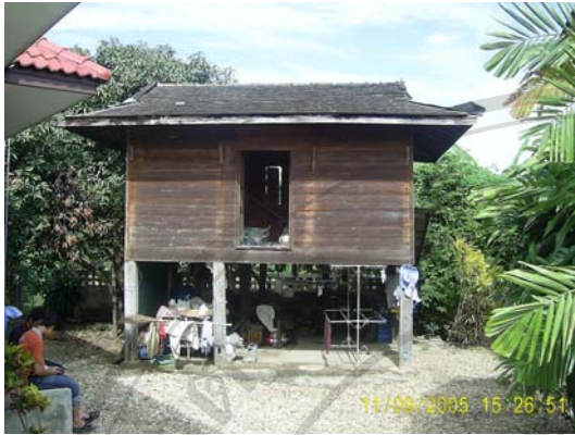
บ้านเลขที่ 25 นายคำ ถาวัง