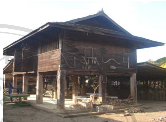
บ้านเลขที่ 63 นายประพันธ์ นันทาศรี