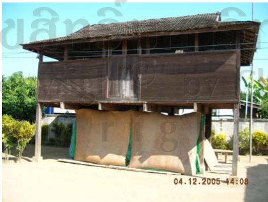
บ้านเลขที่ 41 นายสวัสดิ์ สิทธิเจริญ