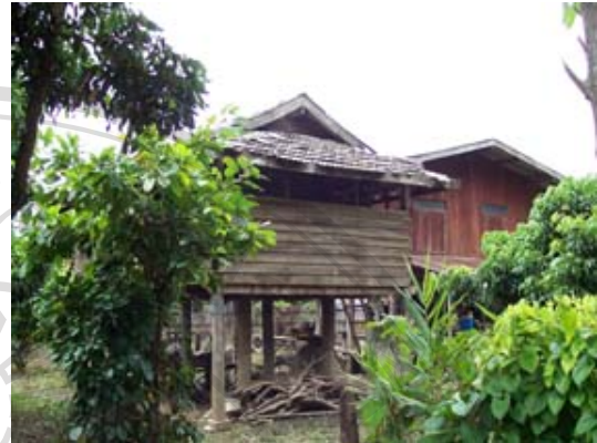
บ้านเลขที่ 27 นายจรัส ไชยเพชร