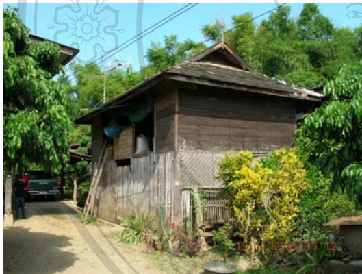
บ้านเลขที่ 14 นายคำ จันทร์ไชย