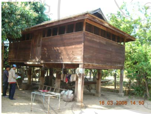
บ้านเลขที่ 58 นายธีรศักดิ์ ธารวงศ์