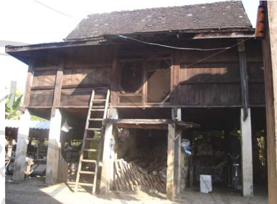
บ้านเลขที่ 2 นายอินทร์ตา สมณะ