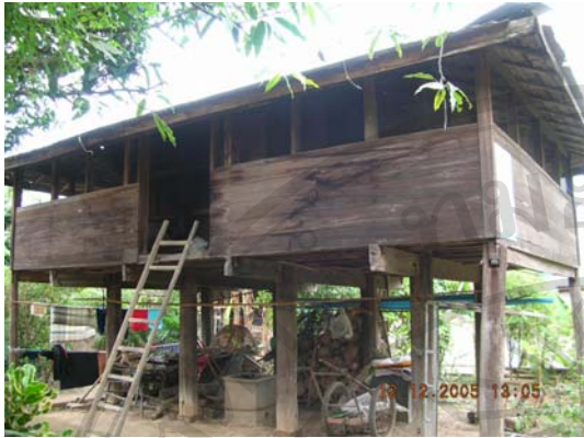
บ้านเลขที่ 26 นายอินคำ บังอิ้อ์หล้า