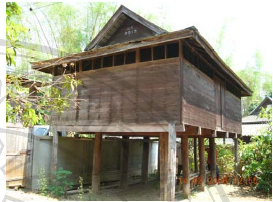
บ้านเลขที่ 37 นายต๋น ทิพย์สอน