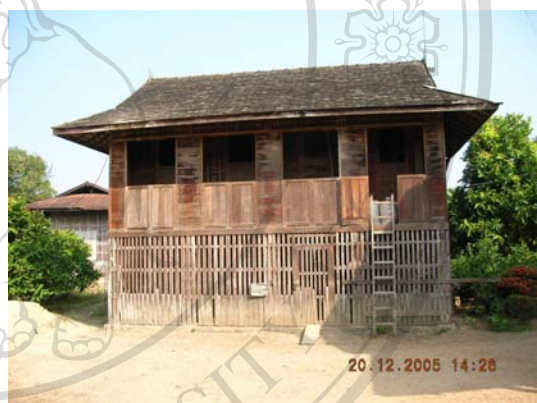
บ้านเลขที่ 1 นายทิพย์ ใจวัง