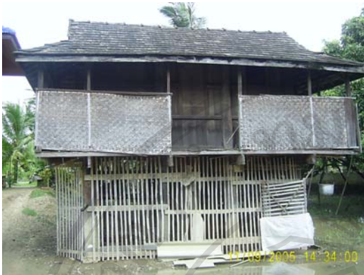
บ้านเลขที่ 63/1 นายสุนทร ศรีพรหม