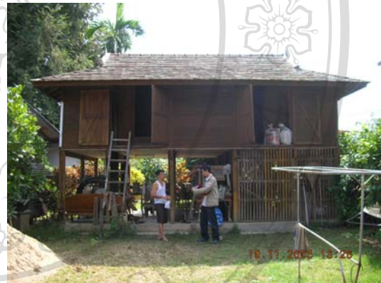
บ้านเลขที่ 12 นายชารี ปัญญาวิโรภาส