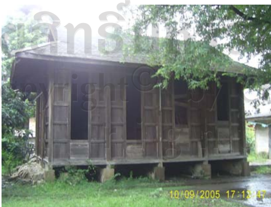
บ้านเลขที่ 17