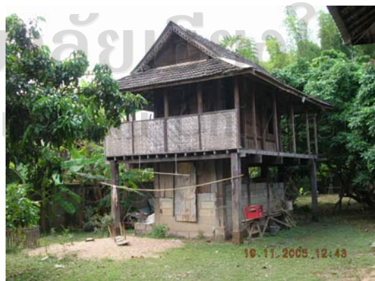
บ้านเลขที่ 18 นายคำ ต้นจ้อย