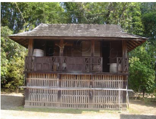
บ้านเลขที่ 11 นายปวน กันทา