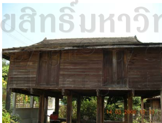
บ้านเลขที่ 29 นายปิ่น ปัญญาหล้า