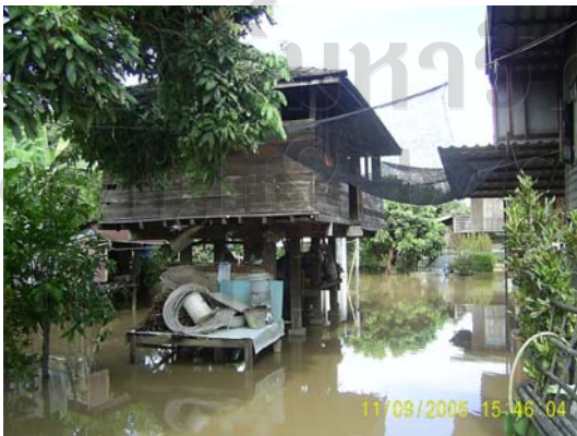
บ้านเลขที่ 76/1 นายสีลา หลี่เป็ง