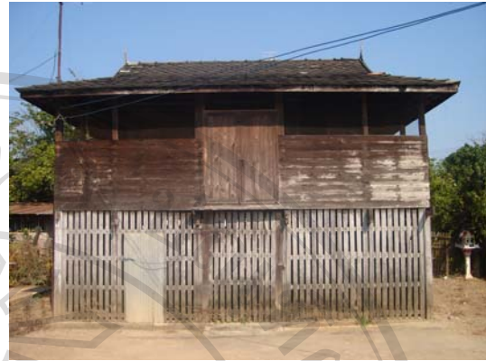
บ้านเลขที่ 90/1 นายประเสริฐ เรือนทิพย์