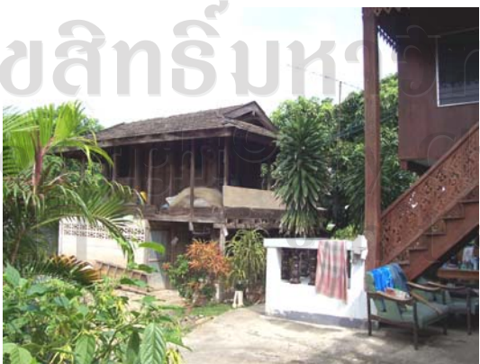
บ้านเลขที่ 38 นายอุ่นเรือน รัตนจันทร์