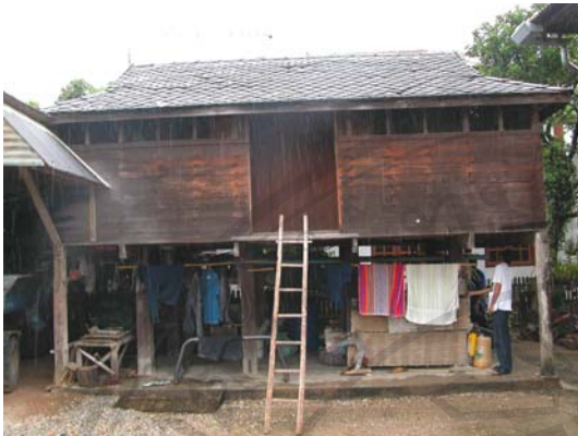
บ้านเลขที่ 15 นายเรื่อน สิทธิเจริญ