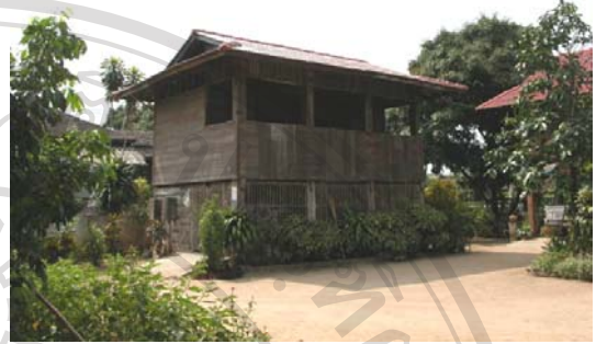
บ้านเลขที่ 44 นายสมบูรณ์ สุนันทะ