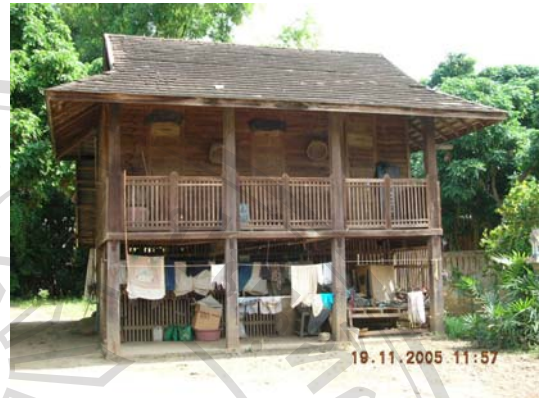
บ้านเลขที่ 26 นายจันทร์ บุระพรหม