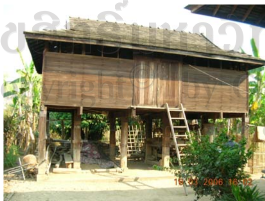
บ้านเลขที่ 59 นายมา บุญเรือง