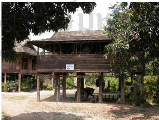
บ้านเลขที่ 21 นายอุ่น วงศ์บุญเรือง