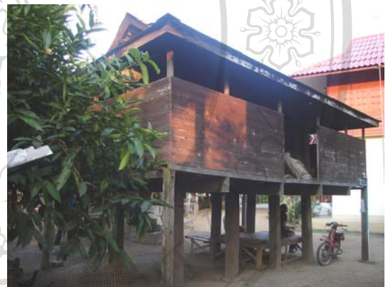
บ้านเลขที่ 69 นายใจ ทานวล