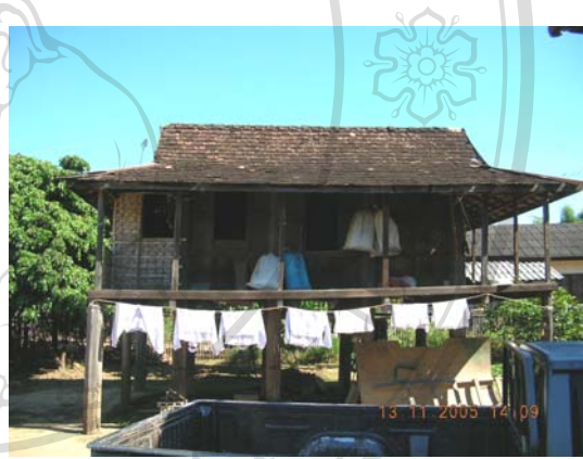
บ้านเลขที่ 38 นายคำ อินตะศรี