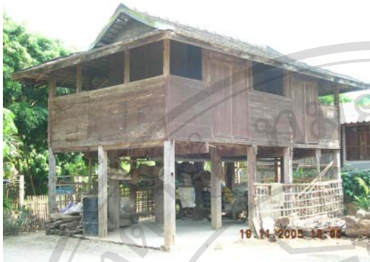
บ้านเลขที่ 13 นายจันทร์ จันทร์ไชย