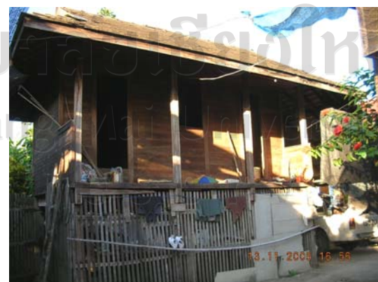
บ้านเลขที่ 28 นายอุทัย สิงห์แก้ว