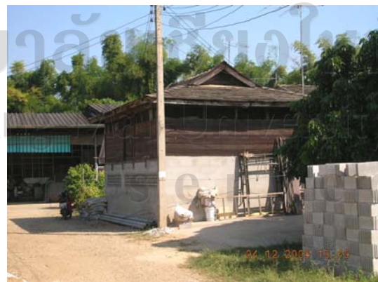
บ้านเลขที่ 73 นางสาวสิงห์ ต้นบู่ระ