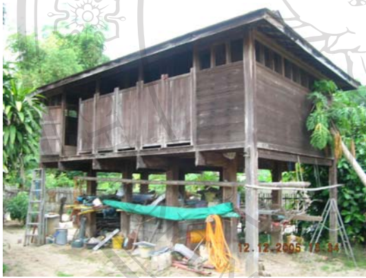
บ้านเลขที่ 42 นายเจริญสุข สมณะ