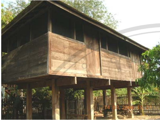
บ้านไม่มีเลขที่ นายโชคศรี สุรินตะ