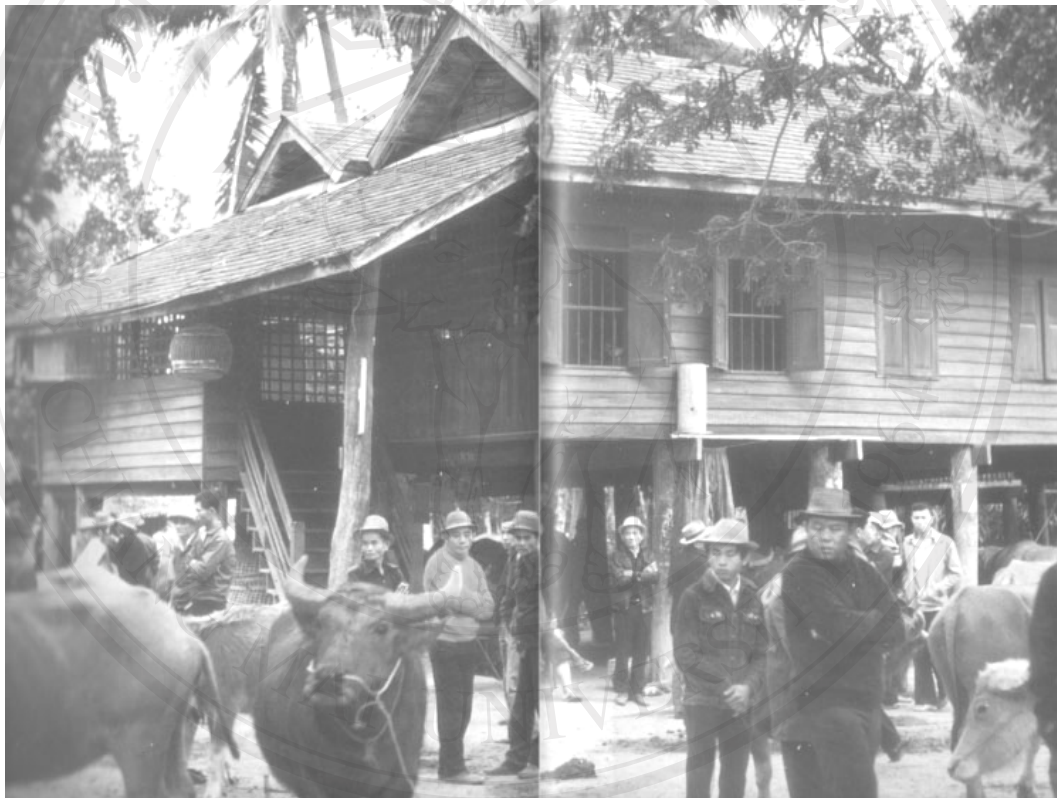
ภาพที่ 1.1 พื้นที่กิจกรรมทางสังคมที่มีอยู่มากมายในชุมชนหมู่บ้านในอดีต (อนุวิทย์ เจริญศุกกุล และ วิวัฒน์ เตมียพันธ์, 2537)

ชุมชนหมู่บ้านจึงช่วยเหลือกัน ซึ่งการช่วยเหลือกันนี้ไม่ได้ช่วยเหลือกันเพียงการแบ่งปันของผู้คนในชุมชนหมู่บ้านอย่างเดียว แต่ยังมีช่วยเหลือกันในการป้องกันระว่างภัยในชุมชนหมู่บ้าน และการช่วยเหลือกันในการอบรมขัดเกลา พฤติกรรมและทัศนคติ ในการอยู่ร่วมกันของผู้คนในชุมชนหมู่บ้านอีกด้วย การช่วยเหลือกันนี้เองที่โยง โยผู้คนที่ทั้งชุมชนหมู่บ้านเข้าด้วยกันจนเกิดเป็นชุมชนหมู่บ้านที่มี “เครือข่ายในการช่วยเหลือกัน” ซึ่งเป็นหัวใจสำคัญอันหนึ่งของการดำรงอยู่ของชุมชนหมู่บ้านของไทยในอดีต