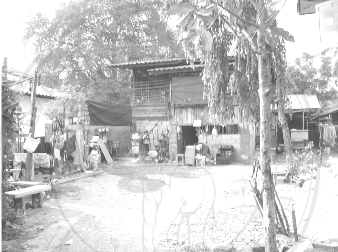
ภาพที่ 1.4 ช่วงเฮือนในชุมชนบ้านเด่นใน

เฮือนเป็นพื้นที่กิจกรรมทางสังคมอยู่ในหลายกลุ่มเครือญาติ (ภาพที่ 1.4) จึงเป็นชุมชนหมู่บ้านหนึ่งที่เหมาะสมในการเป็นหมู่บ้านกรณีศึกษา