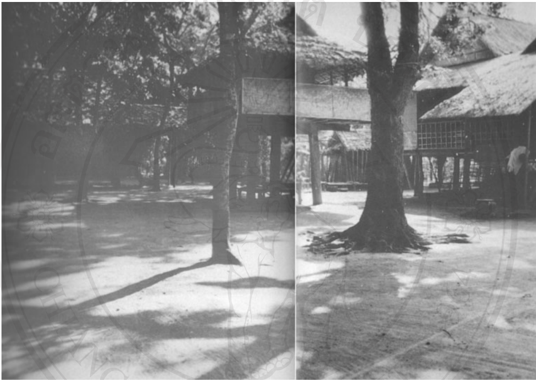
ภาพที่ 1.3 ช่วงเอือนในชุมชนหมู่บ้านในอดีต (อนุวิทย์ เจริญศุกกุล และ วิวัฒน์ เตมียพันธ์, 2537)

ชุมชนหมู่บ้านเพื่อทำความเข้าใจว่าพื้นที่กิจกรรมทางสังคมนั้นมี “คุณลักษณะ” อย่างไรที่ทำให้ผู้คนในชุมชนหมู่บ้านมีความผูกพันกัน ซึ่งคุณลักษณะของพื้นที่กิจกรรมในอดีตนั้นนี้เองที่สามารถนำมาเป็นแนวทางในการพัฒนาปรับปรุงพื้นที่กิจกรรมในหมู่บ้านสมัยใหม่ต่อไป