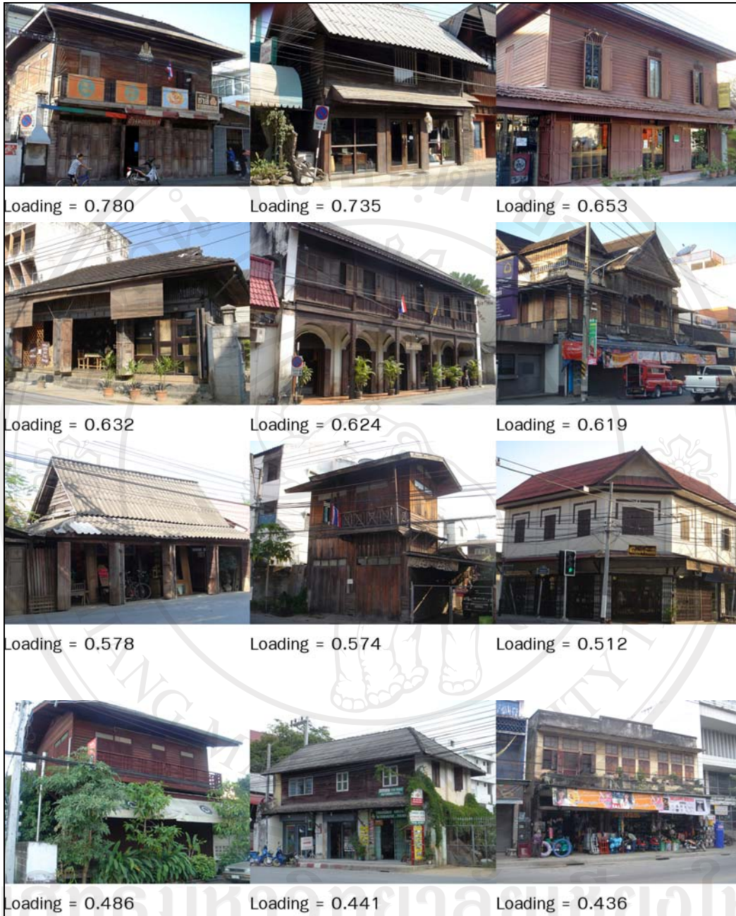
ภาพ 5-2 มิติ 02 บ้านไม้โบราณ

จากตาราง 5-2 จะเห็นว่าภาพในมิติ 02 มีคำบรรยายในหมวดภาพที่ปรากฏ ได้แก่ โบราณ ไม้เป็นระเบียบ ต้นไม้ สายไฟฟ้า และไม้ โดยคำว่าโบราณเป็นคำบรรยายในประเด็นรูปแบบอาคารตามลักษณะอาคารของภาพในมิติที่อาคารที่มีอายุ หรือสร้างมานานแล้ว อีกทั้งรูปแบบอาคารก็เป็นรูปแบบที่เก่าตามอายุที่สร้างจึงแตกต่างจากตึกแถวที่สร้างในปัจจุบันทั้งในเรื่องวัสดุและรูปทรงอย่างชัดเจน คำบรรยายว่าไม่เป็นระเบียบเป็นคำบรรยายในประเด็นการจัดองค์ประกอบตามองค์ประกอบของอาคารในภาพที่มีการตัดแปลง เพิ่มเติมจากการใช้งานมาเป็นเวลานานทำให้เกิด