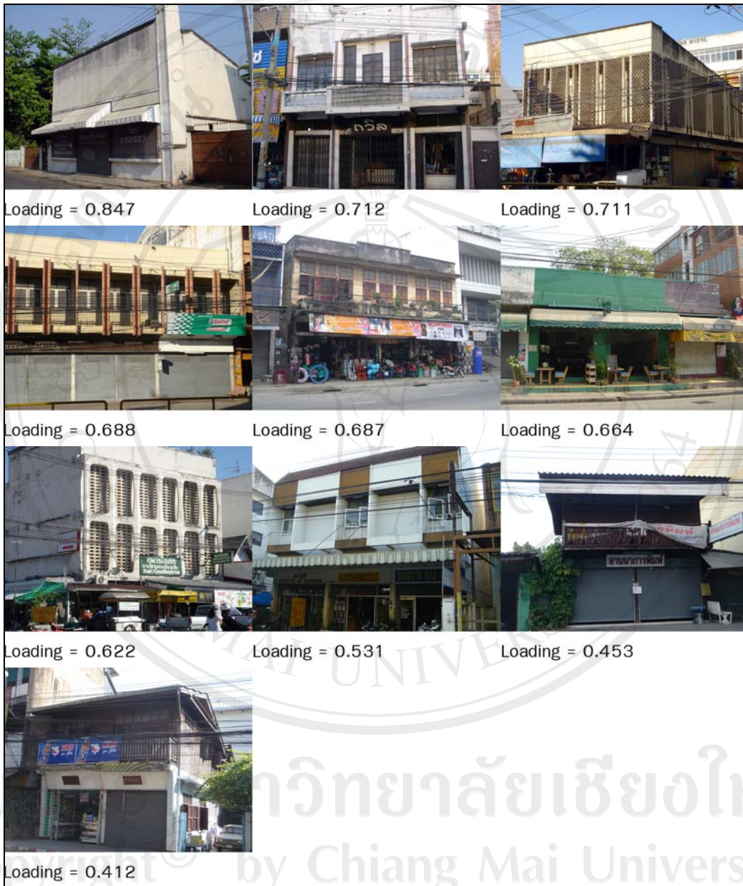
ภาพ 5-3 มิตี 03 ตึกแถวแบบยุคโมเดิร์น

สำหรับมิตี 03 ได้พิจารณาคำบรรยายในการวิเคราะห์เนื้อหาที่มีความถี่ไม่น้อยกว่า 23 และ จัดตามหมวดหมู่ 5 หมวดเช่นเดียวกับการวิเคราะห์ผลในเบื้องต้น โดยหมวดกายภาพที่ปรากฏ (Physical Appearance) ได้มีความถี่ของคำบรรยายสูงสุด หมวดสภาพทางกายภาพ (Physical Condition) มีความถี่ของคำบรรยายรองลงมา หมวดการตัดสินใจความเห็น (Judgment) และ หมวดการ