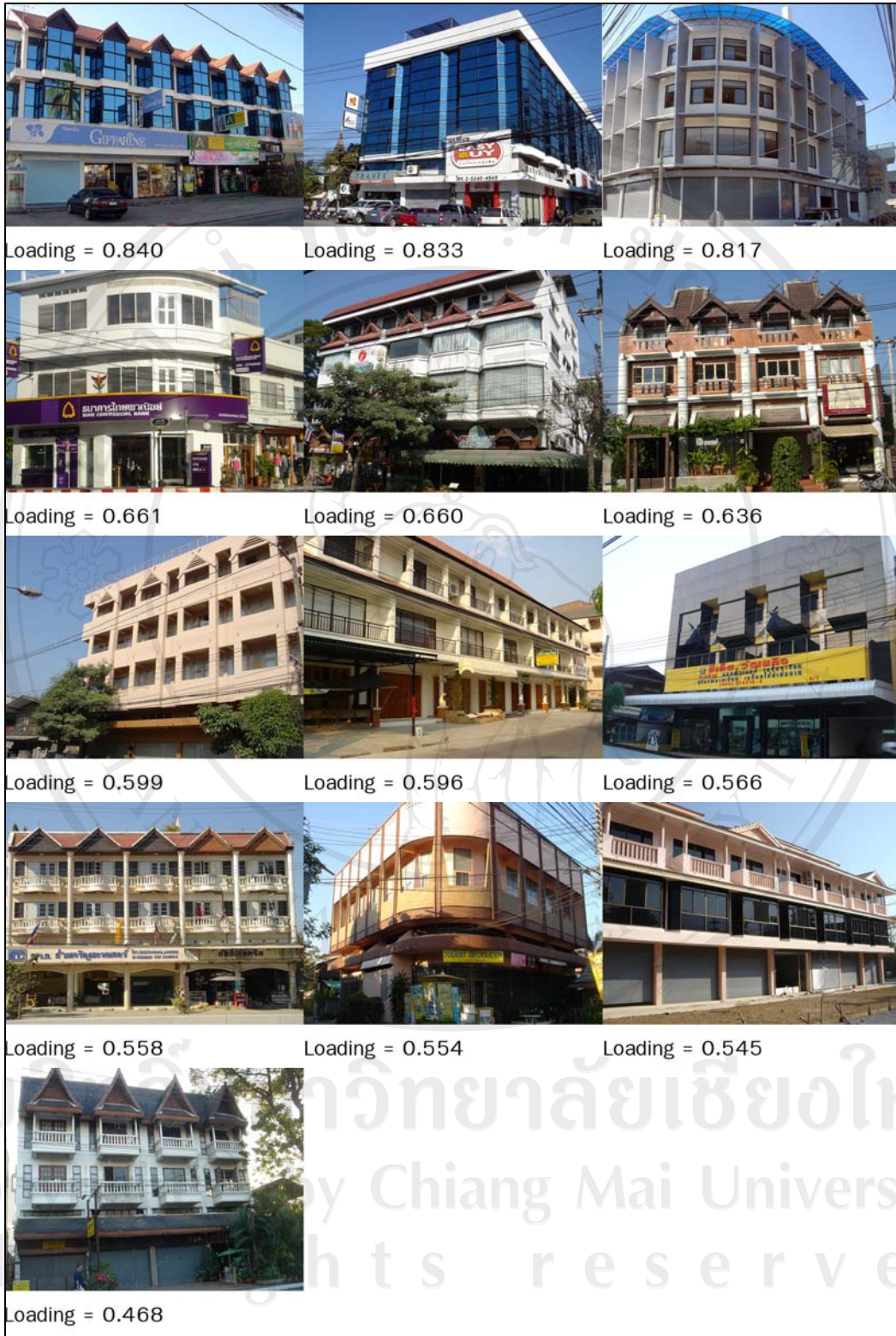
ภาพ 5-1 มิติ 01 ตึกแถวใหม่-ทันสมัย