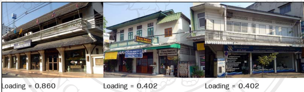
ภาพ 5-7 มิติ 07 ตึกแถวมีระเบียงลูกกรง

ภาพในมิติ 07 ตึกแถวมีลูกกรงระเบียง มีทั้งหมด 3 ภาพ (ภาพ 5-7) และมีลักษณะร่วมของภาพได้แก่ การเป็นอาคาร 2 ชั้น มีการยื่นระเบียงชั้นสองต่อเนื่องเป็นแนวยาวด้านหน้าอาคาร โดยลักษณะระเบียงเป็นแบบมีลูกกรงระเบียงคือไม้ไผ่ระเบียงทึบและยื่นกันสาดได้แนวระเบียงคลุมทางเดินด้านหน้าอาคาร ซึ่งสำหรับลักษณะการยื่นระเบียงชั้นสองที่ต่อเนื่องเป็นแนวยาวนี้เป็นลักษณะที่ใช้กันมากสำหรับอาคารรูปแบบเก่าแบบอาคารเรือนร้านค้าสองชั้น ซึ่งอาจกล่าวได้ว่าเป็นรูปแบบโบราณ