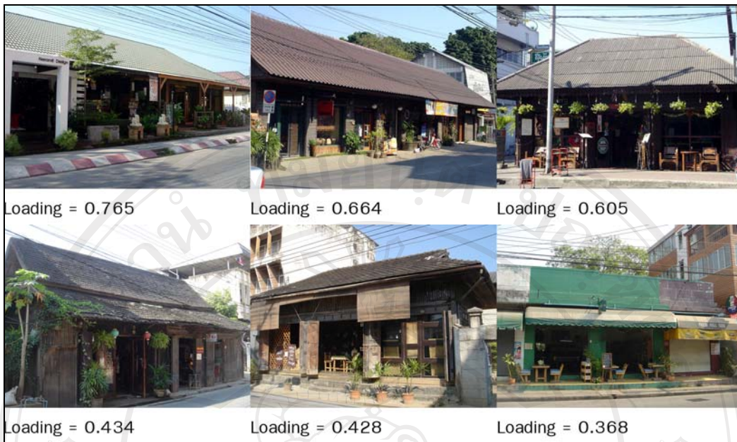
ภาพ 5-4 มิติ 04 ร้านค้าโบราณ

คำบรรยายที่ใช้พิจารณาในการวิเคราะห์เนื้อหาสำหรับมิติ 04 ต้องมีความถี่ไม่น้อยกว่า 14 ครั้ง โดยจัดเป็นหมวดหมู่ 5 หมวดหมู่ เรียงลำดับตามปริมาณความถี่ของคำบรรยายภาพ ดังนี้ หมวดกายภาพที่ปรากฏ (Physical Appearance) หมวดการตัดสินใจความเห็น (Judgment) หมวดบรรยากาศ (Atmosphere) หมวดสภาพทางกายภาพ (Physical Condition) และหมวดการใช้สอย (Function) ดังมีรายละเอียดในตาราง 5-4 การจัดคำบรรยายและความถี่ของคำบรรยายของภาพในมิติ 04 ร้านค้าโบราณ