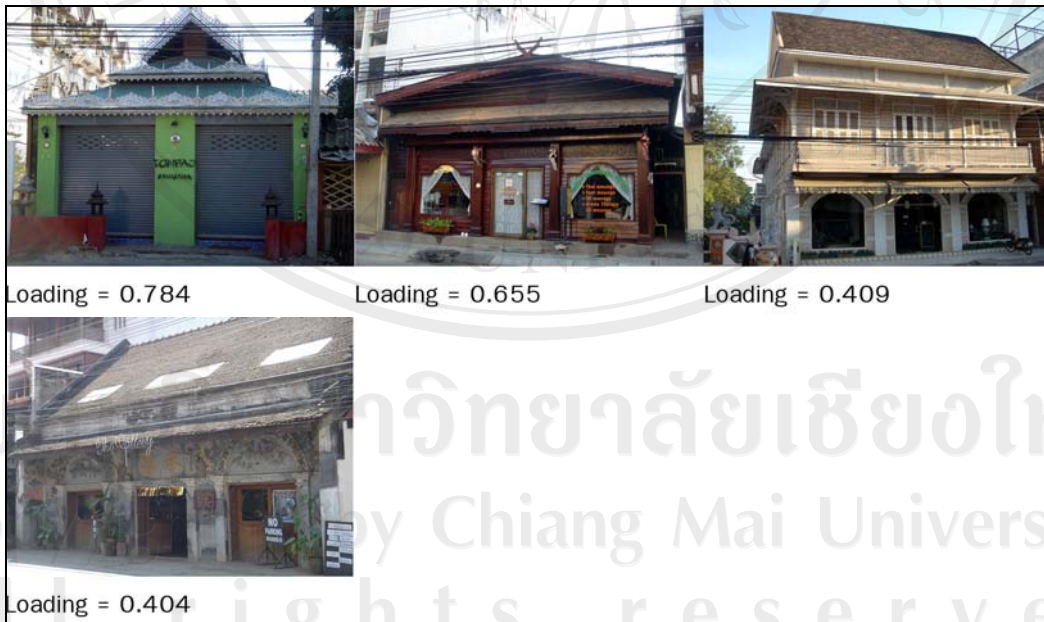
ภาพ 5-5 มิติ 05 ตึกแถวตกแต่งด้วยลายฉลุและลายประดับ

มิติ 05 การตกแต่งด้วยลายฉลุและลายประดับนี้มีจำนวนภาพทั้งหมด 4 ภาพ (ภาพ 5-5) เมื่อพิจารณาลักษณะร่วมของอาคารภายในภาพทั้ง 4 ภาพประกอบกับค่า Factor Loading ของแต่ละภาพ ก็พอจะกล่าวได้ว่า ประชาชนรับรู้ภาพในมิตินี้ว่าเป็นการประดับประดาตกแต่งด้านหน้าและขอบหลังคาอาคาร เช่น เชนงชาย ปั้นลม ด้วยลวดลายทั้งที่เป็นลายฉลุและลายปูนปั้นประดับ และการใช้หลังคาทรงจั่วหรือปั้นหย้า