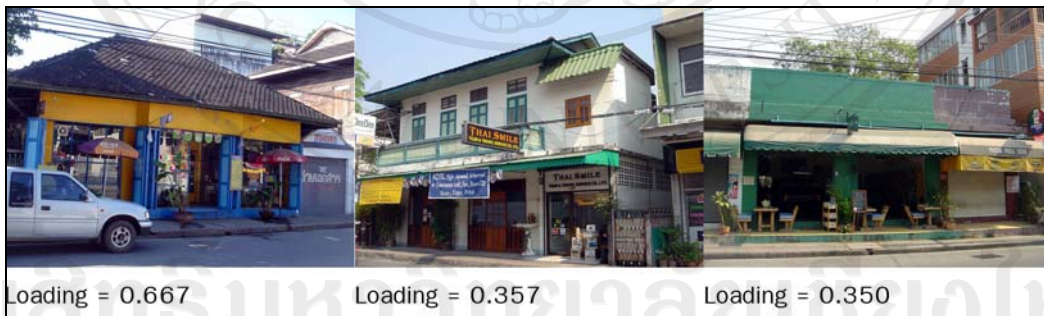
ภาพ 5-8 มิตินี้ 08 ตึกแถวสีส้มสะอาดตา

ภาพในมิตินี้ 08 มีจำนวนทั้งหมด 3 ภาพ (ภาพ 5-8) และมีลักษณะทางกายภาพร่วมกันได้แก่ การใช้สีส้มที่ค่อนข้างที่มีการตัดกันของสีมาก ได้แก่ สีเหลืองสดกับสีฟ้าสดในภาพแรก สีเขียวกับสีขาวในภาพที่สอง และสีเขียวกับสีม่วงคล้ำในภาพที่สาม ตามลำดับของภาพในมิตินี้ ทำให้ดูโดดเด่น