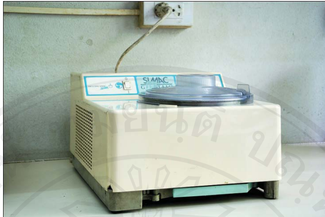
ภาพผนวก ก.11 เครื่องปั่นไอศกรีม