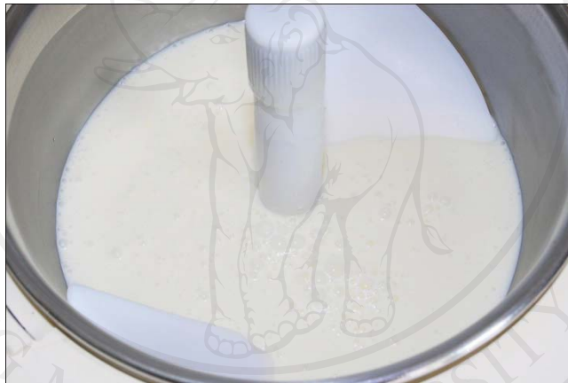
ภาพผนวก ก.12 ไอศกรีมที่ผ่านการบ่มที่อุณหภูมิ 4 องศาเซลเซียส เป็นเวลา 24 ชั่วโมง