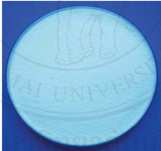
ภาพผนวก ก.7 เส้นใยอาหารผงจากเปลือกในส้มโอที่ผลิตได้