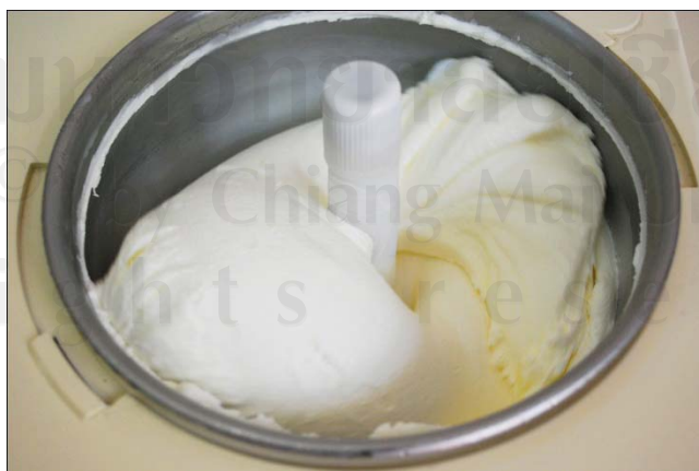
ภาพผนวก ก.13 ไอศกรีมที่ได้หลังการปั่นเป็นเวลา 40 นาที