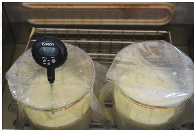
ภาพผนวก ก.10 ขั้นตอนการพาสเจอร์ไรซ์ส่วนผสมไอศกรีม