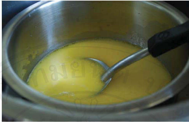
ภาพผนวก ก.8 ส่วนผสมไอศกรีม (ice cream mix)