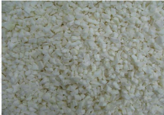
ภาพผนวก ก.3 เปลือกในส้มโอที่หั่นให้มีขนาด 1x1x1 ตารางเซนติเมตร