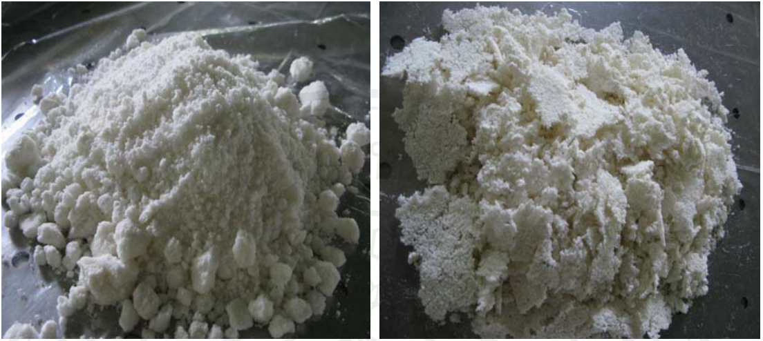
ภาพผนวก ก.6 (ซ้าย) เปลือกในส้มโอหลังแช่ในสารละลายเอทานอล (ก่อนอบแห้ง) (ขวา) เปลือกในส้มโอหลังอบแห้ง