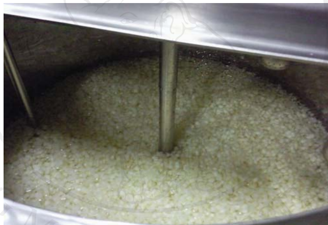
ภาพผนวก ก.4 การลดความขมจากเปลือกในส้มโอ