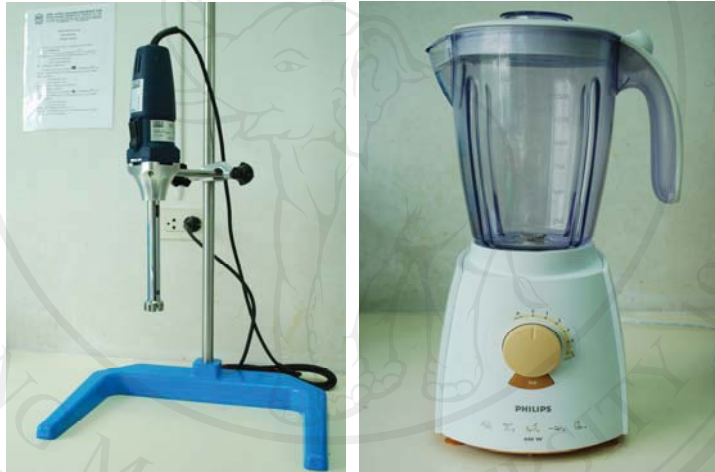
ภาพผนวก ก.9 (ซ้าย) เครื่องโฮโมจิไนซ์ (homogenizer) (ขวา) เครื่องปั่นผสมอาหาร (blender)