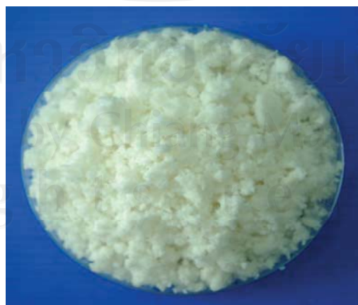
ภาพผนวก ก.5 เปลือกในส้มโอหลังผ่านการบดเปียก