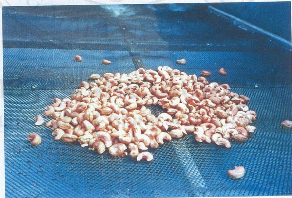
ลักษณะของเมล็ดมะม่วงหิมพานต์ที่กะเทาะเปลือกแล้ว นำมาตากแห้ง 3-5 แดด