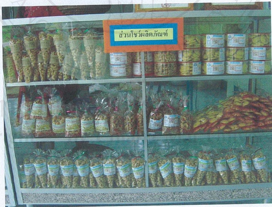
ผลผลิตพัฒนาแปรรูปเมล็ดมะม่วงหิมพานต์ของกลุ่มแปรรูปเมล็ดมะม่วงหิมพานต์ตำบลหาดลำ