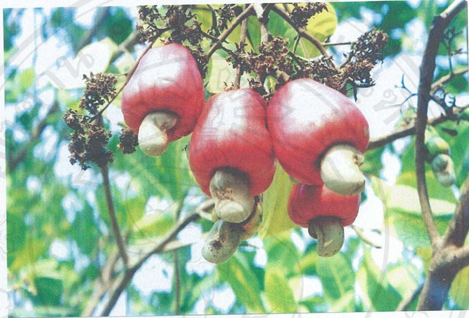
ลักษณะผลและเมล็ดของมะม่วงหิมพานต์