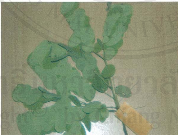
รูปที่ 29 ชุมเห็ดไทย

ส่วนของพืชที่โคกินเป็นอาหาร: ทุกส่วนทั้งต้น