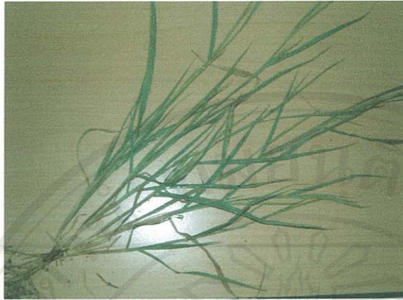
รูปที่ 10 หญ้าโจย่ง

ชื่อวิทยาศาสตร์: Rottboellia cochinchinensis (Lour.) clayton