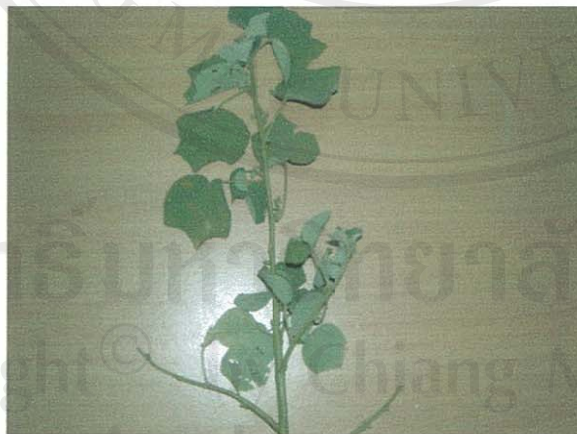
รูปที่ 31 มะก๋อข้าว

ชื่อวิทยาศาสตร์: Abutilon indicum (L.) G. Don.