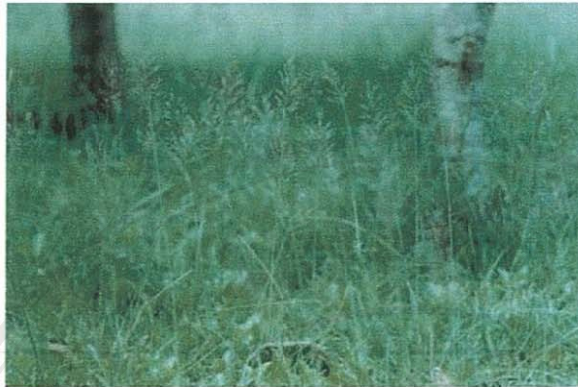
รูปที่ 8 หญ้าเจ้าชู้

ชื่อวิทยาศาสตร์: Chrysopogon aciculatus (Retz.) Trin.