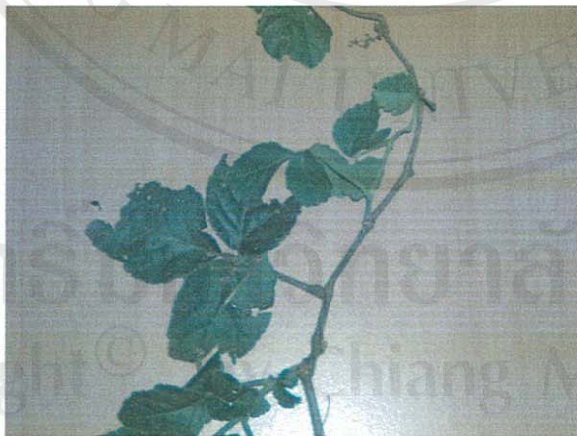
รูปที่ 39 เครือพัดสาม

ชื่อวิทยาศาสตร์: Cayratia trifolia (L.) Domin.