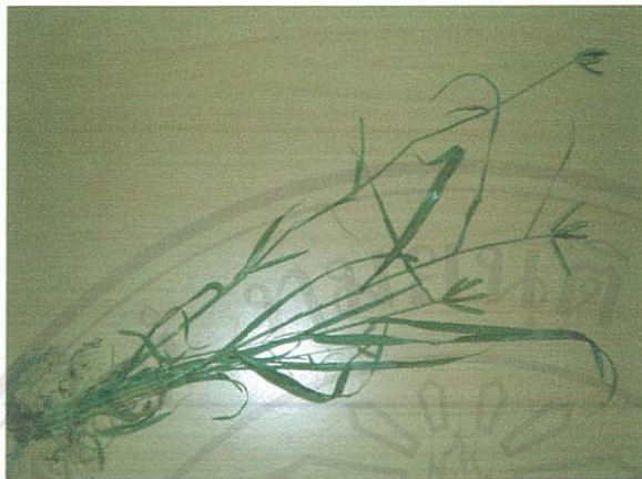
รูปที่ 6 หญ้าปากควาย

ชื่อวิทยาศาสตร์: Axonopus compressus (Sw.) Beauv.