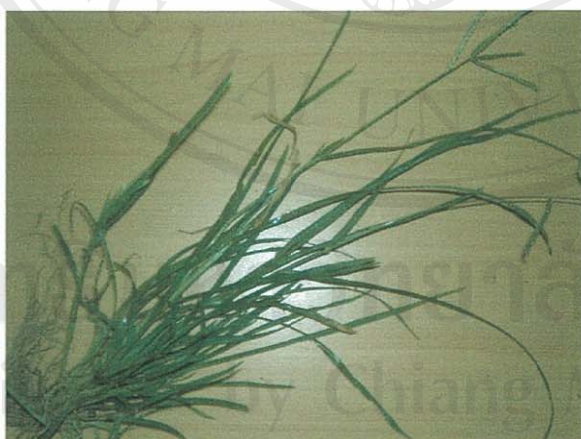
รูปที่ 5 หญ้าตีนกา

ส่วนของพืชที่โคกินเป็นอาหาร: ทุกส่วนทั้งต้น