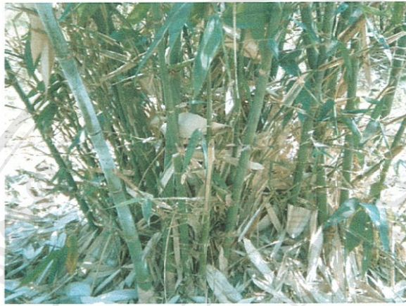
รูปที่ 2 ไผ่บง