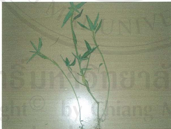
รูปที่ 21 หุ้ยยาง

ส่วนของพืชที่โคกินเป็นอาหาร: ผลแห้ง และใบ