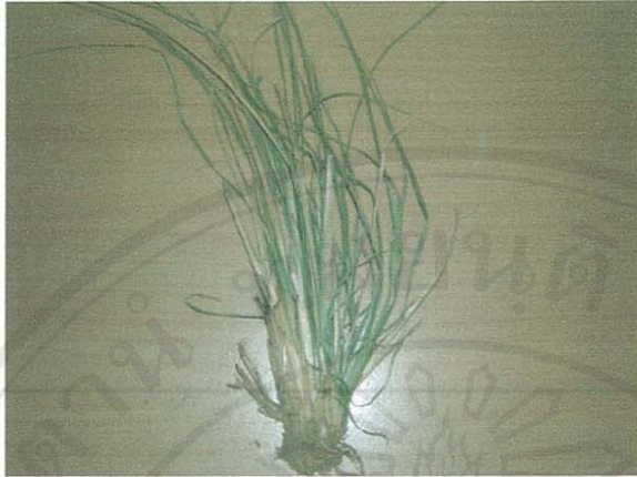
รูปที่ 28 หญ้ารัตเขียด

ชื่อวิทยาศาสตร์: Fimbristylis miliacea (L.) Vahl.