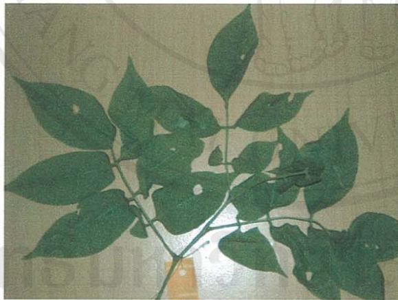
รูปที่ 17 จักจั่น

ชื่อวิทยาศาสตร์: Millettia xylocappa Mig.