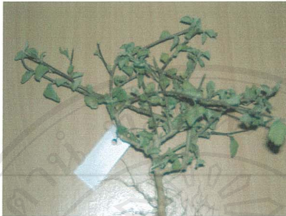
รูปที่ 32 หล้าขัดใบยาว

ชื่อวิทยาศาสตร์: Sida rhombifolia L. ssp. rhombifolia .