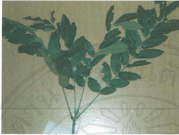
รูปที่ 16 กระพี้เขาควาย

ชื่อวิทยาศาสตร์: Dalbergia cultrata graham ex bth.