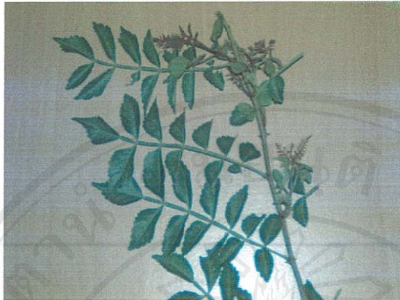
รูปที่ 38 คนทา

ชื่อวิทยาศาสตร์: Harrisonia perforata (Blanco) Merr.