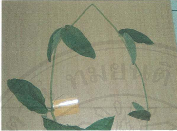
รูปที่ 34 หญ้าตดหมา

ชื่อวิทยาศาสตร์: Paederia pilifera Hook. f.