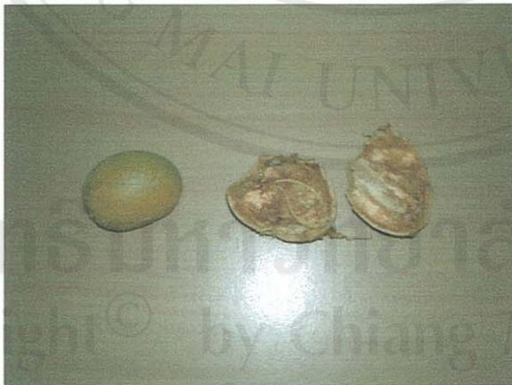
รูปที่ 37 มะตูม

ชื่อวิทยาศาสตร์: Aegle marmelos (L.) Corr.