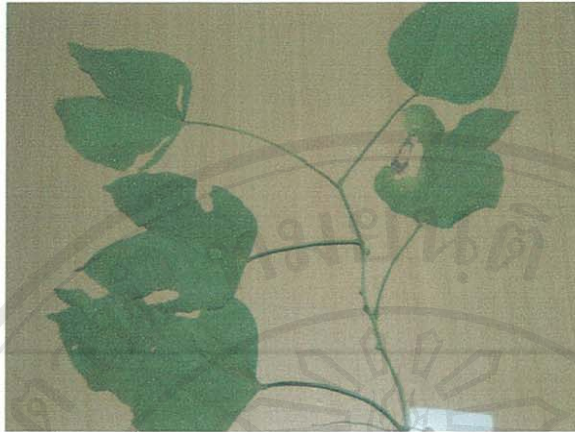
รูปที่ 30 เสี้ยวดอกขาว