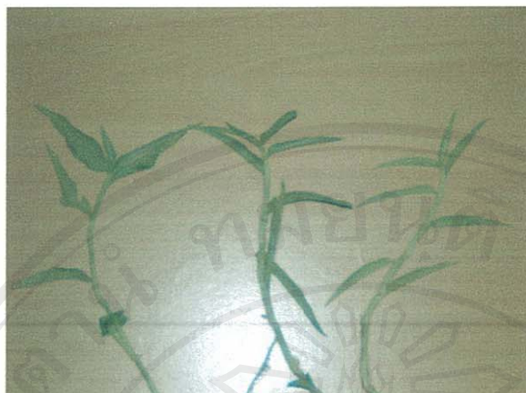
รูปที่ 26 ผักปลาบใบแคบ

ชื่อวิทยาศาสตร์: Commelina diffusa Burm. f.