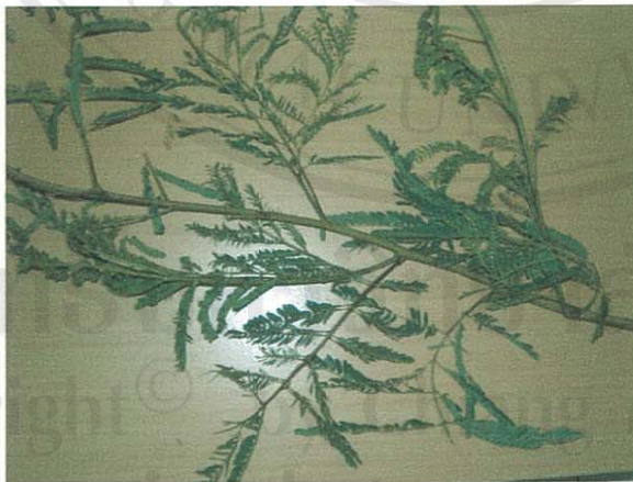
รูปที่ 13 กระถิน

ส่วนของพืชที่โคกินเป็นอาหาร: ทุกส่วนทั้งต้น