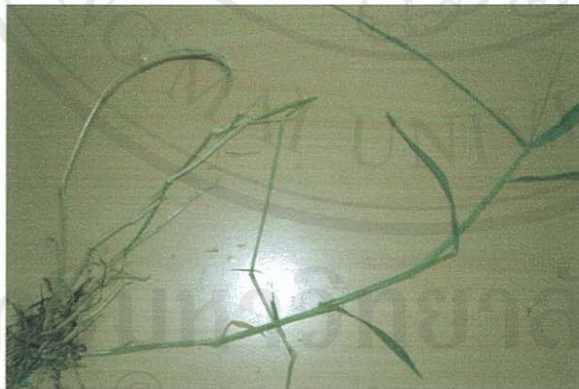
รูปที่ 9 หญ้าขน

ส่วนของพืชที่โคกินเป็นอาหาร: ทุกส่วนทั้งต้น