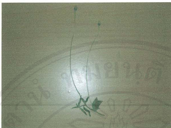
รูปที่ 22 ตีนตุ๊กแก