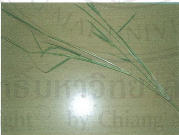
รูปที่ 7 หญ้าไซ

ส่วนของพืชที่โคกินเป็นอาหาร: ทุกส่วนทั้งต้น