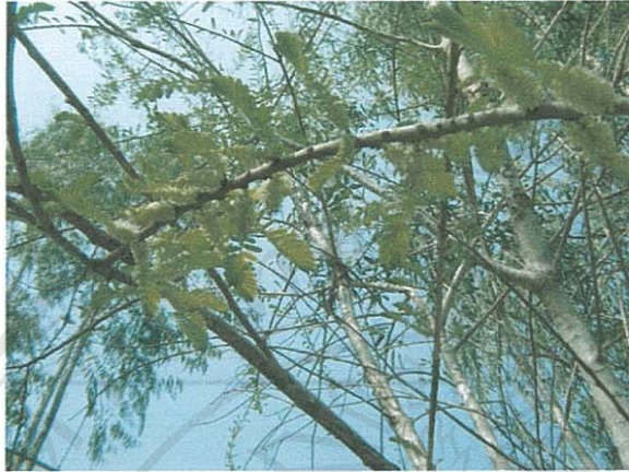
รูปที่ 20 มะขามป้อม