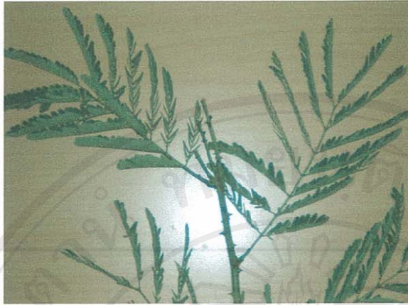
รูปที่ 14 ส้มป่อย

ชื่อวิทยาศาสตร์: Acacia concinna (Willd.) Dc.