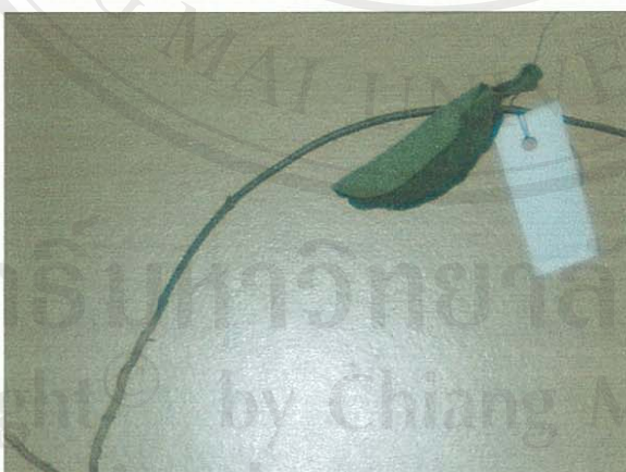
รูปที่ 23 เถาประสังข์

ส่วนของพืชที่โคกินเป็นอาหาร: ทุกส่วนทั้งต้น