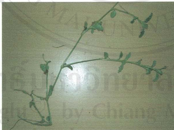
รูปที่ 25 ผักปลาบใบกว้าง

ชื่อวิทยาศาสตร์: Commelina benghalensis L.