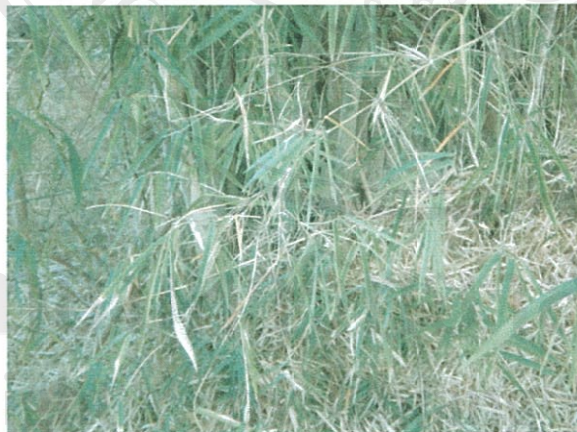
รูปที่ 3 ไผ่รวก

ส่วนของพืชที่โคกกินเป็นอาหาร: หน่อไม้ และใบอ่อน