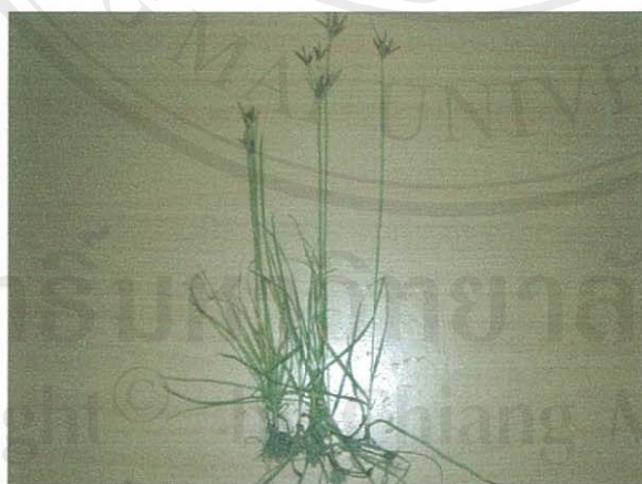
รูปที่ 27 หญ้าเหี่ยวหมู

ส่วนของพืชที่โคกินเป็นอาหาร: ทุกส่วนทั้งต้น