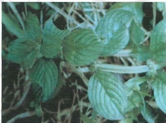
รูปที่ 33 กระดุมใบใหญ่

ส่วนของพืชที่โคกินเป็นอาหาร: ทุกส่วนทั้งต้น