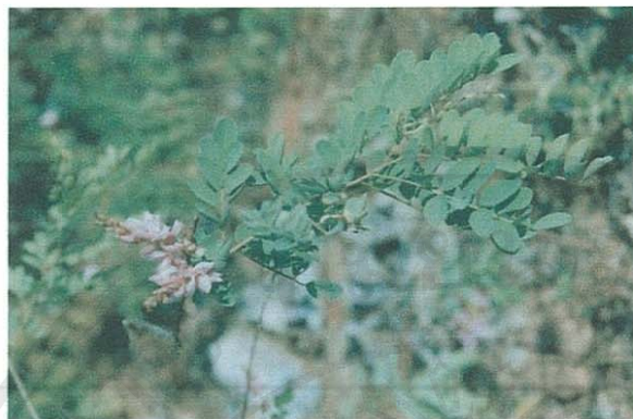
รูปที่ 18 ครามป่า

ชื่อวิทยาศาสตร์: Tephrosia purpurea (L.) Pers. ssp. purpurea .