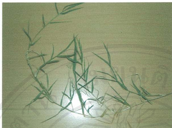
รูปที่ 4 หญ้าแพรก

ชื่อวิทยาศาสตร์: Cynodon dactylon (L.) Pers.