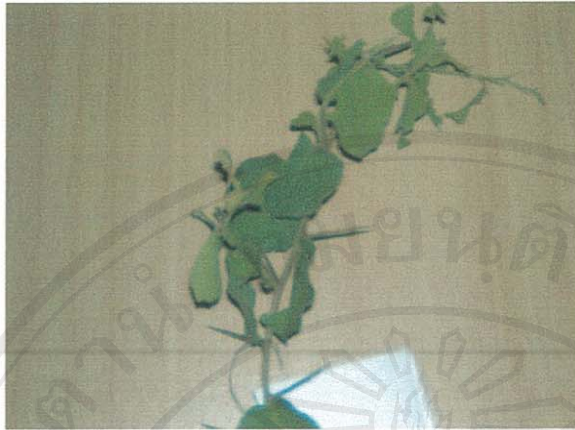
รูปที่ 36 ตะขบป่า

ชื่อวิทยาศาสตร์: Flacourtia indica (Burm. f.) Merr.