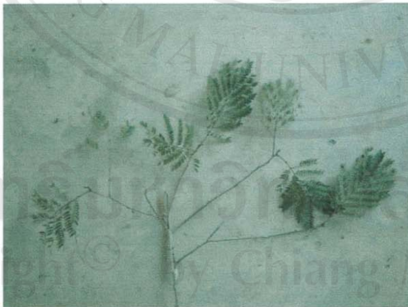
รูปที่ 15 กระถินเทศ

ส่วนของพืชที่โคกินเป็นอาหาร: ยอดอ่อน ผล และใบ