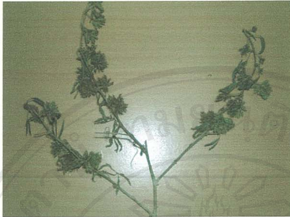
รูปที่ 12 ไมยราบต้น