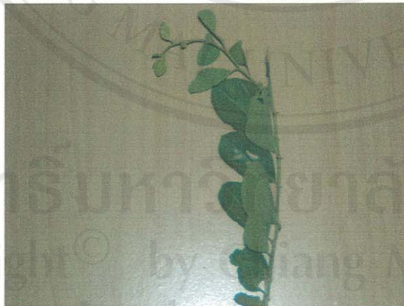
รูปที่ 35 หนามวัวซัง