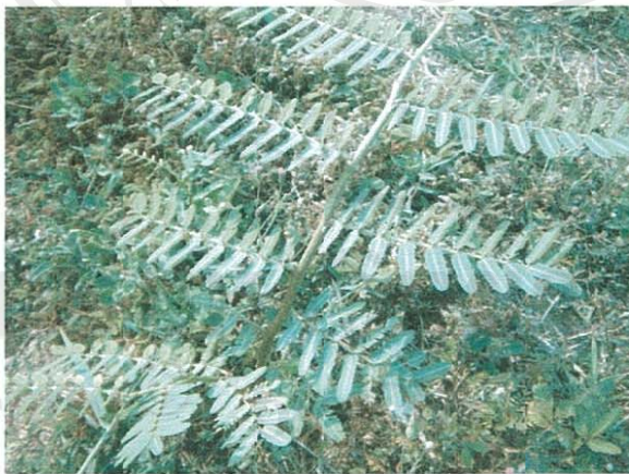
รูปที่ 11 ไมยราบยักษ์

ส่วนของพืชที่โคกินเป็นอาหาร: ทุกส่วนทั้งต้น