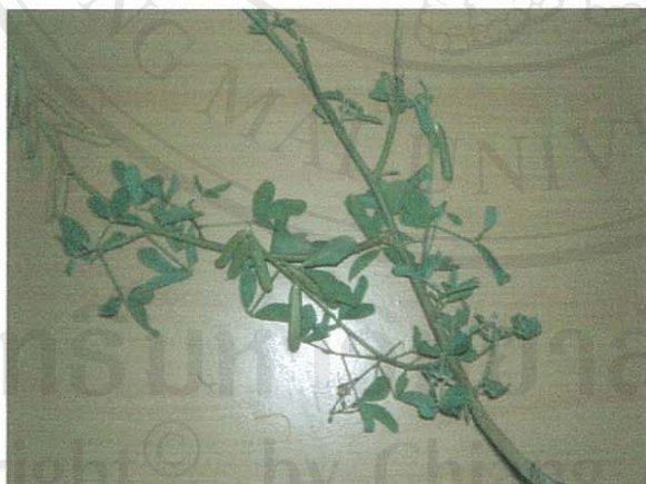
รูปที่ 19 หิ่งเม่น

ชื่อวิทยาศาสตร์: Crotalaria pallida Aiton.