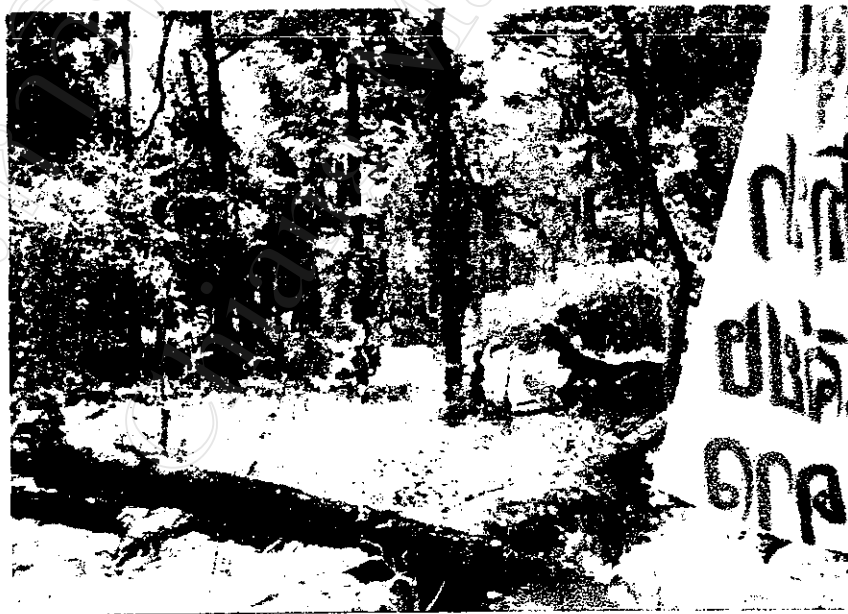
การบวชป่าชุมชนบ้านหัวทุ่ง ต.เขียงคาว อ.เขียงคาว จ.เชียงใหม่