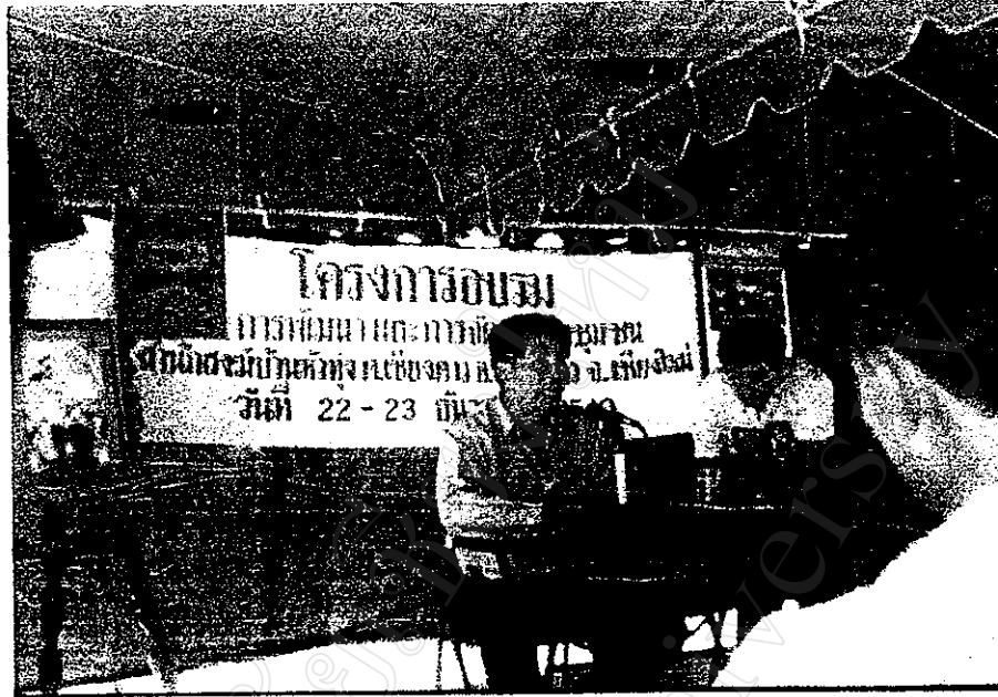
การจัดฝึกอบรมด้านการจัดการป่าชุมชน