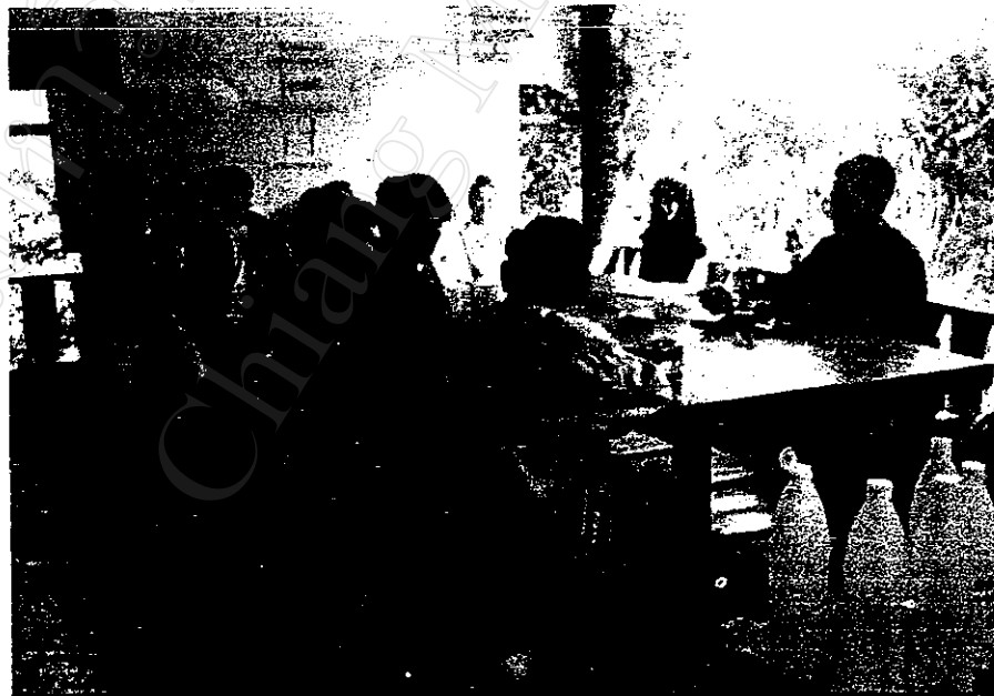
สัมภาษณ์สมาชิกองค์การบริหารส่วนตำบล เรื่องการจัดการป่าชุมชน