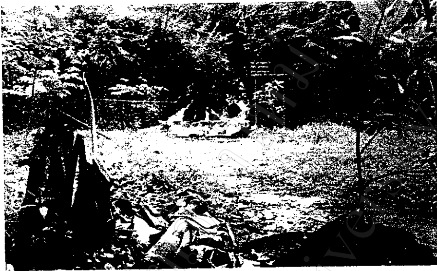
สภาพความอุดมสมบูรณ์ของป่าชุมชนบ้านหัวทุ่ง ต.เชียงดาว อ.เชียงดาว จ.เชียงใหม่