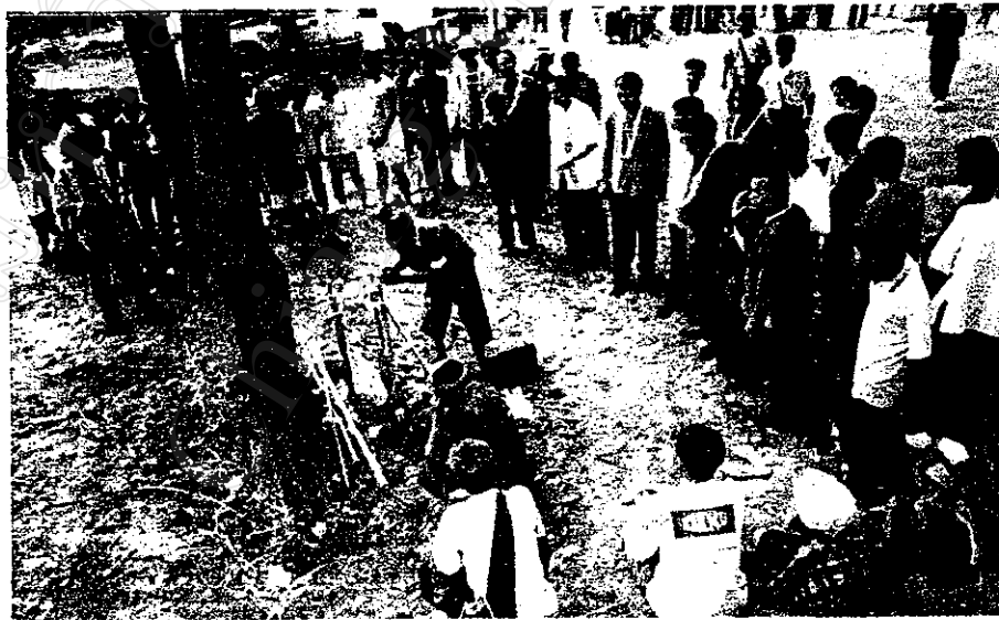
การประกอบพิธีกรรมของชาวปะหล่อง