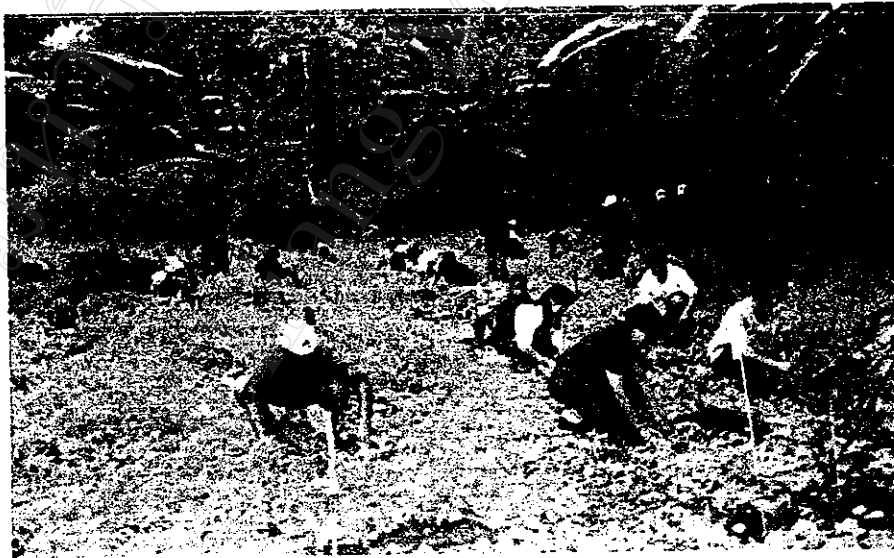
กิจกรรมส่งเสริมรณรงค์การปลูกป่าให้แก่ประชาชน