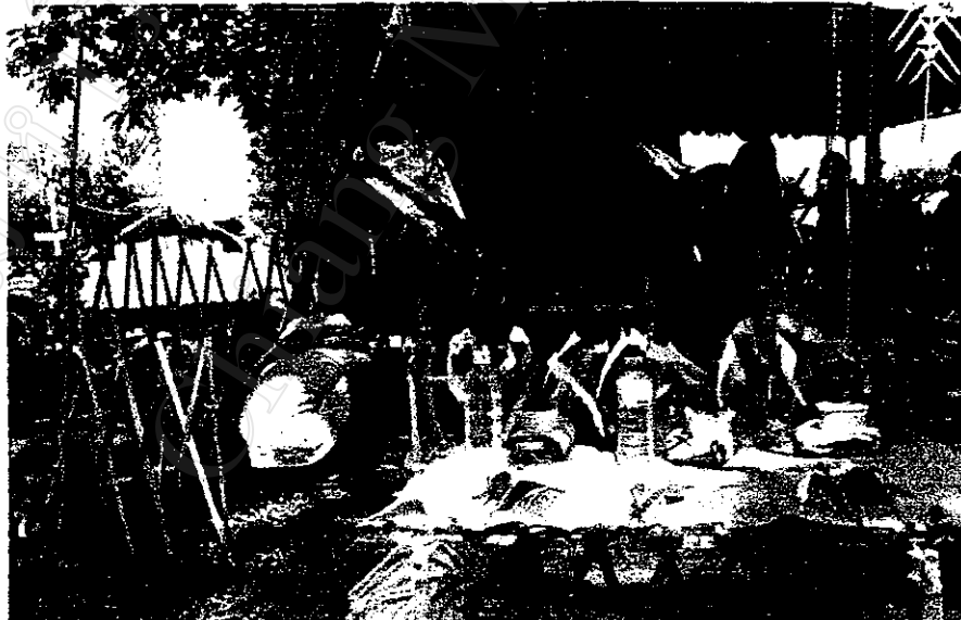
พิธีกรรม "มอเลว" ของชาวปะหล่อง