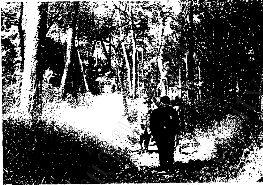
คณะกรรมการป่าชุมชนเดินสำรวจป่า