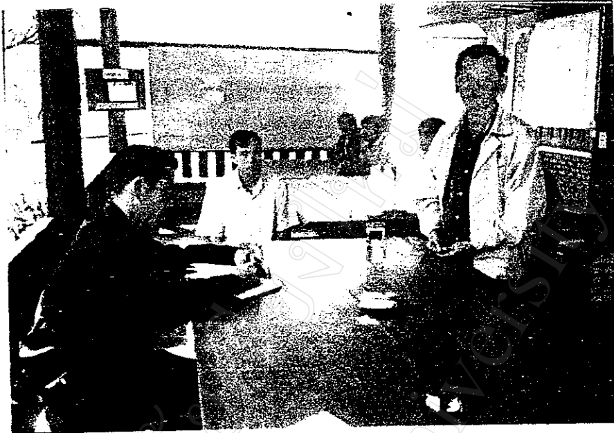
การพูดคุยแลกเปลี่ยนความคิดเห็นเกี่ยวกับการจัดการป่าชุมชน ระหว่างคณะกรรมการป่าชุมชนและสมาชิกองค์การบริหารส่วนตำบล