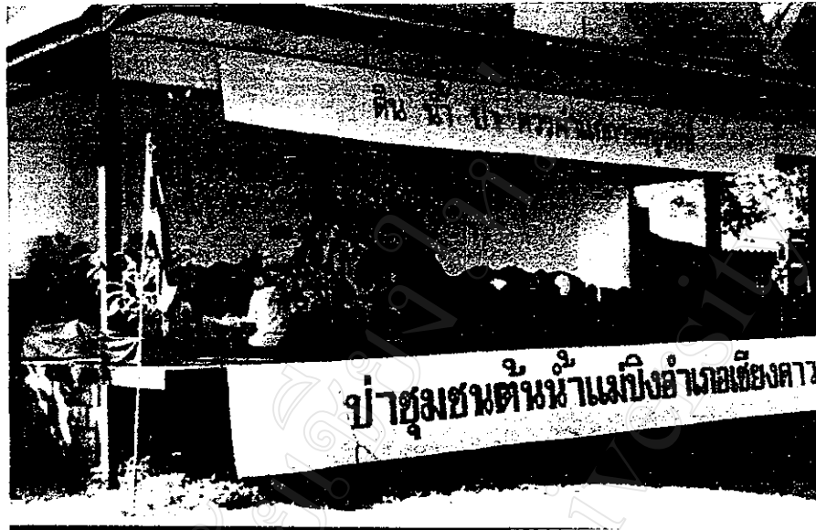
กิจกรรมของเครือข่ายป่าชุมชนอำเภอเชียงดาว