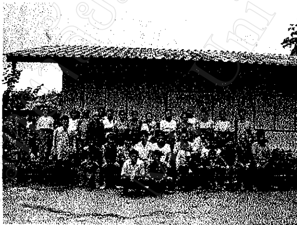
เกษตรกรชาวเขาเผ่ามูเซอตำดอยปู่หมื่นใน