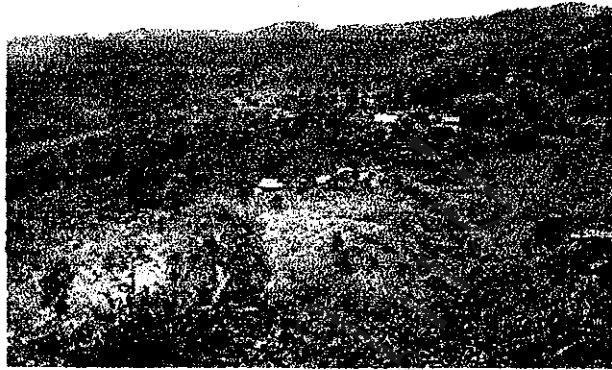
สภาพพื้นที่การเกษตรและหมู่บ้านชาวเขาเผ่ามูเซอตำดอยปู่หมื่น