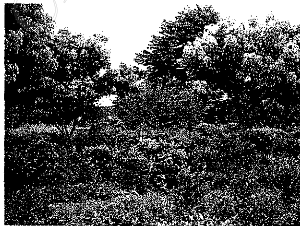
สภาพการปลูกพืชแบบสวนผสม (ชา, บัว, ลิ้นจี่)