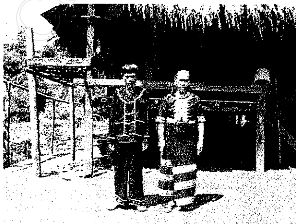
ลักษณะการแต่งกายของชาวเขาเผ่ามูเซอตำดอยปู่หมื่นใน