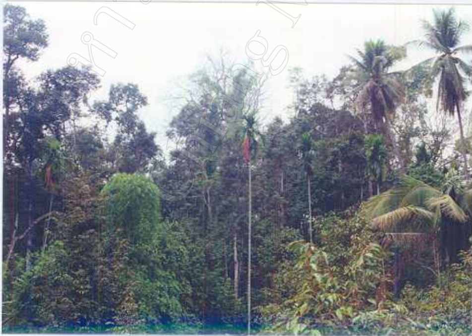
ภาพ 8 : เวื่อนยอดของพันธุ์ไม้