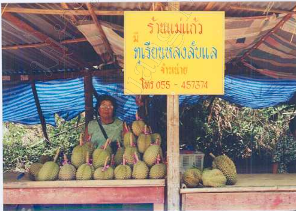
ภาพ 12 : การจำหน่ายทุเรียนพื้นเมืองพันธุ์หลงลับแล