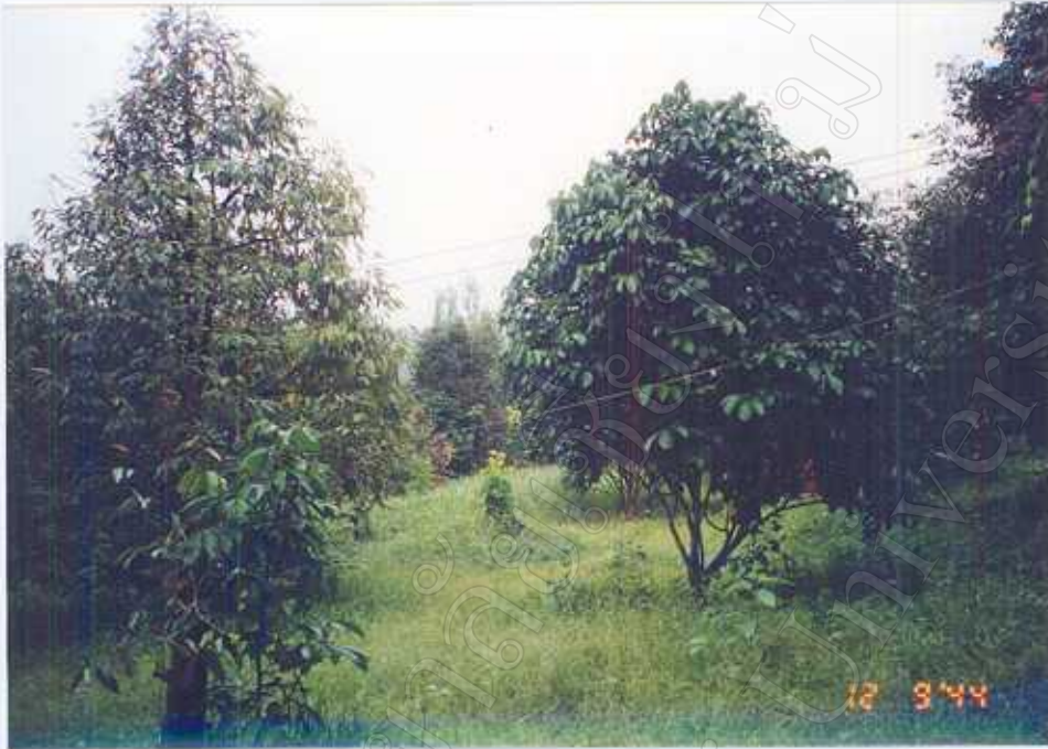
ภาพ 1 : สภาพสวนที่เป็นแบบเกษตรผสมผสาน