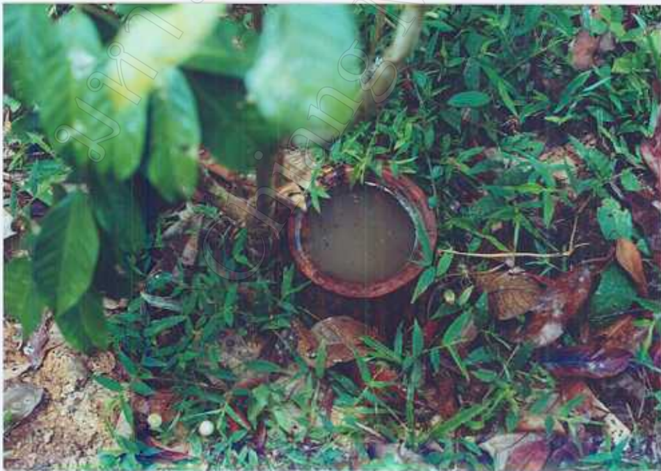
ภาพ 4 : วิธีการให้น้ำ