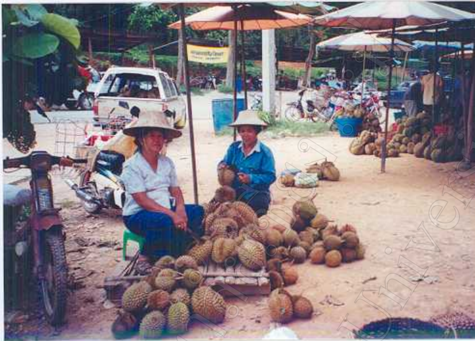
ภาพ 11 : จำหน่ายผลผลิต โดยเกษตรกร