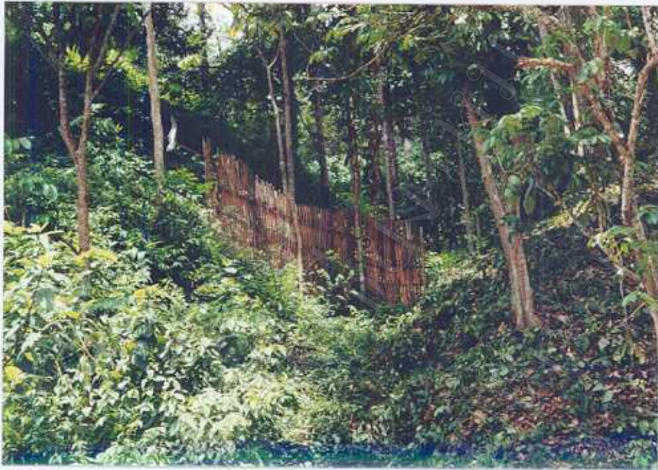
ภาพ 3 : แนวป้องกันไม่ให้ผลทุเรียนร่วงร่อนเขา(ใช้ไม้ไผ่สาน)