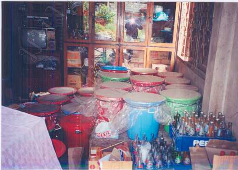
ภาพ 14 : การเก็บรักษาทุเรียนกวน