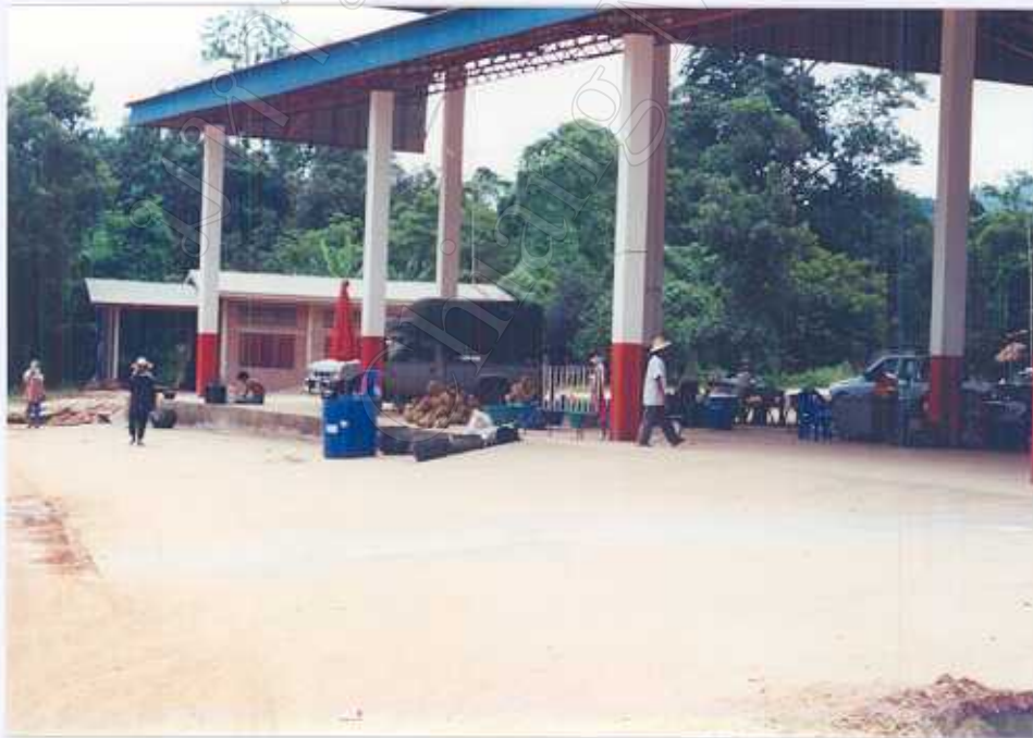
ภาพ 10 : ตลาดกลางสินค้าเกษตร(บริเวณที่ทำการเทศบาลหัวดง)