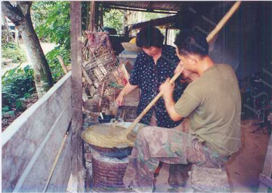
ภาพ 13 : การกวนทุเรียน