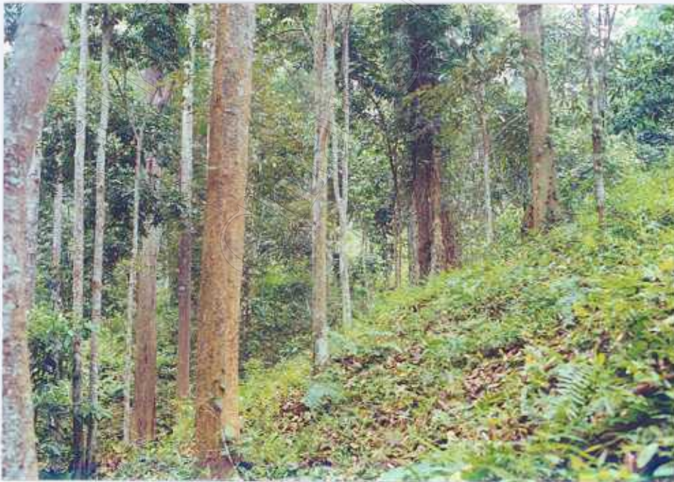
ภาพ 2 : สวนทุเรียน - ถางป่า - ป่าไม้(วนเกษตร)