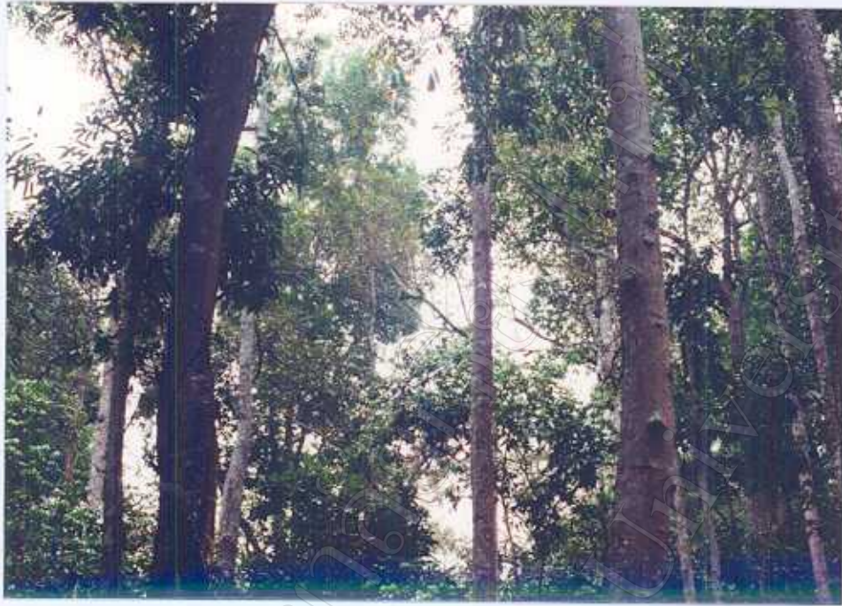
ภาพ 7 : ความร่มรื่นภายในสวน