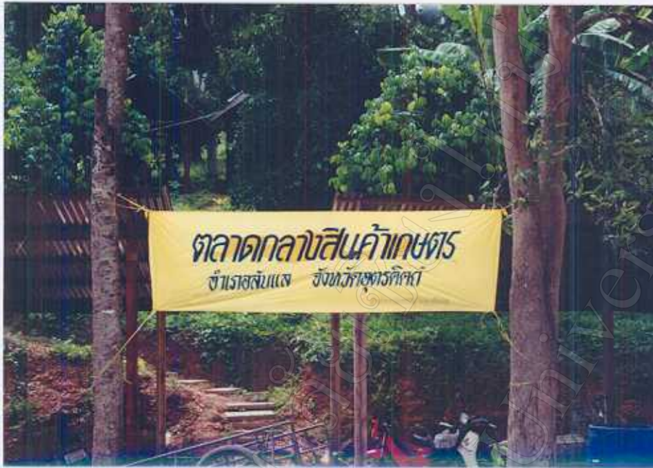
ภาพ 9 : ตลาดกลางสินค้าเกษตร