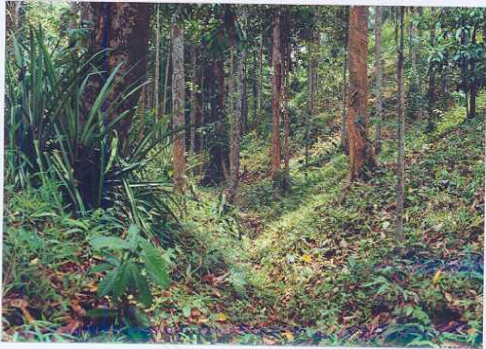
ภาพ 5 : ร่องเขาแบ่งเขตแนวสวน