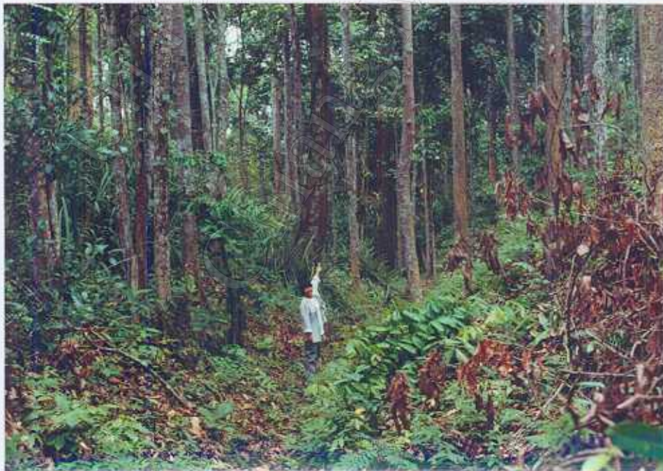
ภาพ 6 : เข้าของสวนชี้เขตแนวสวน