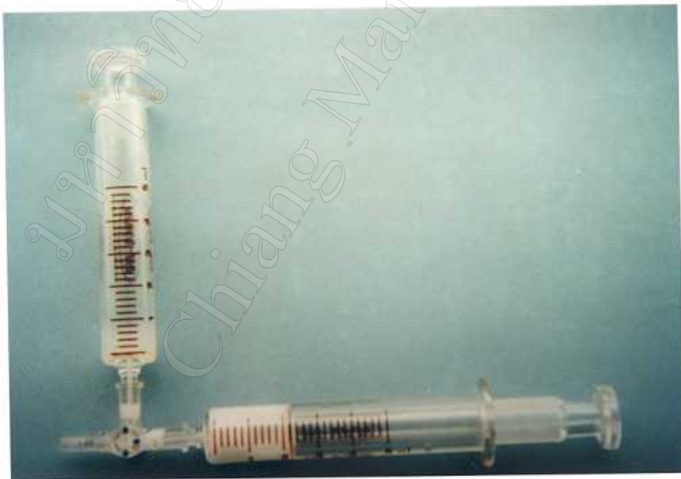
ภาพที่ 7. แสดงการต่อระหว่าง 3 ทางกับ กระบอกลูกศรเพื่อโฮโมจีไนซ์ (homogenize) ระหว่าง FCA กับแอนติเจน.

ละลาย E2-6-CMO-HSA 500 ไมโครกรัม ในสารละลายพีบีเอส 250 ไมโครลิตร ผสมรวมกับ FCA 250 ไมโครลิตร ใส่สารทั้งหมดลงในกระบอกลูกศรที่ต่อกับ 3 ทาง (3-way stopcock) และกระบอกลูกศรอีกอันหนึ่ง หลังจากนั้นดันกระบอกลูกศรไปกลับประมาณ 50 ครั้ง จนได้สารละลายสีขาวขุ่น แล้วจึงนำไปฉีดในกระต่ายพันธุ์แคลifornian ตัวละ 500 ไมโครลิตร จำนวน 3 ตัว โดยฉีดเข้าใต้ผิวหนัง บริเวณกลางหลัง ทุกๆ 2 สัปดาห์ จากนั้นทำการเก็บตัวอย่างเลือดกระต่ายตัวละ 10 มล. นำมาปั่นแยกได้พลาสมา (โพลีโคลนอลแอนติบอดี) เก็บไว้ที่ -20^{\circ}\text{C} นำพลาสมาส่วนหนึ่งไปตรวจระดับโคเลอรัคโฮริโมนอีสตราไดออล โดยวิธี RIA