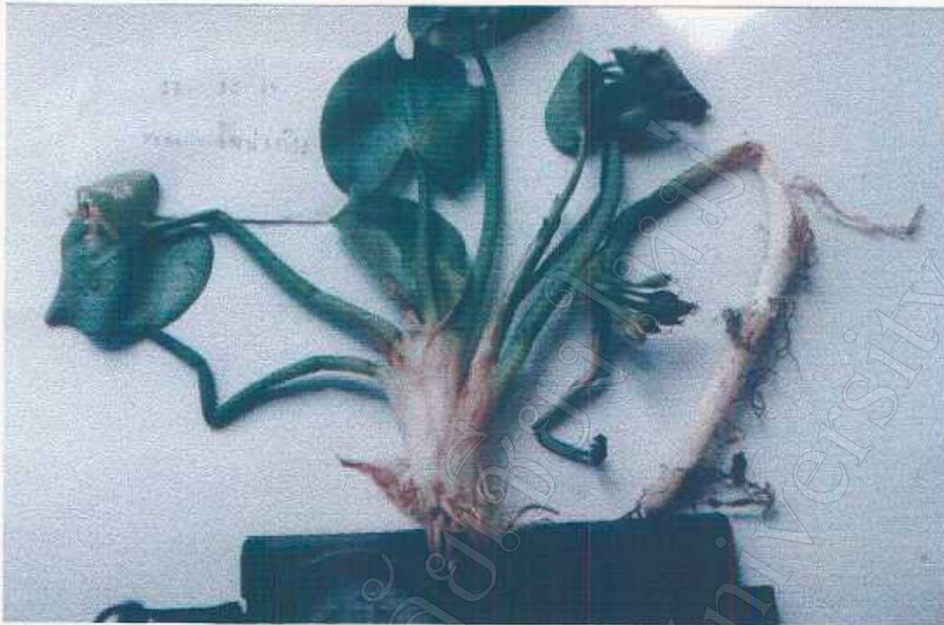
Monochoria hastata (L.) Solms Pontederiaceae Fresh / cooked leaves edible