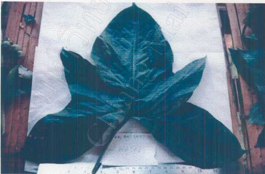
Lasia spinosa (L.) Thw. Araceae Cooked leaves edible