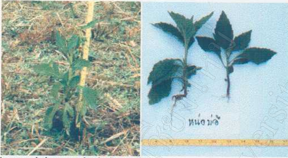
Crassocephalum crepidioides Compositae Fresh leaves edible and also used as fodder