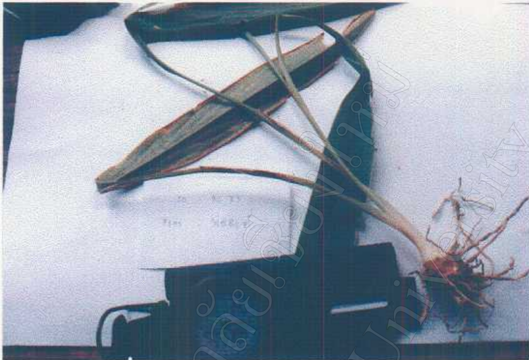
Alpinia malaccensis (Burm. F.) Rosc. Medicine