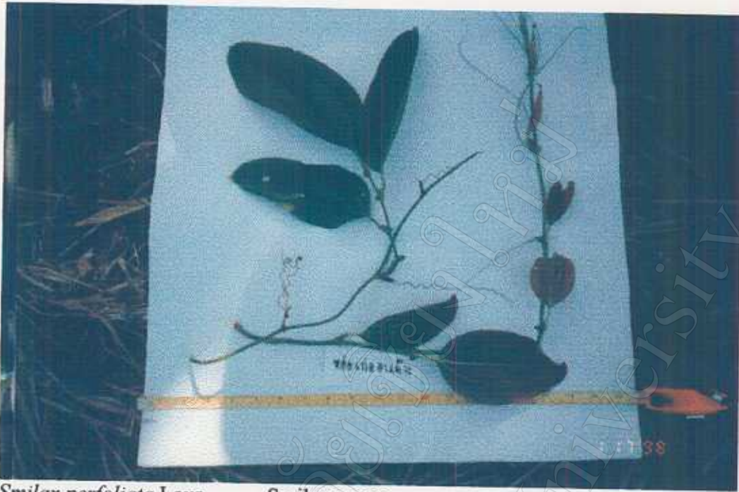
Smilax perfoliata Lour. Cooked flowers edible