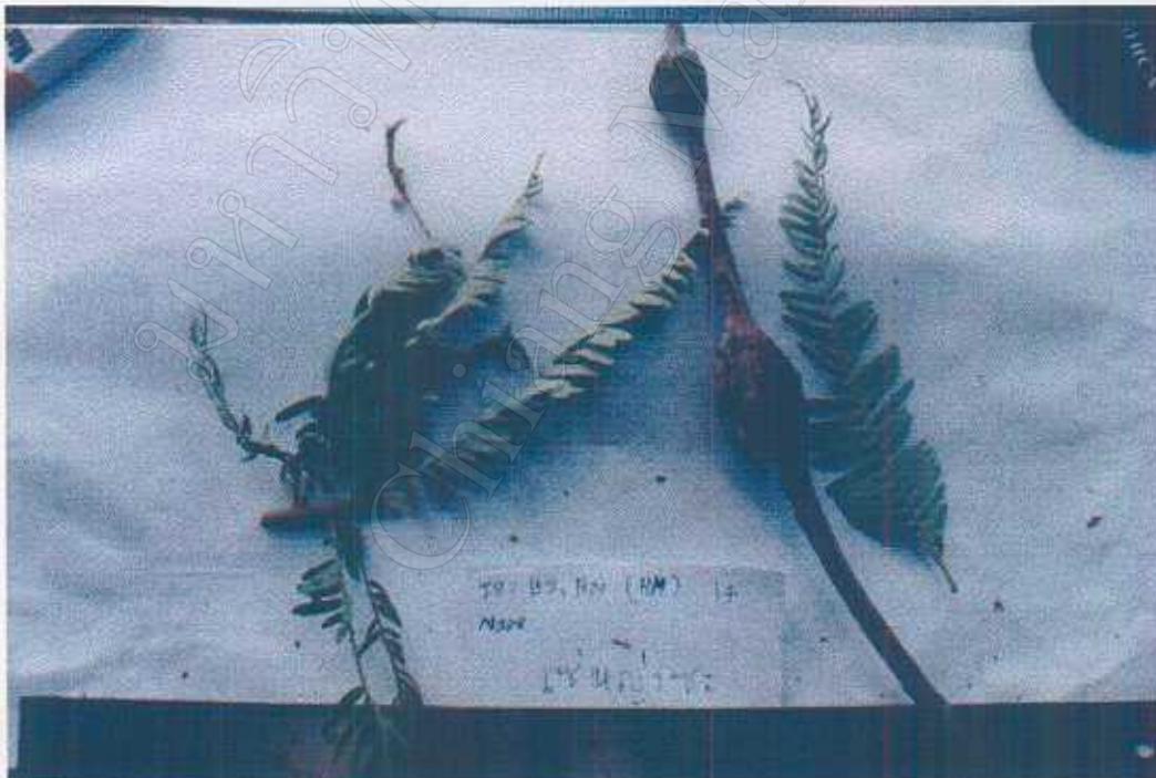
Phyllanthus emblica L. Medicine