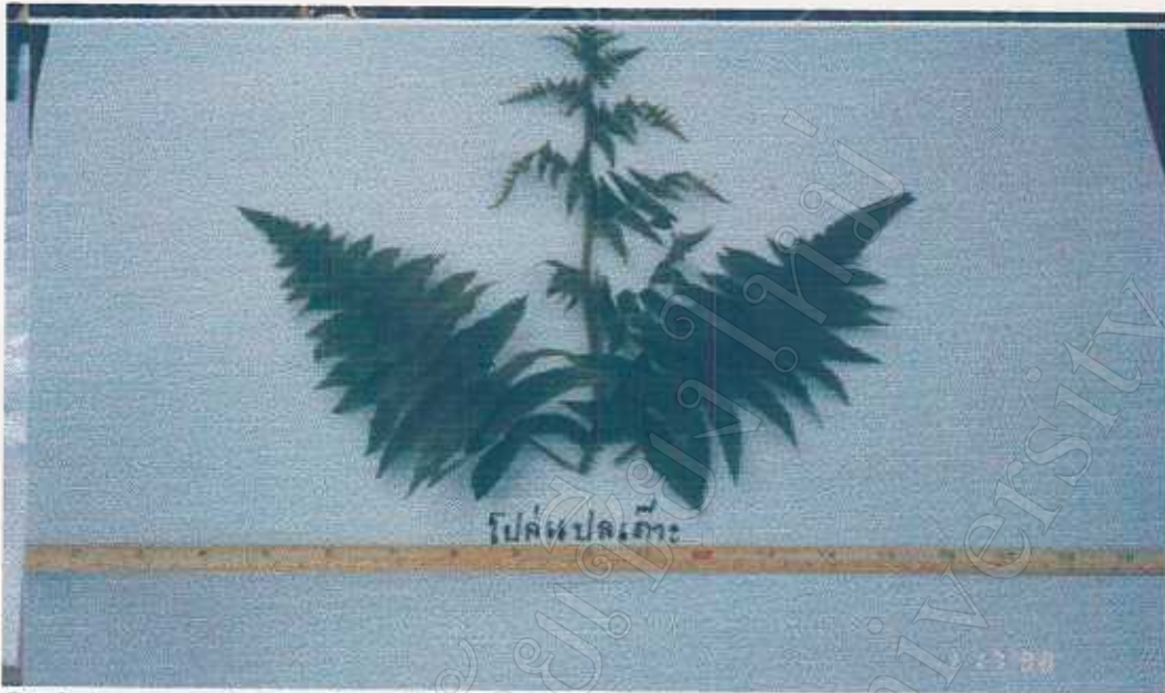
Diplazium esculentum (Retz.) Sw. Athyriaceae Cooked leaves edible