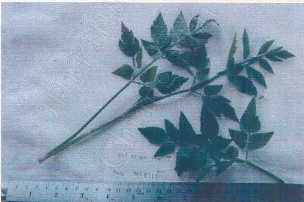
Oenanthe javanica (Bl.) DC. Umbelliferae Fresh leaves edible