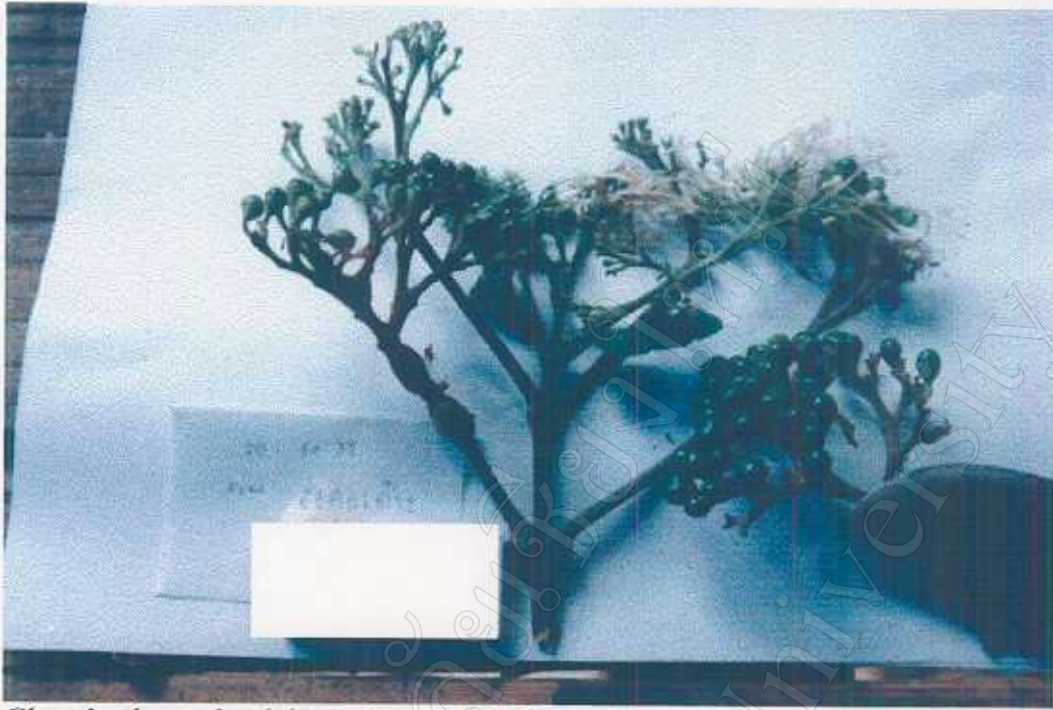
Clerodendrum glandulosum L. Verbenaceae Cooked leaves, flowers, and fruits edible and also used as fodder and dyes