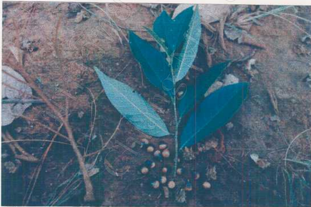
Lithocarpus fenestratus (Roxb.) Rehd. Cooked fruits edible