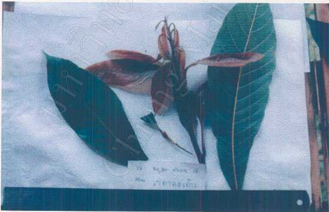
Meliosma simplicifolia (Roxb.) Walp. Sabiaceae Fresh / cooked leaves edible