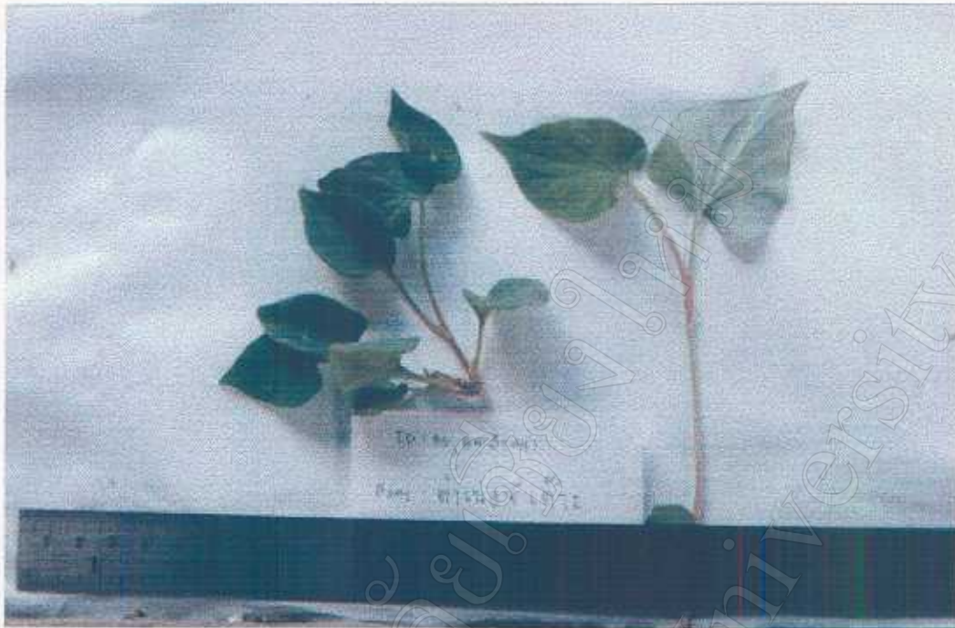
Houttuynia cordata Thunb. Saurauiaceae Fresh leaves edible