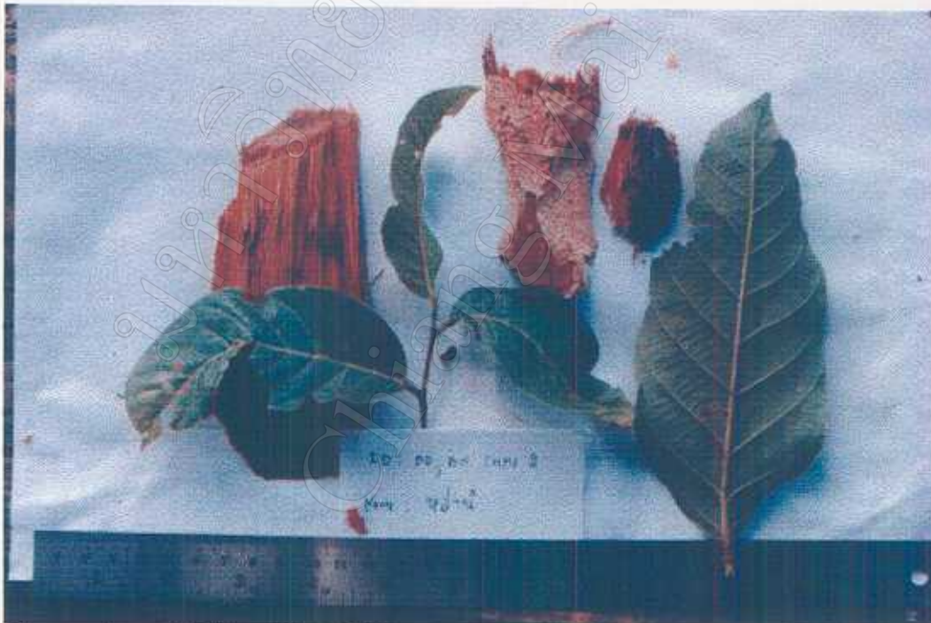
Shorea obtusa Wall. ex Bl. Dipterocarpaceae Medicine