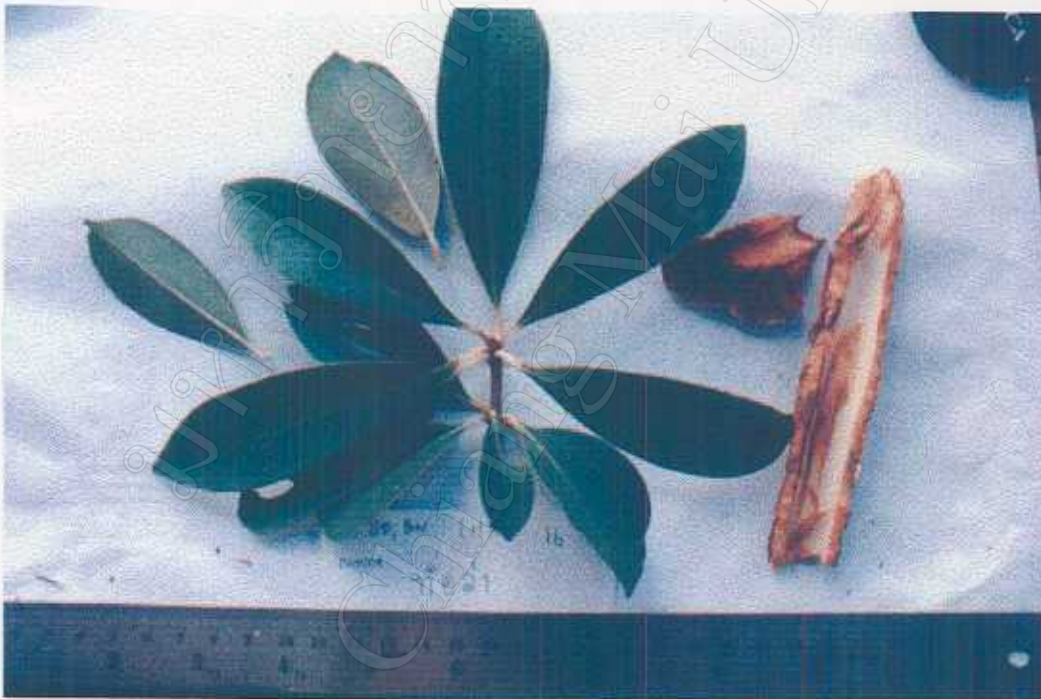
Ternstroemia gymnanthera (Wight & Arn.) Bedd. Theaceae Bark used as dyes