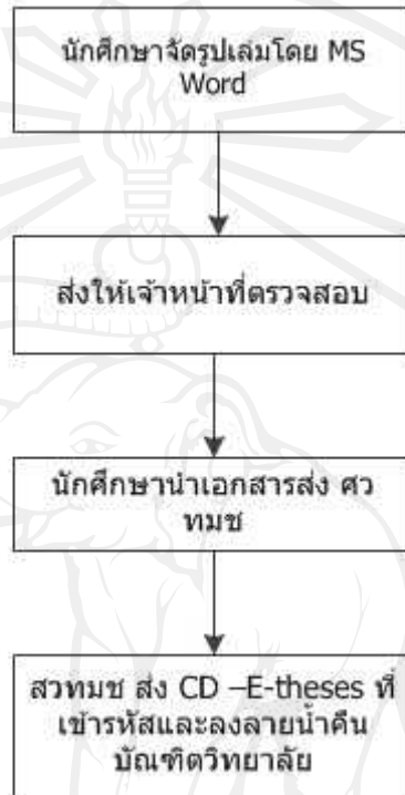
รูป 3.1 แสดงการทำงานระบบงานเดิม

จากระบบงานเดิม ผู้ศึกษาพบว่าระบบงานมีความซ้ำซ้อนซึ่งทำให้เกิดความล่าช้าต่อการปฏิบัติงานทั้งฝ่ายนักศึกษาคาดความเข้าใจในรูปแบบการจัดเล่มวิทยานิพนธ์/การค้นคว้าแบบอิสระ ที่ถูกต้องตามระเบียบที่ทางมหาวิทยาลัยกำหนดรวมถึงทางบัณฑิตวิทยาลัยยังขาดแคลนสถานที่ที่ใช้ในการเก็บซีดีรวมวิทยานิพนธ์/การค้นคว้าแบบอิสระจึงไม่สามารถจัดเก็บได้อย่างเป็นระบบ