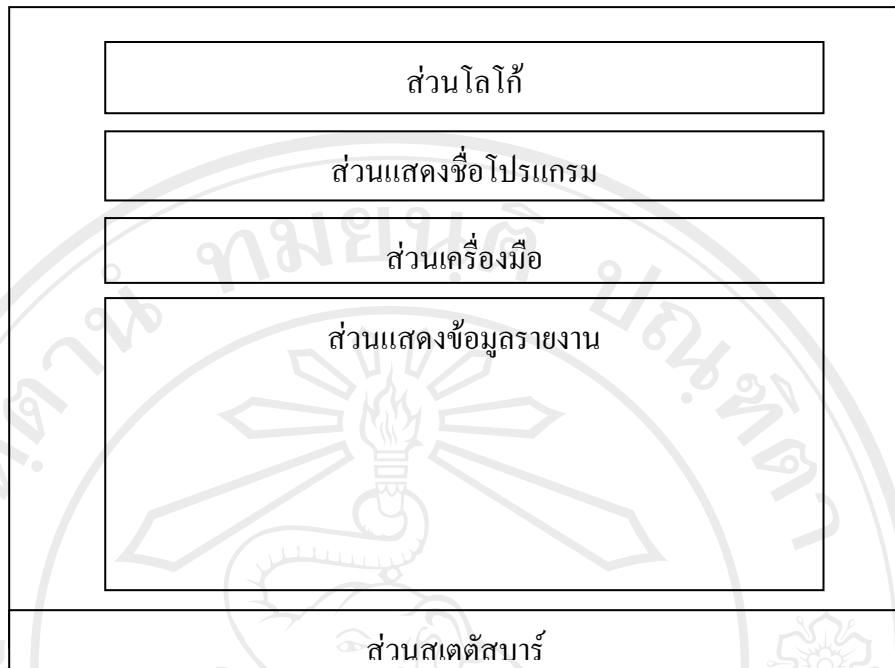
รูป 4.4 แสดงการออกแบบจอภาพรายงาน

ในส่วนของรายงานนี้ เมื่อมีการดูข้อมูลรายงาน และกดปุ่มพิมพ์รายงาน จะปรากฏจอภาพเงื่อนไขการสั่งพิมพ์ ซึ่งประกอบไปด้วย