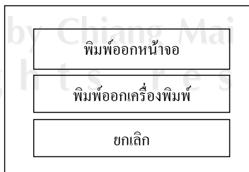
รูป 4.5 แสดงการออกแบบจอภาพเงื่อนไขการสั่งพิมพ์

จอภาพเงื่อนไขการสั่งพิมพ์แสดงได้ดังรูป 4.5