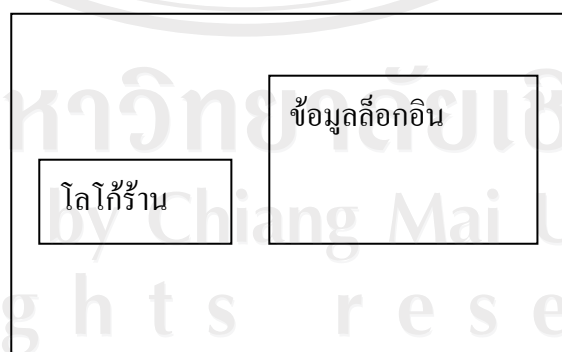
รูป 4.1 แสดงการออกแบบจอภาพถืออินพุต

จอภาพเริ่มต้นของระบบสามารถแสดงได้ดังรูป 4.1