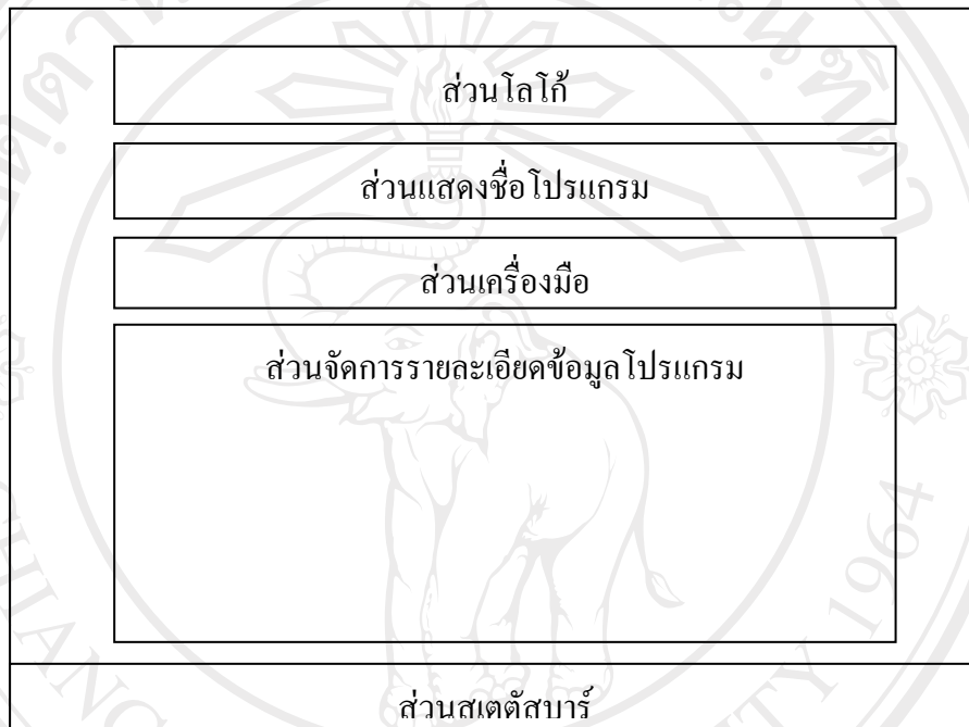
รูปที่ 4.3 แสดงการออกแบบจอภาพโปรแกรม