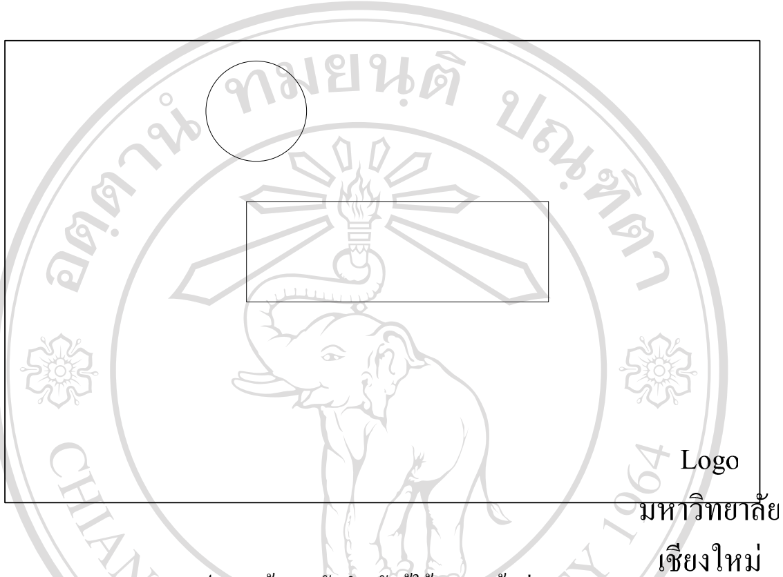
รูป 5.1 หน้าจอหลักสำหรับผู้ใช้ Login เข้า สู่ระบบ

จากรูป 5.1 แสดงหน้าจอหลักสำหรับผู้ใช้ Login เข้าสู่ระบบ ซึ่งประกอบด้วย แบบฟอร์มที่ใช้ในการ Login ผู้ใช้จะต้อง กรอก ชื่อผู้ใช้และรหัสผ่านจึงจะสามารถเข้าไปใช้งานระบบได้ และในหน้าเว็บเพจยังแสดงวัตถุประสงค์ของการจัดทำระบบการตัดเกรดบนเครือข่ายอินเทอร์เน็ต