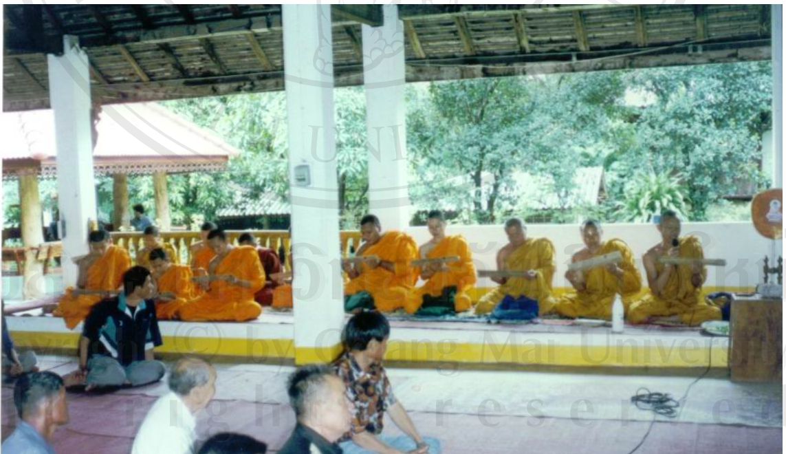
ภาพที่ 7 จัดถวายกัณฑ์เทศน์มหาชาติ