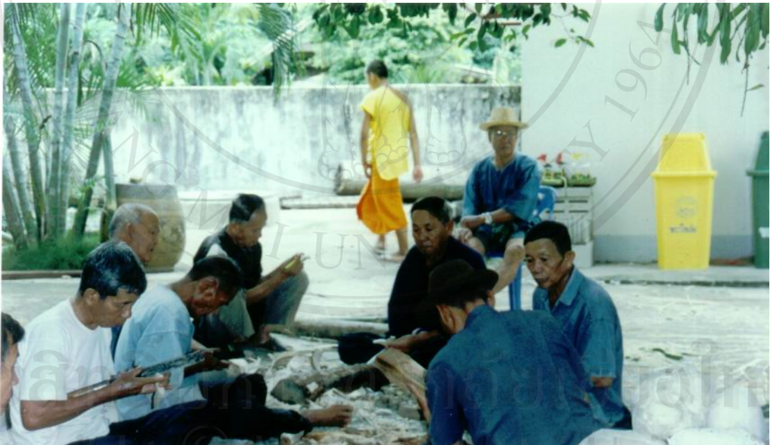
ภาพที่ 1 ชาวบ้านกำลังร่วมกันจัดเตรียมงาน

จะมีพิธีเลี้ยงผีเป็นประจำทุกปี จัดขึ้นในช่วงขึ้น 3 ค่ำ เดือน 9 (เหนือ) มีการเตรียมการก่อน 1 วัน มีการจัดทำโดยใช้ไม้ไผ่มาสานเป็นรูปช้าง และใช้ล้าลิหุ่มรอบตัวช้าง สมมุติเป็นช้างเผือก (ภาพที่ 1 และภาพที่ 2) ใช้ไม้มาแกะเป็นรูปนก รูปปลา และพญานาค ส่วนผู้หญิงจะช่วยกันจัดเตรียมเครื่อง เช่น ไห้ว อาหารคาวหวาน ถิ่นเทศน์มหาชาติ พอถึงวันจัดพิธีเช่น ไห้ว จะจัดขบวนแห่ไปรอบ หมู่บ้าน (ภาพที่ 3) เพื่อให้ชาวบ้านได้รับรู้และได้ร่วมพิธี เสร็จแล้วแห่ไปยังที่ประกอบพิธีบริเวณ ป่าต้นน้ำหรือขุนน้ำ ณ หอผีที่ได้สร้างไว้ดำเนินการประกอบพิธีขึ้นท้าวทั้งสี่ ถวายเครื่องเช่น ไห้ว ให้กับผีขุนน้ำ (ภาพที่ 4) พร้อมกับปล่อยนก ปล่อยปลา ลงน้ำ (ภาพที่ 5) โดยมีความเชื่อว่าจะทำให้ มีความอุดมสมบูรณ์ และปล่อยพญานาคลงน้ำ (ภาพที่ 6) เพื่อดูแลรักษาขุนน้ำไม่ให้แห้ง พระสงฆ์ 13 รูป เทศน์มหาชาติ 13 ถิ่นพร้อมกัน (ภาพที่ 7) หลังจากนั้นจะกลับมาที่วัดพระธาตุภูขวาง เพื่อร่วมพิธีถวายทานสลากภัตต์ (ภาพที่ 8) เพื่อถวายทานให้แก่สรรพสิ่งและสรรพสัตว์ทั้งหลาย ให้อยู่เย็นเป็นสุขและเพื่อให้ข้าวปลาอาหารอุดมสมบูรณ์ เป็นเสร็จพิธี