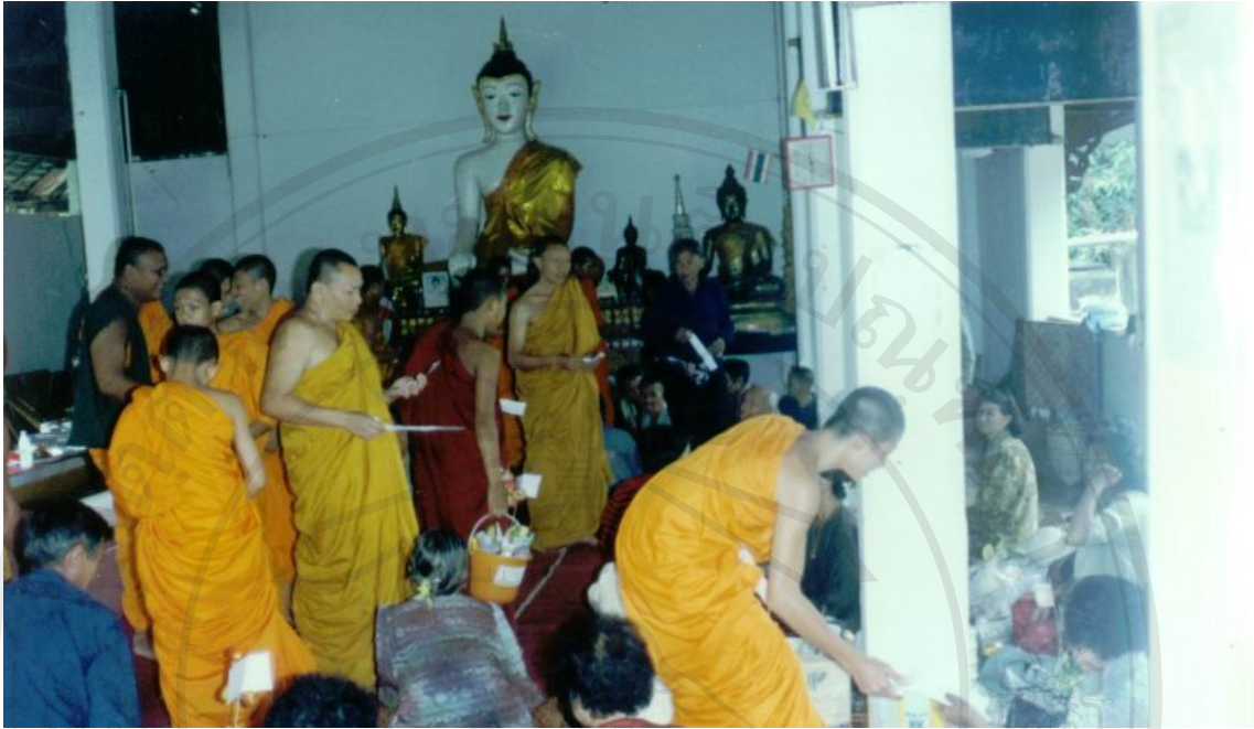
ภาพที่ 8 ถวายสลากภัตต์

ผลของการดำเนินงานมีผลกระทบต่อชีวิตของชาวบ้าน มีคุณค่าและความหมายต่อชุมชน คือพิธีกรรมสามารถเรียกขวัญและกำลังใจชาวบ้านกลับคืนมา ก่อให้เกิดความร่วมมือ ความช่วยเหลือเกื้อกูลกันในหมู่คณะ และก่อให้เกิดความเคารพเลื่อมใสต่อสิ่งศักดิ์สิทธิ์ในหมู่บ้านที่ดูแลรักษาหมู่บ้านและต้นน้ำ