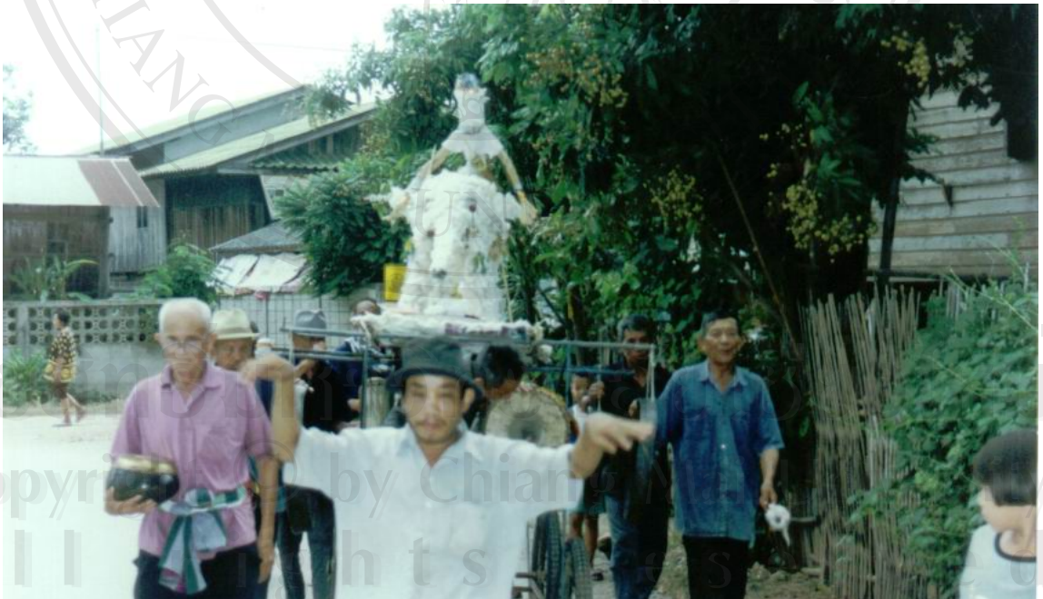
ภาพที่ 3 แห่ซ่างเผือกภายในตำบล