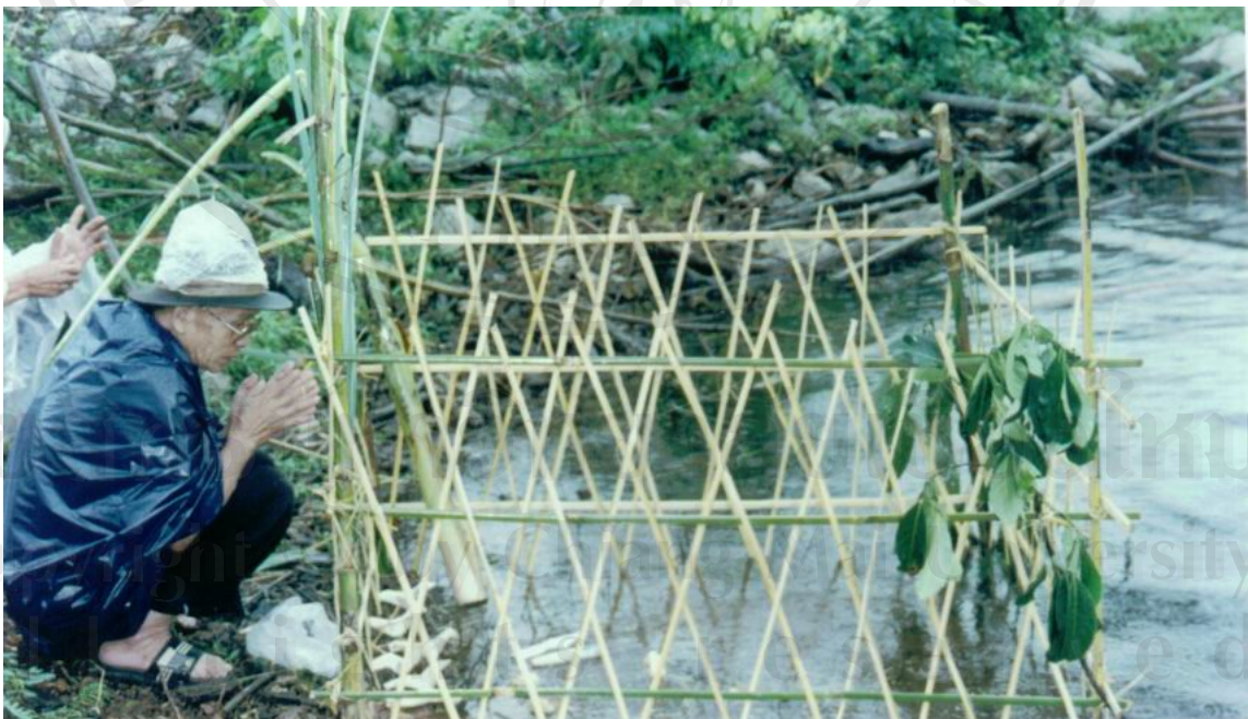
ภาพที่ 5 ปล่อนก ปล่อยปลา ลงน้ำ