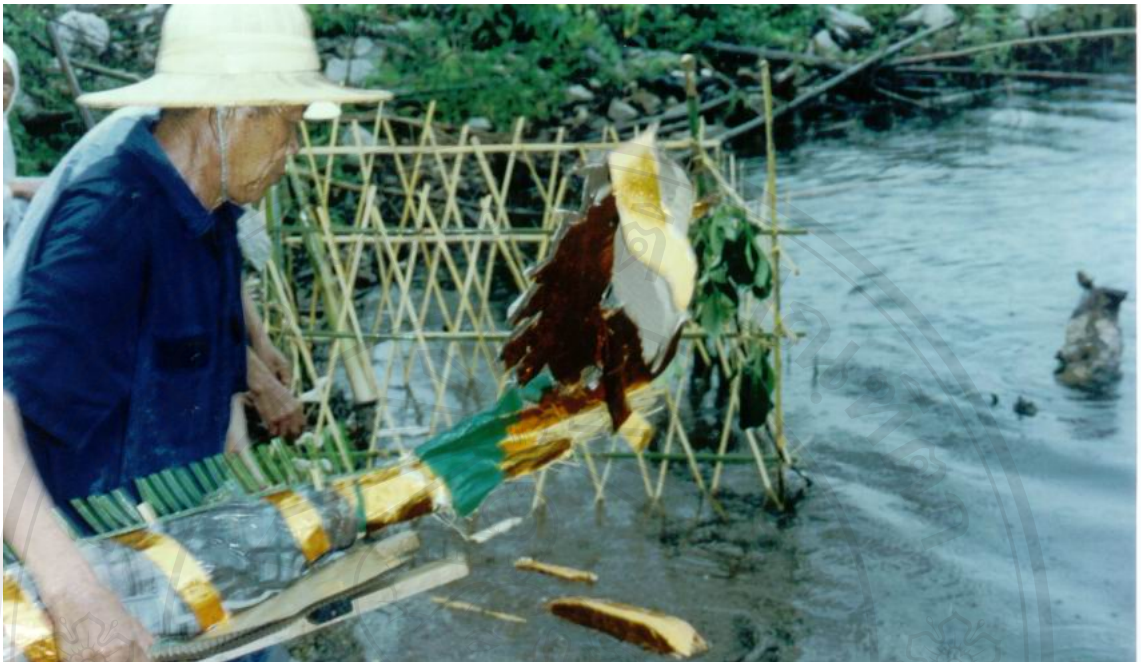
ภาพที่ 6 ปล่อยพญานาคลงน้ำ