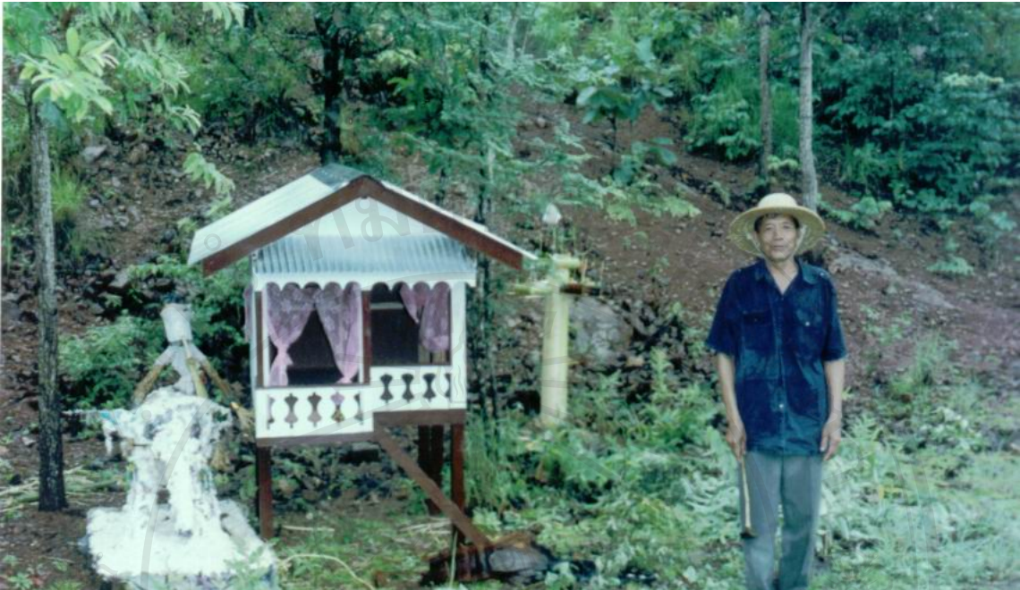
ภาพที่ 4 ถวาช้างเผือกแก่ฝืนน้ำ