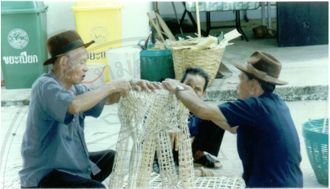
ภาพที่ 2 จัดทำซ่างเผือก