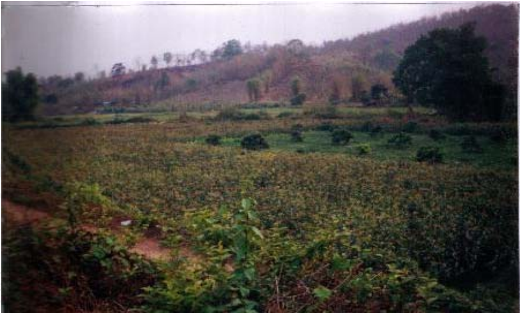
ภาพที่ 4.1 ลักษณะพื้นที่ราบบริเวณเชิงเขาบ้านนาหูก