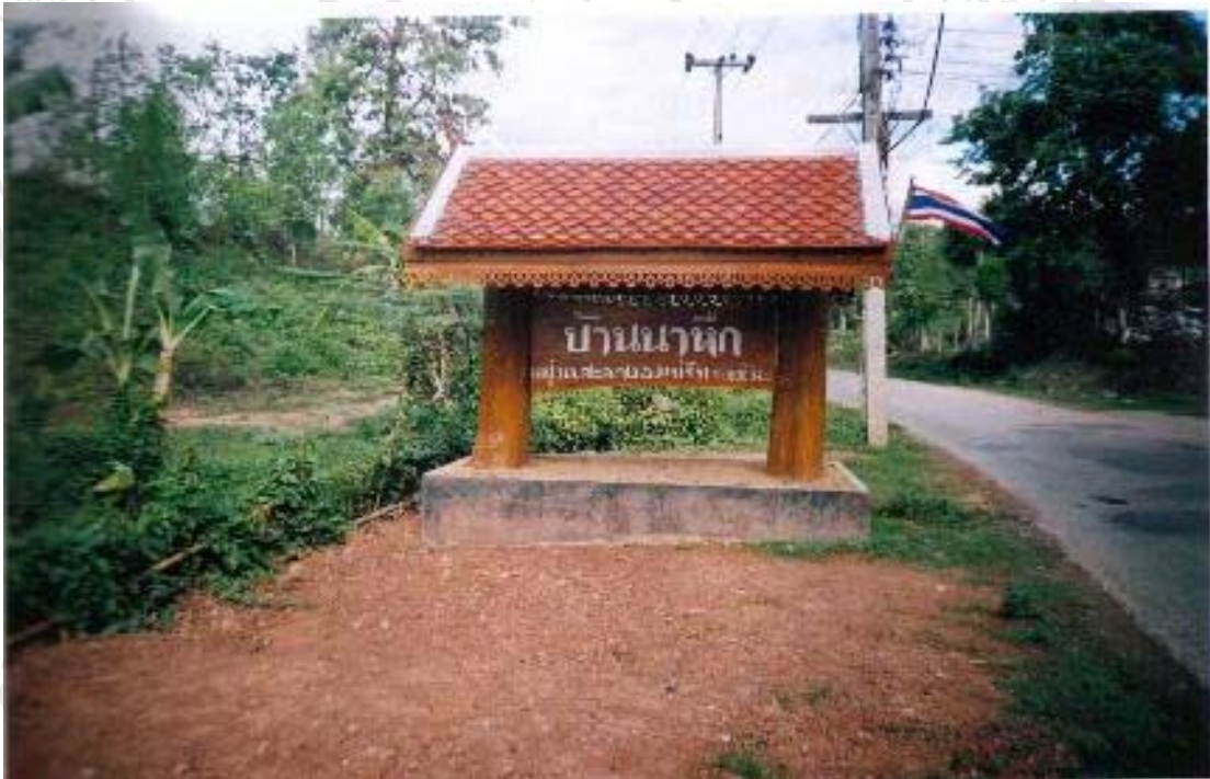
ภาพที่ 4.3 ถนนทางเข้าหมู่บ้านนาหัก

ถนนสายหลักที่เป็นเส้นทางคมนาคมติดต่อสำคัญคือ ถนนลาดยางที่ตัดผ่านหมู่บ้านสายแม่ริมถึงพุทธบาทสี่รอยจากทิศตะวันออกไปทางทิศตะวันตกของหมู่บ้าน ส่วนถนนสายย่อยภายในหมู่บ้านส่วนใหญ่เป็นถนนคอนกรีต มีส่วนน้อยที่เป็นถนนลาดยางและลูกรัง การเดินทางระหว่างหมู่บ้านจะใช้ยานพาหนะคือ รถยนต์ จักรยานยนต์ และรถโดยสารประจำทาง ซึ่งจะมีทุกๆ ครึ่งชั่วโมง ส่วนการเดินทางภายในหมู่บ้านใช้วิธีการเดินเท้าภายในละแวกบ้าน หรือป๊อกลีเดียวกัน เนื่องจากบ้านเรือนส่วนใหญ่จะสร้างอยู่ในบริเวณใกล้เคียงกัน หรืออาจอยู่ภายในรั้วเดียวกัน ซึ่งแต่ละป๊อกจะมีการสร้างบ้านเรือนอาศัยอยู่ร่วมกันหลายๆ ครอบครัว ส่วนการเดินทางต่างป๊อกใช้ยานพาหนะ เช่น จักรยาน หรือจักรยานยนต์ เนื่องจากแต่ละป๊อกมีระยะทางห่างกันพอสมควร