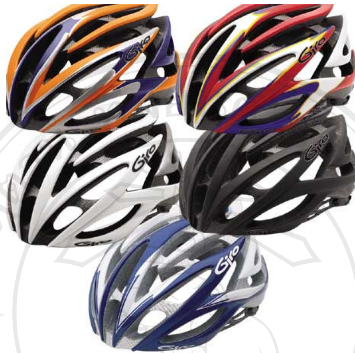
หมวกกันกระแทก GIRO รุ่น ATMOS น้ำหนัก 280 กรัม ราคา 190 $