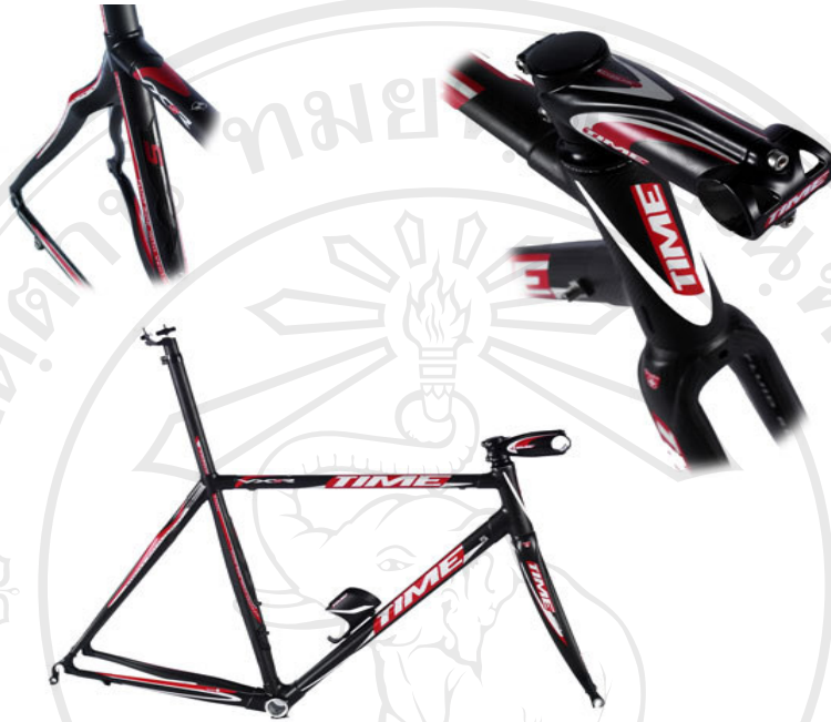
ชุดตัวถังรถจักรยาน TIME รุ่น VX RS น้ำหนัก 1.7 กิโลกรัม ราคา 4,500 $

ตัวอย่างอุปกรณ์จักรยานที่ใช้ในการแข่งขัน