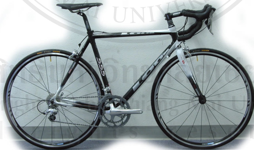
จักรยาน Look รุ่น KG 555 20-speed น้ำหนัก 8 กิโลกรัม ราคา 3,400 $