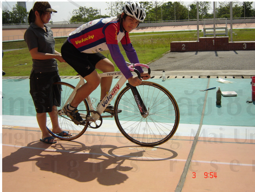
การออกตัว