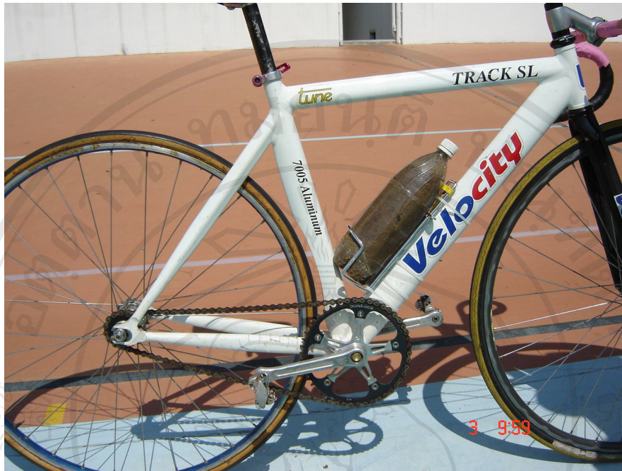
การถ่วงน้ำหนักที่รถจักรยาน