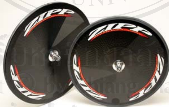
วงล้อแบบทีป (Disk wheel) Zipp น้ำหนักวงละ 0.980 กิโลกรัม ราคา 1,500 $

ลิขสิทธิ์ © Chiang Mai University Copyright © Chiang Mai University All rights reserved