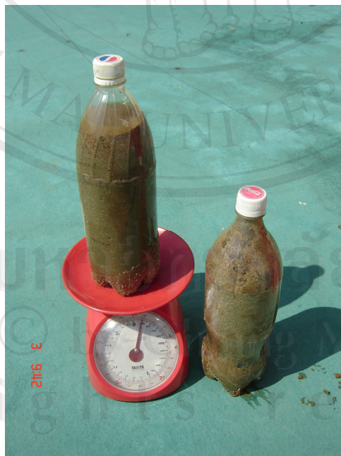
การถ่วงน้ำหนักด้วยทราย