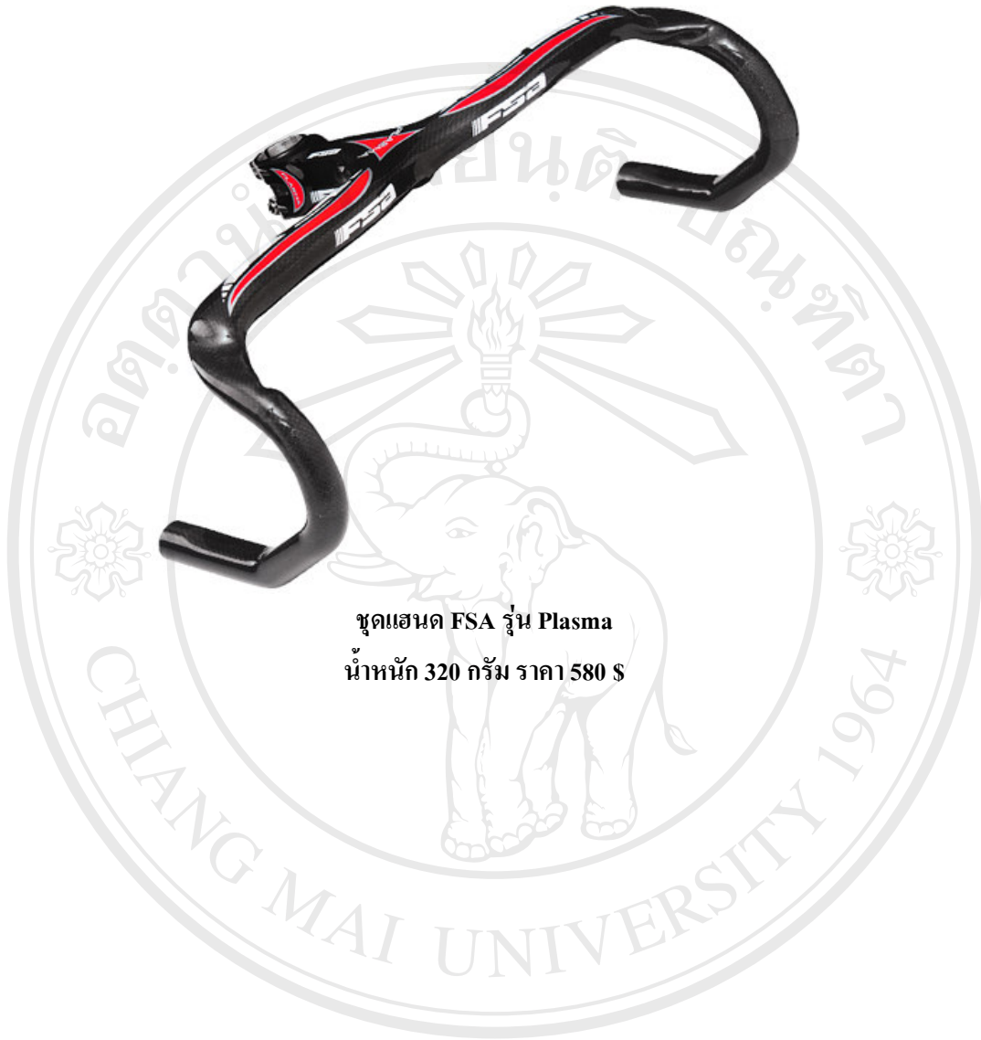
ชุดแฮนด์ FSA รุ่น Plasma น้ำหนัก 320 กรัม ราคา 580 $

ลิขสิทธิ์มหาวิทยาลัยเชียงใหม่ Copyright © by Chiang Mai University All rights reserved