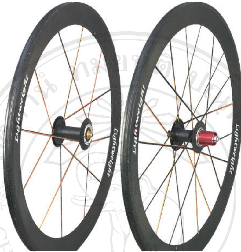
ชุดล้อ LIGHT WEIGHT รุ่น Obermayer น้ำหนัก 1.035 กิโลกรัม/คู่ ราคา 5,500 $