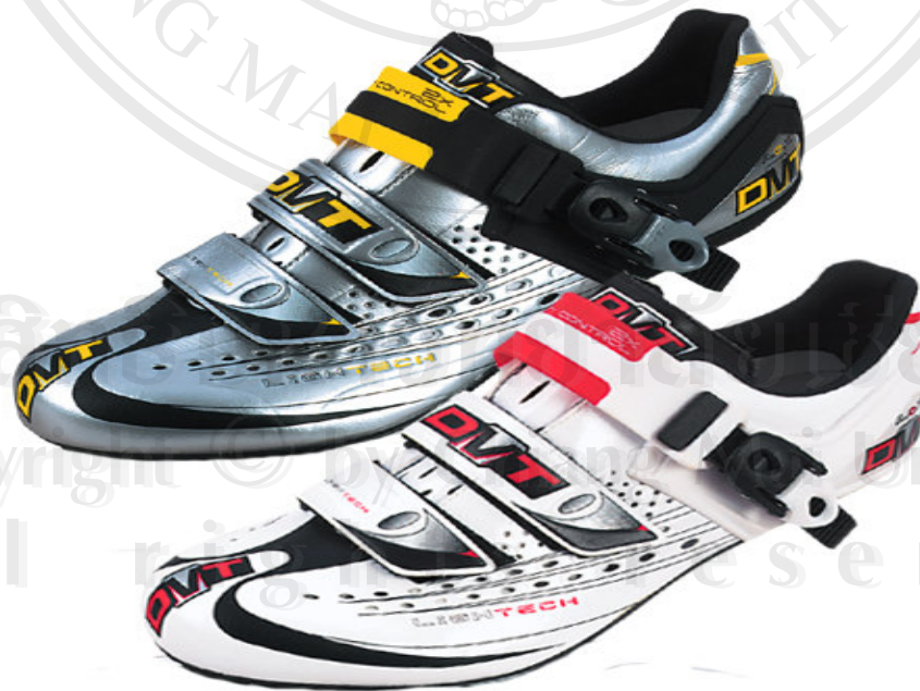
รองเท้า DMT รุ่น Flash ราคา 350 $