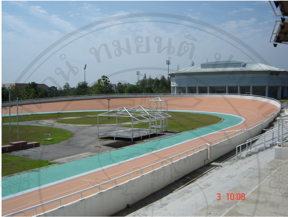
ตัวอย่างสนามจักรยาน (Velodrome)