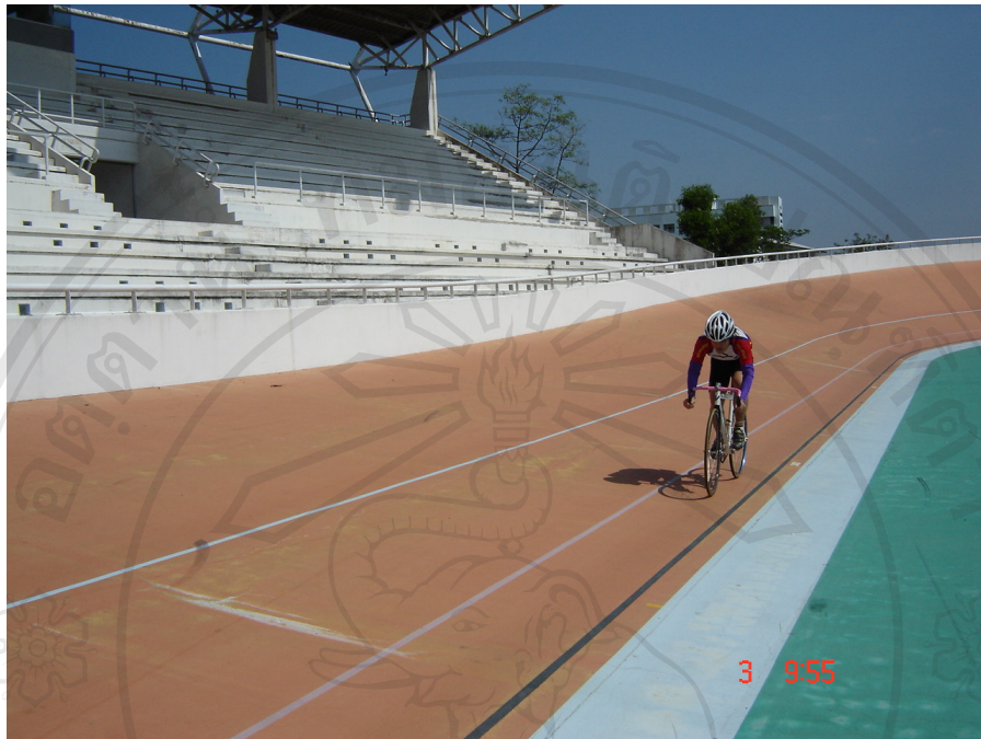
ขณะทดสอบ

ลิขสิทธิ์มหาวิทยาลัยเชียงใหม่ Copyright © by Chiang Mai University All rights reserved