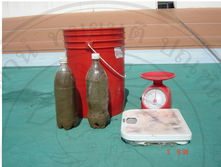
อุปกรณ์ที่ใช้ในการทดสอบ ตาชั่ง และขวดบรรจุทราย