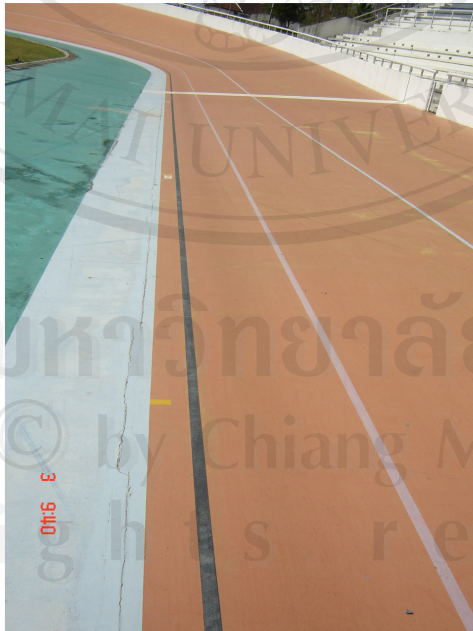
เส้นสีดำคือเส้นอ้างอิงระยะทางเวโลโดรม

ลิขสิทธิ์มหาวิทยาลัยเชียงใหม่ Copyright © by Chiang Mai University All rights reserved