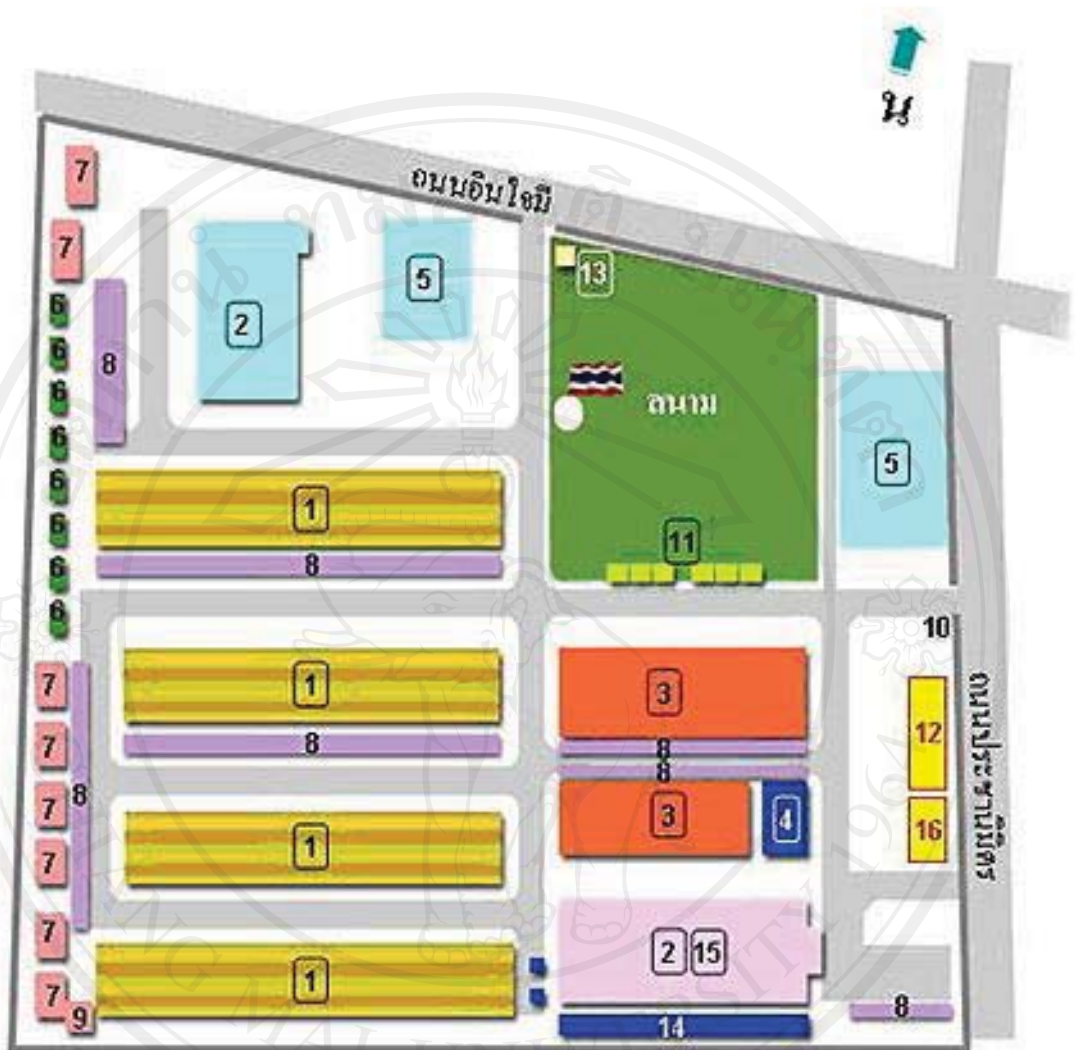
รูปที่ 1.2 แสดงอาคารสถานที่โรงเรียนอุดรดิตถ์