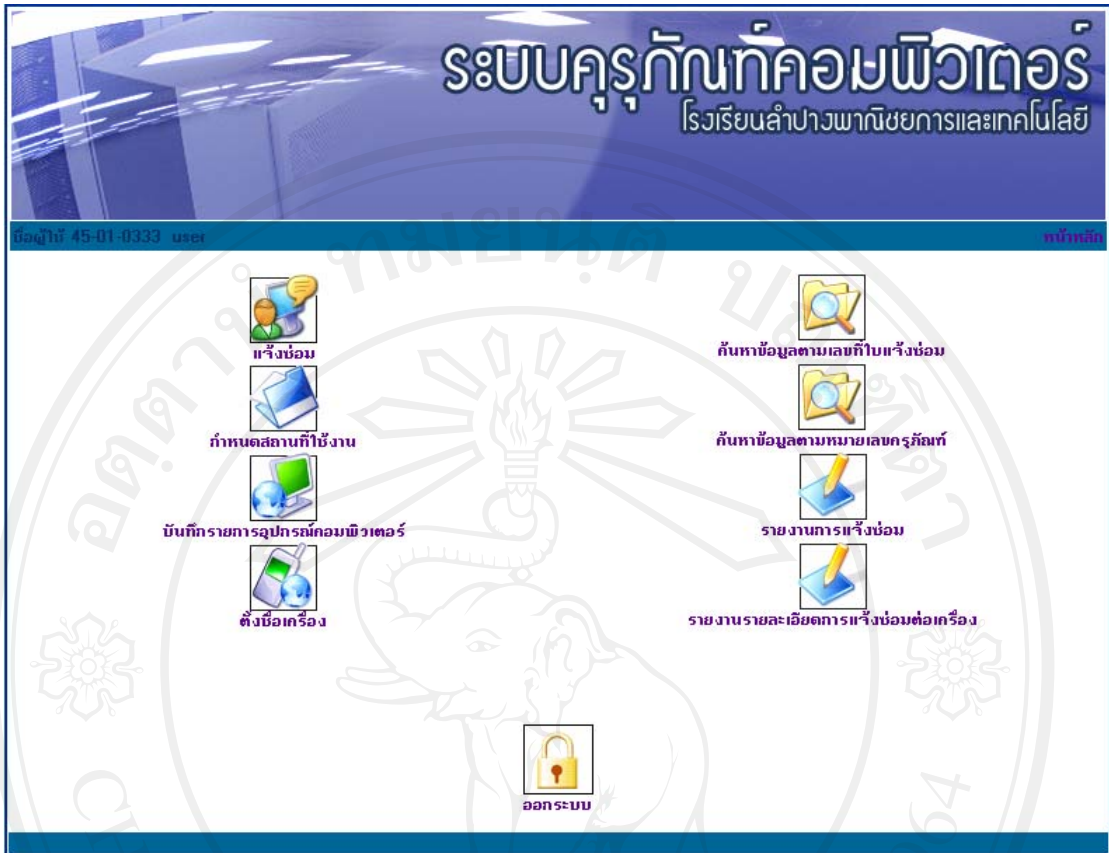
รูปที่ 4.4 แสดงเมนูการทำงานของระบบในส่วนของผู้ใช้