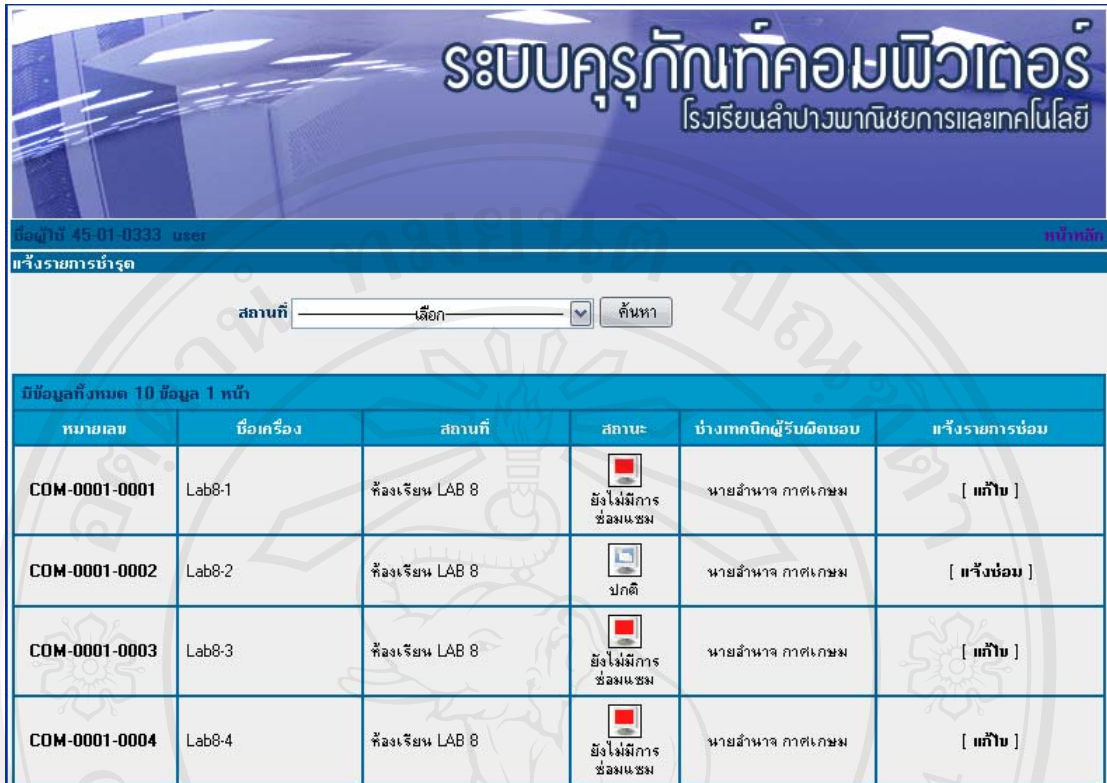
รูปที่ 4.7 แสดงหน้าต่างการทำงานของกรแจ้งซ่อม